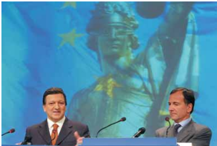
Conférence de presse sur "Le Programme de La Haye" par José Manuel Barroso (à gauche), Président de la Commission européenne, et Franco Frattini (à droite), Vice-président de la Commission européenne.

Ensuite, la coordination des politiques antiterroristes pourrait bénéficier de changements institutionnels. Le texte du traité constitutionnel prévoyait des améliorations considérables concernant la prise de décision dans le domaine de la justice et des affaires intérieures, dont l'abandon des différents piliers. Même si le traité n'impliquait pas la communautarisation des politiques antiterroristes européennes, il apportait une plus grande cohérence aux méthodes et instruments décisionnels, grâce à un ensemble unique d'instruments juridiques et de principes généraux. En outre, la plupart des textes concernant les politiques antiterroristes seraient soumis au vote à la majorité qualifiée et à la codécision. 18 Malgré le refus du traité constitutionnel par les Français et les Néerlandais, il serait donc souhaitable de mettre en œuvre ces éléments de simplification des procédures et des instruments de prise