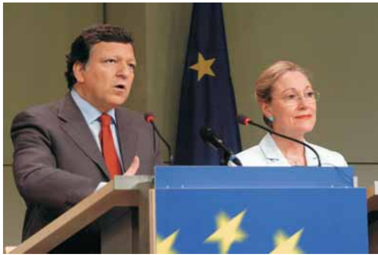
Conférence de presse sur "L'Europe dans le monde: propositions pratiques pour améliorer la cohérence, l'efficacité et la visibilité" par José Manuel Barroso (à gauche), Président de la Commission européenne, et Benita Ferrero-Waldner (à droite), Membre de la Commission européenne.

tandis que la Commission se charge de réaliser des rapports sur l'état d'avancement des progrès réalisés par les pays partenaires. 15 Il est, à cet égard, intéressant de noter qu'une partie du travail préparatoire sur la PEV a été réalisée par le département de la Commission en charge de l'Elargissement. 16 Les domaines prioritaires d'accès établis dans les plans d'action de la PEV s'inspirent largement de la liste des critères politiques et économiques définis à Copenhague en 1993, 17 tandis que l'ap-