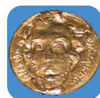
Alexis de Tocqueville Prize