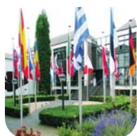
EIPA's Headquarters Maastricht (NL)