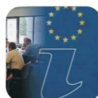
European Documentation Centre