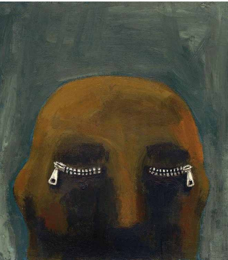
A Caverna , por André Letria