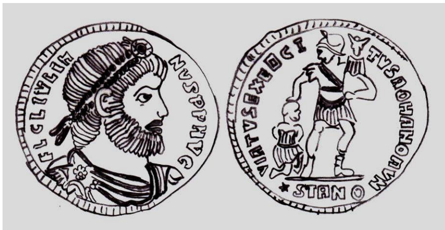
Fig. 1 – Solidus de Juliano: o reverso traz uma referência ao poderio militar do Império romano 3 Desenho: F. Vergara Cerqueira

Podemos afirmar que uma das medidas mais polêmicas adotada por Juliano foi aquela lei, editada em 362, em que ele proibiu aos cristãos o ensino da retórica e da gramática ( CTh. 13.3.5; Jul. Ep. 61c; Amm.Marc. 25.4.20). Juliano seria duramente atacado pelos cristãos por esse motivo e receberia críticas até mesmo entre seus admiradores. Isso se daria em um momento em que o discurso cristão se sofisticava, buscando empreender seus métodos de persuasão a partir do que já lhe era familiar, ou seja, a retórica helênica (CAMERON, 1991, p.38):