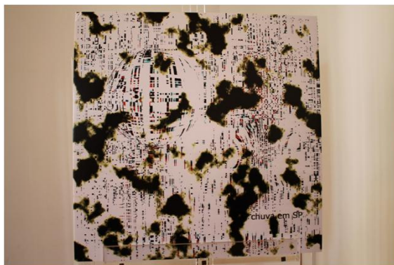
«Chuva em São Paulo».