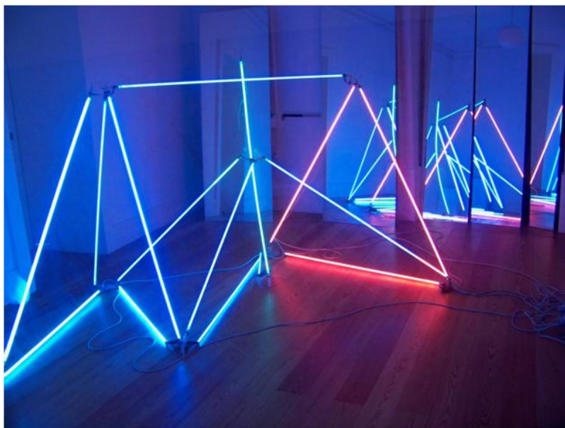
«Meteoro Néon para Vénus» (2001), instalação em néon com dimensões de 260 x 180 x 120 cm.

Essas conexões, porém, mais do que construir um «intencional hibridismo de linguagens» ou uma «contaminação signíca» (Sousa & Ribeiro, Antologia da Poesia Experimental Portuguesa , 2004, p. 353), chamam a atenção na obra de Silvestre Pestana porque, enquanto facultam a experiência do meio, cada um dos elementos está no outro e no outro cria o seu próprio espaço, sem, no entanto, fundir-se para resultar em hibridações. Por isso, trata-se de uma poética sociológica em sua destreza rizomática, pois os elementos não se fundem para formar um terceiro, mas são em si o percurso que há também nos outros. Uma obra de estrutura rizomática que, longe de ser fundamentalmente inflexível, define territórios estáveis dentro dos rizomas.