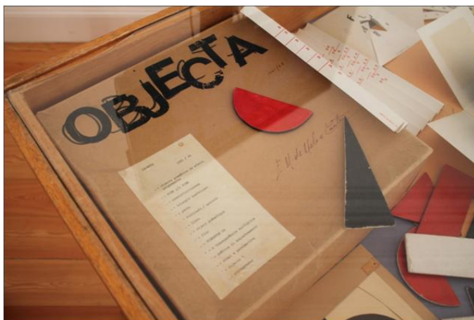
Detalhe da obra «Objecta (conteúdo)», com suas peças «mobiles» realizadas nos anos 50 e 60. O trabalho pertence à coleção do Museu de Serralves.

A Poesia Experimental, que parece algures lutar contra a sua forte marcação histórica, tenta não ser engolida pelo «TecnoCronos», com a banalização das práticas experimentais-tecnológicas. “Hoje já não é mais uma técnica transcendente, eu tenho consciência disso”, diz Melo e Castro diante de um dos seus videopoemas. Mais do que uma autogeração, no passado, trata-se agora de uma autorregeneração desta poesia empírica, fruto de um deus que se sabe, mais cedo ou mais tarde, devorar seus filhos.