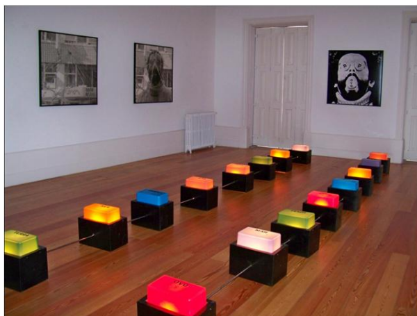
Visão parcial de «Tecno-labirinto» (1979), instalação composta por quatro fotografias de 100 x 100 cm e por 16 peças eletrificadas. A fotografia que não aparece na imagem é a reprodução da última fotografia da parede esquerda e está posicionada simetricamente a ela na mesma parede.

Eis nesses questionamentos o que o artista chama de «problema das constantes entre-coisas». No trabalho de Silvestre Pestana, podemos observar que há uma (dis)tensão entre a potência – as possibilidades do ser, aquilo que ainda não é mas pode vir a ser – e o ato, a ação – a manifestação atual do ser, aquilo que já existe –, numa discussão ontológica que é maquinada sob uma perspectiva sociologizada. (Até a transição que o artista faz para o mundo virtual vem intensificar a problemática da potência em sua obra, afinal, a palavra «virtual» está originalmente ligada à ideia de «vir a ser»). Daí ser tão caro ao artista elementos como o útero, a estufa, o aquário e, claro, o ovo.