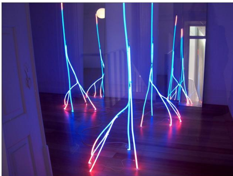
«Fractais» (2002), instalação em néon com dimensões de 190 x 80 x 80 cm.

Pois de raízes intercambiáveis, quando não incandescentes, Silvestre Pestana é esse artista-mundo que, com toda a paixão e compromisso que tem para com tudo o que fez e continua a fazer, instiga a refletirmos sobre as gerações e os seus meios de inscrição. O universo de Pestana é uma boa oportunidade para entendermos os «grãos de simplicidade», como ele costuma dizer, da coexistência (existência-potência, existência-ato) entre o passado e o presente nessa crise dos tempos, ou tempos de crise.