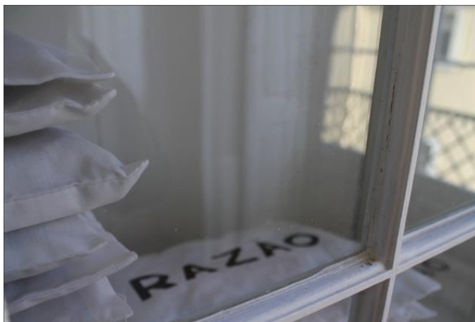
Detalhe de «Razão / Muro da Razão».

«Razão / Muro da Razão» é uma das instalações que fulguram este declínio da razão e a crise da representação. Na obra, sacos brancos, em forma de traveseiros e com a parte superior a enunciar a palavra «RAZÃO», são empilhados em fileiras num louceiro embutido na parede. As fileiras diminuem da esquerda para a direita, como se num gráfico de colunas em que a «RAZÃO» é a unidade que minguia.