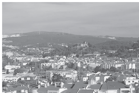
Figura 1 Skyline de Pombal, observado desde poente.

do, dos contornos urbanos das metrópoles do modelo norte-americano de cidade (exemplares nesta matéria), no caso de Pombal o perfil reflete o que ocorre em lugares de sopé. O mais conhecido enquadramento da cidade, o que se observa de poente para nascente, com o foco de observação algures na encosta ocidental que ladeia o vale fluvial, revela um skyline duplo: uma primeira linha modelada pelo castelo, pela encosta que desliza até ao vale do Arunca e por um alinhamento suave de colinas adjacentes; num plano secundário, sobressai um perfil marcado pelas cotas mais elevadas da serra de Sicó que se avista desde a cidade, esventrada por uma pedreira e com cumeadas agora coroadas por uma dezena de aerogeradores que sobressaem num concelho que também aderiu ao ciclo das energias renováveis (Figura 1).