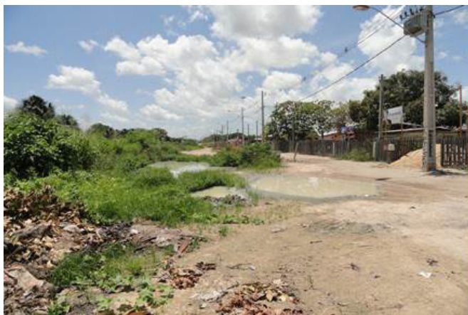
Foto 1 - Conjunto Nova Esperança/Boa Vista

população que habita a área de estudo. Os vencimentos familiares ficam abaixo de dois salários mínimos nacionais, ou seja, R$ 724,00, setecentos e vinte e quatro reais. Há famílias que sobrevivem com menos de um salário mínimo e ainda têm mais de cinco filhos. No contexto da expansão urbana de Boa Vista, essas localidades apresentam algo diferente das demais. O Conjunto Cruviana surgiu da iniciativa pública, a partir do projeto de intervenção social, denominado Minha Casa minha Vida, apoiado pelo Governo Federal. Enquanto isso, o Loteamento Nova Esperança foi fruto de uma ocupação organizada pelos próprios moradores, no final da década de 2000, foto 1.