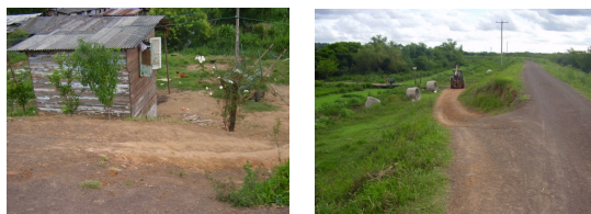
Fot. 6 e 7 - Edificação em berma de equilíbrio e rampa de acesso irregular/tráfego pesado.

http://www.wittler.com.br/engenharia/site/default.asp?TroncoID=906480&SecaID=707260