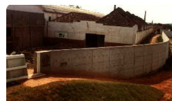
Fot. 5 - Muro de contenção no centro de São Leopoldo (época de implantação).