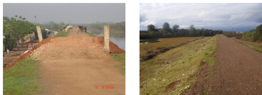
Fot. 3 e 4 - Reparo em dano causado por construção de rampa irregular ao dique e situação atual.

Em trabalho de campo para a identificação de falhas e danos no SCEVRS verificou-se a existência de todos os fatores de risco apontados (Canoas/São Leopoldo). Ocorrência de erosão ao longo de todo o percurso dos diques devido a passagem de pessoas e veículos, construção de moradias irregulares em bermas de equilíbrio (Fot.6), construção de rampas com corte de talude (fot.7), com remoção de grande quantidade de massa do corpo do dique, o que provoca seu enfraquecimento, e tráfego de carros e tratores. Em outro local (Fot. 3) observa-se um reparo, feito pela municipalidade, na parte danificada do dique por construção de rampa irregular de acesso, reparo este que, logo depois, foi demolido pelos utilizadores. Vemos um trecho normalizado do dique (Fot.4).