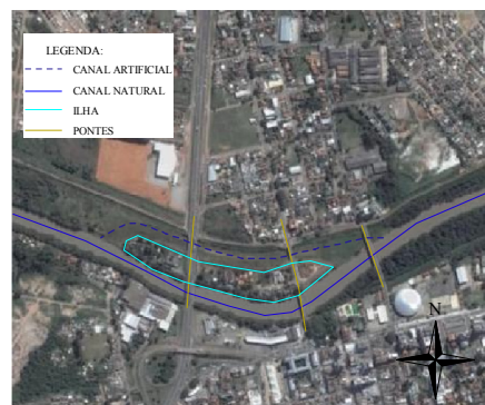
Fig. 3 - Canal artificial no ponto de estrangulamento.

No segundo caso, as ampliações necessárias no leito do rio foram substituídas por um canal lateral que desvia para a margem direita a descarga não absorvida pelo leito principal e nas seções das pontes. Reintegrou-se o leito composto à jusante das pontes da BR 116, transformando a zona central da margem direita em ilha (Fig.3).