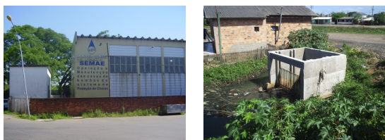
Fot. 1 e 2 - Uma casa de bombas e uma comporta do sistema de macrodrenagem em São Leopoldo.