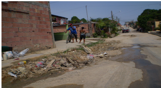
Fotografia 6 - A carência da coleta de lixo.

O metabolismo urbano da comunidade João Paulo II tem deficiências na coleta de lixo, por conta da distância que o bairro tem do centro comercial da cidade e pela classe menos favorecida ser seu contingente populacional principal, ficando para as Secretarias Públicas municipais responsáveis inviável e sem notoriedade investir e beneficiar com serviços públicos bairros carentes como João Paulo, assim, os serviços públicos disponibilizados são precários como a rede de esgoto e drenagem (fot. 1), a coleta de lixo (fot. 6) e pavimentação adequada (fot. 7).