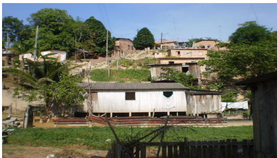
Fotografia 2 - Exemplo de casa construída numa APP; encosta.

Os moradores deste bairro são em maioria de pouco poder aquisitivo, uma vez que grande parte dos moradores da comunidade sobrevive de empregos formais com baixos salários em outros bairros da cidade ou da informalidade, como biscates ou serviços na construção civil, pertencentes à classe social pobre e imigrantes sem renda do interior do Estado, que buscando melhores condições de vida vêm para capital geralmente sem condições financeiras de adquirir moradia em áreas próximas do lugar de trabalho, fixando-se em áreas sem infraestrutura, isto é, de risco pela necessidade de habitação, por este fato não levam em questão a localização e a morfologia da área onde residirão construindo suas moradias em APPs (Áreas de Preservação Permanente), em encostas, margens de igarapés, entre outros (fot.2 e 3).