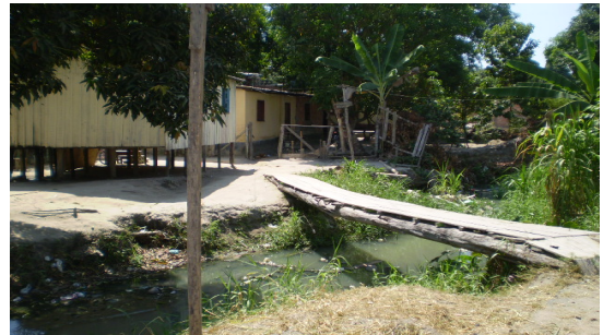
Fotografia 3 - Exemplo de casa construída numa APP, margem de igarapé.

BOURDIER (2003) analisa a relação de poder que existe entre o capital e seu possuidor que permite distanciar o indesejável do seu círculo e aproximar o indispensável e o desejável ao seu ambiente, por isso não se vêem ricos e pobres convivendo num mesmo espaço social e geográfico, isto é, existem espaços de exclusão.