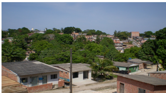
Fotografia 4 - Visão a partir do tabuleiro ao qual é composto João Paulo II e as áreas florestadas existentes.

interflúvios tabulares o que faz com os espaços herdados da natureza só tenham salubridade para moradia se receberam obras de infra-estrutura compatível com a implementação de vias de circulação (ruas, avenidas travessas entre outras) e para a construção de residências sem o perigo de sofrer com processos erosivos, portanto precisam de obras de circulação de águas por galerias subterrâneas. O bairro João Paulo encontra-se em um dos pontos mais altos da cidade, num grande tabuleiro, onde ainda existem enormes áreas florestadas no seu entorno (fot.4).