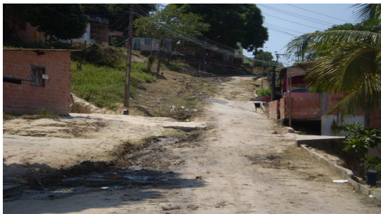
Fotografia 7 - Exemplo de ruas sem manutenção em seu pavimento.

A falta desses serviços públicos de limpeza e coleta de lixo faz com que os moradores recorram a outras formas de depósito de resíduos sólidos como as fossas, ou jogando os materiais nas encostas e igarapés, degradando o meio, colaborando para a aceleração de processo erosivos da encosta e a formação de terrenos próprios para surgimento de doenças ligadas à presença de ratos, mosquitos entre outros (fot. 8).