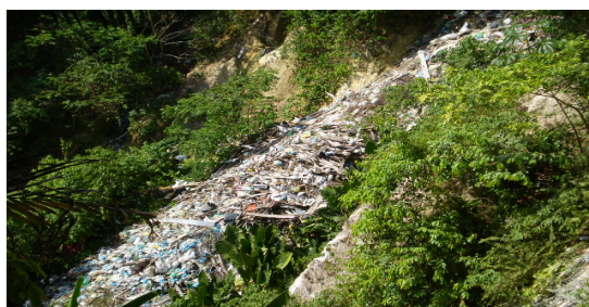
Fotografia 8 - Lixo ao longo da encosta degradando o meio e aumentando o risco de deslizamentos.

A falta desses serviços públicos de limpeza e coleta de lixo faz com que os moradores recorram a outras formas de depósito de resíduos sólidos como as fossas, ou jogando os materiais nas encostas e igarapés, degradando o meio, colaborando para a aceleração de processo erosivos da encosta e a formação de terrenos próprios para surgimento de doenças ligadas à presença de ratos, mosquitos entre outros (fot. 8).