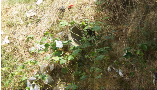
Fotografia 1 - A tubulação não está com manutenção adequada, sem limpeza, o que ocasiona problemas, principalmente quando a água desce a encosta.

moradias e a demora da entrega das casas impulsionou a população a recorrer às ocupações irregulares em locais de risco quebrando o planejamento elaborado pelo Estado. Pela construção de casas próximas a leitos de cursos fluviais conhecidos regionalmente como igarapés e/ou encostas o próprio processo de ocupação sem infraestrutura adequada das construções e circulação das águas servidas, pluviais e fluviais foram os fatores para o surgimento das áreas de risco (foto. 1).