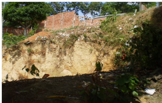
Fotografia 5 - Encosta em processo erosivo onde foi informado pelos moradores o desmoronamento de uma casa, devido a isso alguns moradores do bordo da encosta abandonaram a construção.

Os terrenos que se encontram na via principal (Avenida Mirra) têm maiores dimensões e apresentam melhor estrutura física, por esses motivos os serviços públicos (ônibus, policiamento, etc.), inclusive o centro comercial está localizado nela. Outra característica dessas ruas é que terminam em vertentes mal pavimentadas geralmente com barrancos propícios a desabamento das casas próximas, vale ressaltar que algumas casas da beira dessas encostas já desmoronaram e alguns moradores desistiram das construções pelas constantes quedas dos bordos da encosta. (fot. 5).