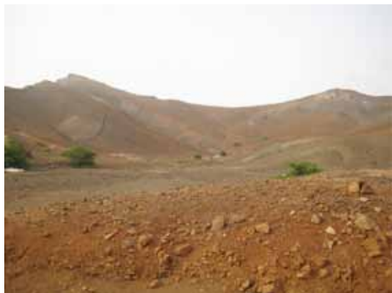
Fot. 4 - Depósito heterométrico de vertente próximo de Baía Norte (São Vicente).

Nada nos autoriza a pensar que as chuvas serão forçosamente mais intensas no futuro, embora, tenhamos consciência de que uma vez ou outra possam ser.