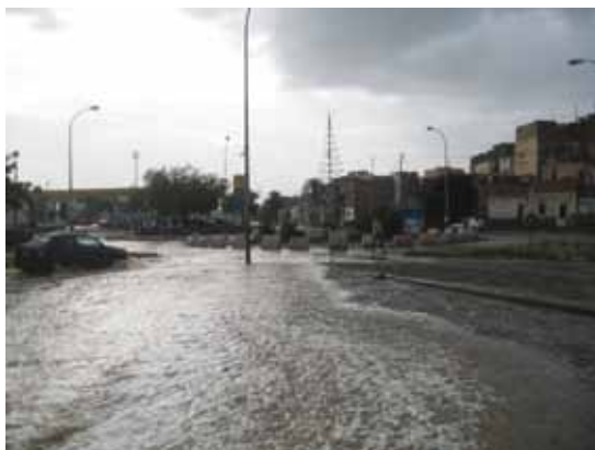
Fot. 1 - Rua do Côco numa situação de crise ocorrida em 28 de Agosto de 2008.

Este processo de construção, muito acelerado, é um dos factores mais importantes no aumento da vulnerabilidade face ao risco de cheias rápidas. Além das habitações, também muitas estradas se encontram em áreas de risco. Algumas são importantes para a mobilidade na cidade, como é o caso da rua do Côco, via de acesso ao hospital central de Mindelo, Baptista de Sousa, que, em períodos de crise, é uma das áreas mais afectadas por cheias rápidas (foto 1). São inúmeros os exemplos de construções clandestinas que ocupam estas áreas (foto 2).