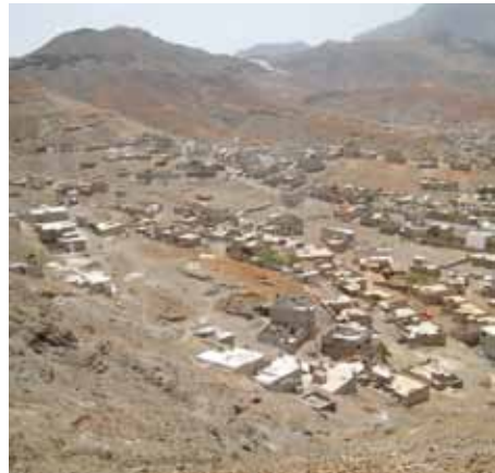
Fot. 2 - Habitações, na sua grande maioria clandestinas, em pequenos canais de escoamento na área de Cruz João Évora

Torna-se então muito interessante observar os grandes canais que atravessam a cidade, canais de dimensão variada, mas com o mesmo objectivo, o de