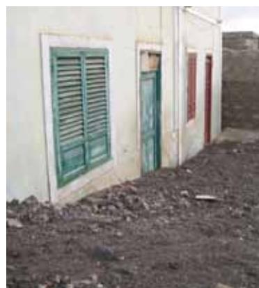
Fot. 5 e 6 Exemplos de habitações afectadas pelo material transportado quando da forte precipitação de 28 de Agosto de 2008.