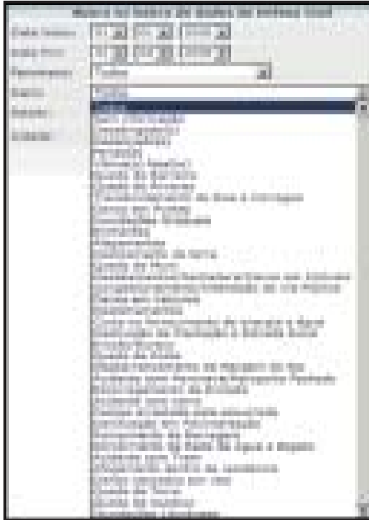
Fig. 3 – Janela de acesso aos danos/ocorrências.

O resultado da pesquisa feita no banco de dados (fig. 4), contém todas as informações da localidade desejada, constando horário da ocorrência, o fenômeno causador e todas os danos decorrentes, inclusive com número de vítimas fatais, feridos, desabrigados e desalojados.