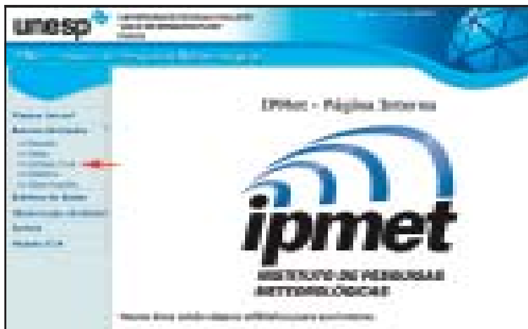
Fig. 1 - Página principal de acesso ao Banco de Dados da Defesa Civil.

Podemos visualizar todos os danos e ocorrências contidas no banco de dados (fig. 3), caso queira um dado específico, é só clicar em cima da opção desejada, e se desejar verificar todos os eventos do período, basta clicar na opção Todos .