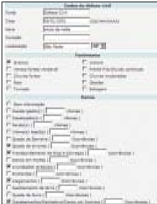
Fig. 5 - Parte da tela de alteração/inserção dos dados

(interpretador php); Debian 4 (sistema operacional do servidor); MySQL 5.0 (banco de dados).