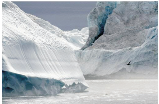
Fot. 4 - Mudanças climáticas.

Os novos riscos são qualitativamente diferentes dos riscos da sociedade industrial. Embora reconhecendo que os países pobres são naturalmente mais vulneráveis aos riscos do que aos países ricos, Beck considera que os riscos tendem a ser "globais" como os resultantes de mudanças climáticas (fot. 4) transcendendo as fronteiras nacionais, afectando potencialmente toda a humanidade e todas as formas de vida animal e vegetal (BECK, 1992: 21, 22).