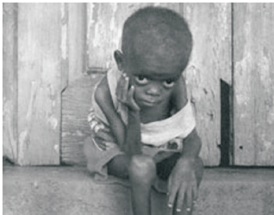
Fot. 3 - Mudança de paradigma na Segurança Humana.

Fundamentalmente, a segurança humana significa uma vida livre de ameaças profundas aos direitos das pessoas, à sua segurança e das próprias vidas. A segurança humana implica proteger as liberdades vitais, proteger as pessoas expostas às ameaças e a situações difíceis, de tal modo que se possam criar sistemas com dispositivos de sobrevivência, dignidade e meios de vida. Isto é, a segurança humana não está só relacionada com a ordem pública e a garantia do cumprimento das leis, mas abarca outras dimensões do ser humano e da relação deste com o seu contexto social e natural, apelando não só à protecção, como também à prevenção e à habilitação das pessoas para valerem-se a si mesmas em situação de vulnerabilidade (fot. 3).