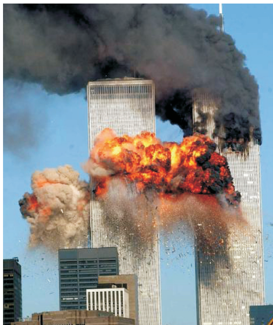
Fot. 1 - Ataque às Torres Gémeas.

muitas caras e dimensões, desde o terrorismo (fot. 1) ao ambiente (fot. 2).