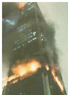
Fot. 10 - Incêndios em edifícios de grande altura.