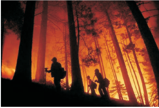
Fot. 8 - Incêndios florestais.

A actividade da protecção civil, exerce-se nos seguintes domínios: