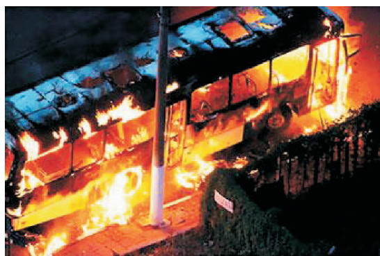
Fot. 6 - Guerrilha urbana.

Quais as principais vulnerabilidades em Portugal?