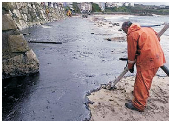
Fot. 2 - Derrame provocado pelo Prestige.

Nalguns casos estamos a falar de segurança política frente a abusos e violações de direitos humanos; de segurança pessoal e individual face à criminalidade e à violência contra as mulheres, ou face ao terrorismo; noutros trata-se de segurança ambiental e ecológica face à degradação do ar, água, terra e florestas (os chamados bens públicos globais); ou ainda segurança alimentar frente à escassez de alimentos ou aos riscos derivados de produtos perigosos para a saúde humana; também a segurança frente a doenças e enfermidades novas e transmissíveis e as enfermidades respiratórias produzidas pela contaminação; finalmente, segurança económica frente ao trabalho precário e à desigualdade de rendimentos. Estamos perante um conceito integrador,