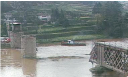
Fot. 7 - Desastre da Ponte Entre-os-Rios.

Mas, todos os anos, somos vítimas das consequências das mudanças climáticas que estão em curso, tanto durante o tempo quente, como as grandes chuvadas, não estando só em causa o nosso interior e as florestas, mas também a nossa costa que, se bem tratada, é uma das áreas que mais receitas pode proporcionar e que tem vindo a ser progressivamente destruída. E tudo se repete anualmente sem grandes melhorias significativas. Grande parte dos desastres que têm afectado o nosso ecossistema é consequência da falta de um correcto, devidamente cumprido e acompanhado ordenamento territorial. "Se as Autarquias têm sido responsáveis por grande parte do desenvolvimento do País, reconhecimento que deve ser feito são, em muitos casos, as grandes responsáveis, não só pelos gravíssimos atentados ambientais que têm ocorrido e que estão à vista de todos, como também pela falta de prontidão da Protecção Civil nas suas áreas de responsabilidade. Estamos, como sociedade nacional, já a pagar o preço de omissões e de decisões desastradas, o que se pode agravar no futuro" (LEANDRO, 2007:16).