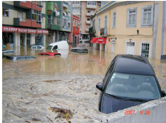
Fot. 8 - Inundações.

Estamos preparados para responder a estes desafios de socorro, designadamente em termos de inundações (fot. 8), explosões e incêndios industriais (fot. 9), em edifícios de grande altura (fot. 10) e florestais (fot. 11)?