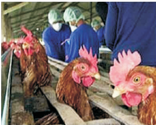
Fot. 5 - Gripe das Aves.

Os “novos riscos” são, em grande parte, riscos “globais”. Os riscos ambientais e de saúde pública mais em foco nos últimos tempos transcendem as fronteiras nacionais. Por exemplo, a propagação de doenças emergentes (como a Sida, a pneumonia atípica) ou a disseminação de produtos alimentares contaminados (fot. 5) acompanham o comércio de mercadorias, a mobilidade das pessoas, a circulação das tecnologias. A omnipresença do risco na sociedade contemporânea encontra-se, assim, estreitamente associada à sua globalização (GONÇALVES, 2002:6).