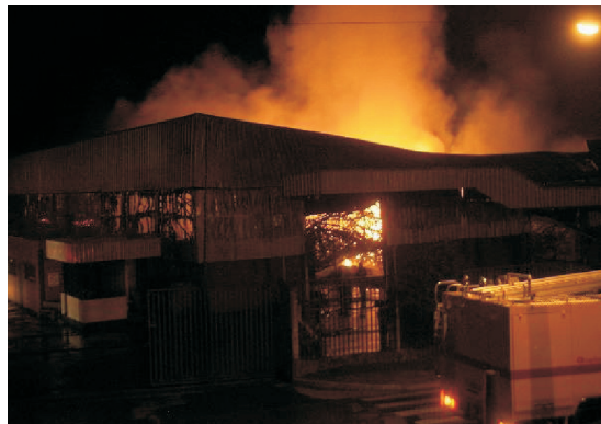
Fot. 9 - Explosões e Incêndios industriais.