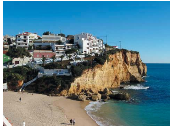
Foto 7 - Praia do Carvoeiro (Fevereiro de 2006). O montão de blocos resultante do desabamento de Fevereiro de 1990 encontra-se agora reduzido a menos de metade da sua dimensão inicial.

Aconteceu que, de Outubro a Dezembro, frequentemente, se conjugaram chuvas intensas com forte acção das ondas, até que, em Fevereiro, uma tempestade desencadeou o processo. O material desabado, com grande estrondo, veio a ocupar cerca de um terço da praia (F. REBELO, 1990, 2003). 16 anos depois, ainda lá está uma pequena parte que o mar não conseguiu desmantelar e transportar (Fot. 7).