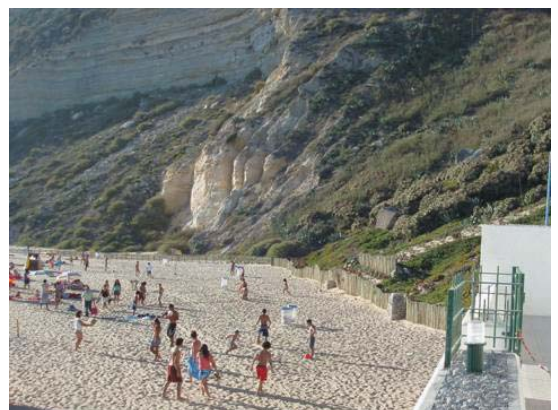
Foto 8 - Praia da Nazaré - base da arriba do Sítio (Agosto, 2006).

Tanto no litoral ocidental, como no litoral meridional, existem arribas em risco de desabamento. Pode falar-se, mesmo, em perigo, tal é, às vezes, a proximidade previsível de uma ocorrência daquele tipo. E isso deve ser dado a conhecer aos utentes das pequenas faixas de areia que se encontram na sua base, tal como aos habitantes que residem no seu topo. Em alguns locais é já vulgar encontrarem-se tabuletas informando sobre o risco ou, mesmo, sobre o perigo de derrocada. Noutros locais, de que pode dar-se como exemplo o caso da Praia da Nazaré, foi, mesmo, interdita a ocupação da areia na base da arriba (Fot. 8, 9 e 10).