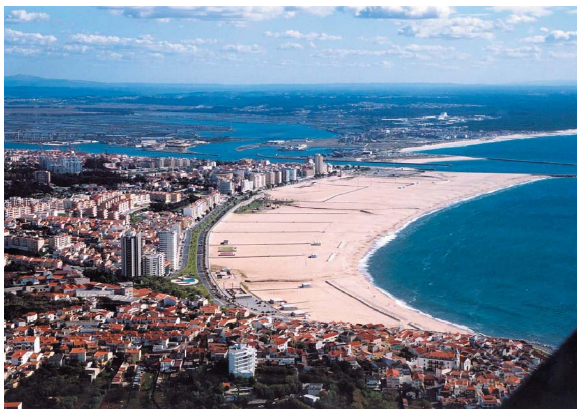
Foto 5 - Figueira da Foz - foz do Mondego (23 de Outubro de 2003)