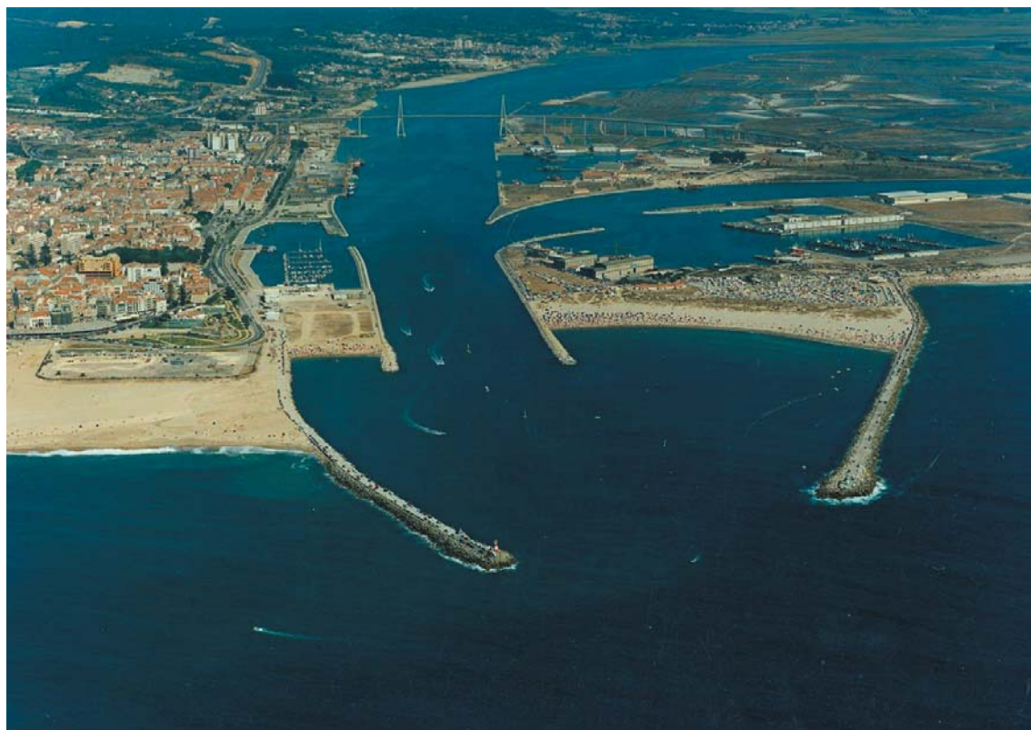
Foto 4 - Figueira da Foz - foz do Mondego (27 de Agosto de 1995, às 16 horas) . Fotografia de Jorge Dias