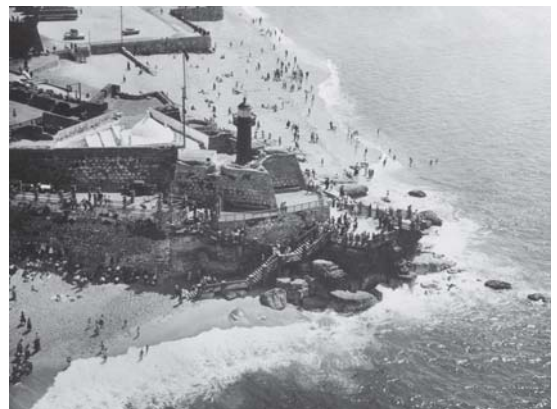
Foto 3 - Figueira da Foz - Forte de Santa Catarina, foz do Mondego (1951).