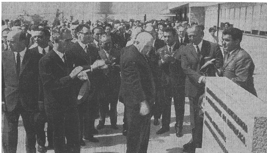
Imagem 1. Inauguração do Centro de Medicina do Alcoitão

Em 2 de Julho de 1966, após cinco anos de trabalhos intensos, o Centro de Medicina de Reabilitação de Alcoitão foi solenemente inaugurado com a presença do Presidente da República, Almirante Américo Tomás, tendo havido considerável difusão do acontecimento na imprensa. A organização da instituição, as balizas regulamentares, os apoios particulares e oficiais definiram claramente os objetivos principais da instituição que passaram a ser muito claros: a reabilitação de pessoas com incapacidade motora e a formação de pessoal especializado.