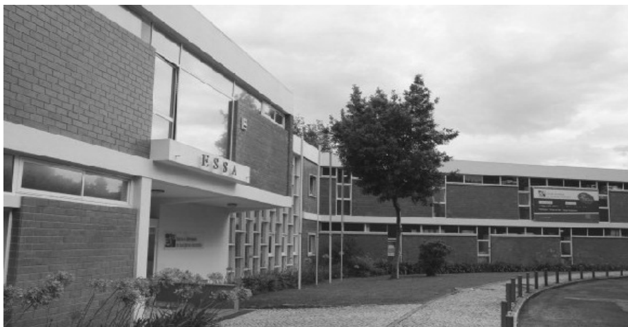
Imagem 4. Escola Superior de Saúde de Alcoitão (In:www.ESSA.pt)

Em 2000 foi autorizado o funcionamento dos cursos bietápicos de licenciatura e quatro anos mais tarde foi publicada a alteração aos Estatutos da Escola Superior de Saúde do Alcoitão, em Diário da República – II Série – Aviso nº 3422/2004 (2ª série) nº 64 de 16 de Março. No ano letivo de 2007/2008 teve início a lecionação do mestrado em Reabilitação Neurológica – especialidade para fisioterapeutas, realizado pelo Instituto de Ciências da Saúde da Universidade Católica Portuguesa, em colaboração com a Escola Superior de Saúde do Alcoitão. A adaptação dos planos de estudos do curso de licenciatura ao Processo de Bolonha ocorreu no ano letivo 2008-2009.