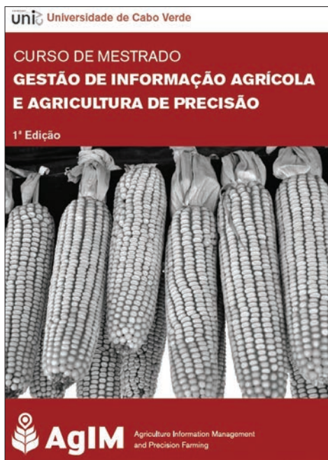
Figura 2 - Brochura do Programa de Pós-graduação e Mestrado AgIM

ta com a colaboração do Instituto Superior de Estatística e Gestão de Informação da Universidade Nova de Lisboa (ISEGI-NOVA) e com o apoio da ESRI-Portugal. O projeto tem as mesmas características do projeto SUGIK e prevê a realização de duas edições e é realizado na Universidade de Cabo Verde e na UCM-Moçambique. À semelhança do SUGIK também visa o estabelecimento de requisitos para a continuidade e sustentabilidade do curso para além do período de implementação, promovendo a capacidade institucional, académica e tecnológica das duas instituições parceiras para oferecer educação de qualidade no campo da Gestão de Informação Agrícola e Agricultura de Precisão. Trata-se de um projeto de cooperação institucional em ensino pós-graduado em Gestão de Informação Agrícola e Agricultura de Precisão, financiado pelo 10º Fundo Europeu de Desenvolvimento (FED) da Comissão Europeia, no âmbito do Programa EDULINK - Programa de Cooperação ACP-EU para o Ensino Superior. A sessão de abertura oficial da primeira edição está prevista para 15 de Setembro de 2014.