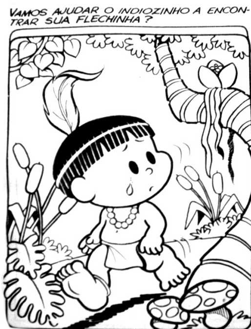
Figura III: Jornal da Manhã , 23 de abril de 1983, p. 5.

Mudar as mentalidades a fim de dissolver tais imagens depreciativas que a população guarda é um processo longo. A tarefa se torna ainda mais difícil se considerar que desde que a criança passa a frequentar a escola é ensinada a ver o índio como personagem folclórico, presente em contos e mitos. Dessa forma, ao desfolhar os livros de história, representações preconceituosas são replicadas e perpetuadas. A obrigatoriedade da inserção de conteúdos de história indígena nos currículos escolares é uma medida que objetiva mudar esta situação.