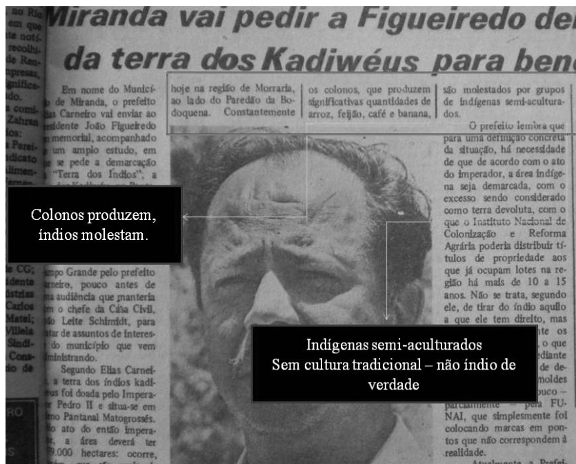
Figura I: Jornal Correio do Estado de 17 de abril de 1980

Por vezes, os textos procuravam dar uma dimensão bem maior do conflito, aproximando-o de uma guerra ao usar precisamente este termo ou o de “guerrilha” associado com refugiados (Figura II). Isso eleva a dimensão das ideias incutidas, pois a mídia ocupa um importante papel na constituição do imaginário popular. A aura de veracidade que atribuímos especialmente aos jornais impressos faz com que muito do que neles é publicado acabe se incorporando às representações coletivas.