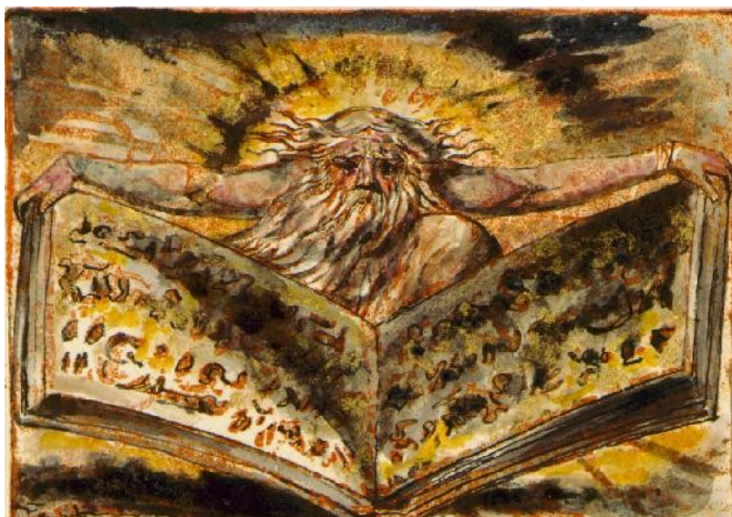
William Blake, The Book of Urizen , copy G, plate 5.

“Digital Creativity: Teaching William Blake in the Twenty-First Century” ilustra as possibilidades recentes de ensino sobre o poeta. Nessa perspectiva pedagógica aberta pelas humanidades digitais e estudos de mídia, ao invés de reforçar o aspecto mítico-profético de sua obra, professores e discentes estabelecem com tais textos uma relação dialógica: incorporando-os num exercício criativo de participação colaborativa, o que resultam são novas obras que redefinem co-criação textual e análise literária no século XXI. À guisa de exemplificações sobre os exercícios que expõem novas metodologias pedagógicas e perspectivas teóricas sobre o legado de Blake, os autores discutem o caso do projeto Blake 2.0: William Blake and Digital Culture [ http://www.palgrave.com/page/detail/blake-2.0-steve-clark/?K=9780230280335 ]. Desenvolvido por um grupo de pesquisa que contou com a dedicação de professores e estudantes do Georgia Institute of Technology, Blake 2.0 propunha ser um projeto de recriação das ideias, personagens e frases do Milton nos canais do Twitter e do Google Docs.