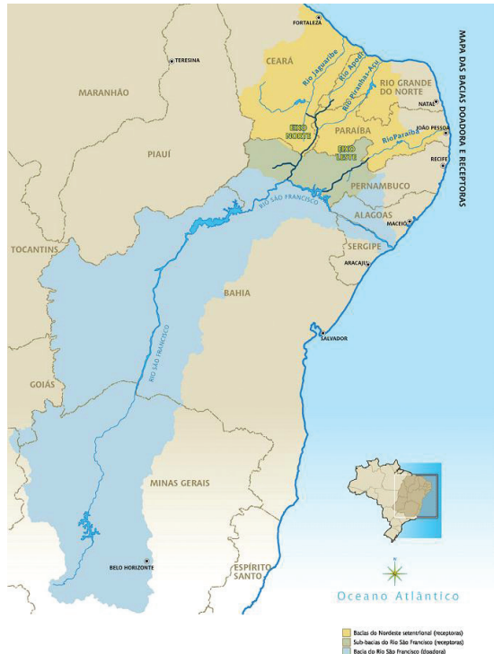
Fig. 1 - Projeção do rio São Francisco após a conexão das bacias doadora e receptoras.

Segundo um morador da Vila, tudo começou quando eles foram abordados nos seus antigos lugares de vivência por um pessoal que trazia uma espécie de questionário. O Ministério da Integração Nacional afirmou no Programa de Reassentamento de Populações (MINc, 2004, p. 4 e 8), que o cadastro fundiário e a pesquisa socioeconômica, realizados na atual fase de projeto básico ambiental, indicaram quem seriam os afetados pelo projeto, parcial ou totalmente: 1 889 propriedades rurais, a serem desapropriadas; 845 famílias, das quais 273 famílias eram proprietárias e 572 famílias não proprietárias, sendo 43 residentes em Cabrobó (QUADRO I).