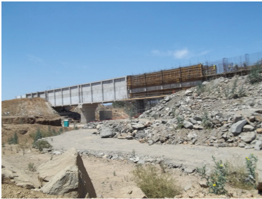
Fot. 3 - Aqueduto sobre o riacho Grande. Rejeitos das obras, sob o riacho (Fotografia de Assis, out. 2013).

Photo. 3 - Aqueduct over the Great stream. Waste of works under the creek (Photography of Assis, Oct. 2013).