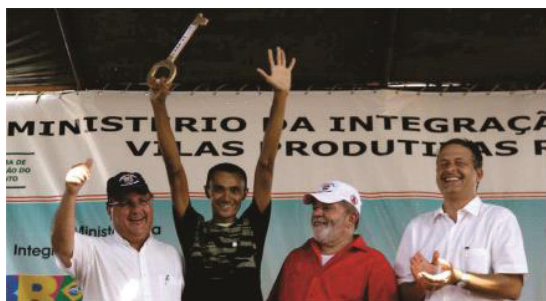
Fot. 1 - O Presidente Lula durante cerimônia de inauguração da Vila Produtiva Rural Junco, em Cabrobó, PE, em 16 out. 2009.

Photo. 1 - President Lula during the opening ceremony of the Rural Productive Village Junco in Cabrobó, PE, 16 October 2009.