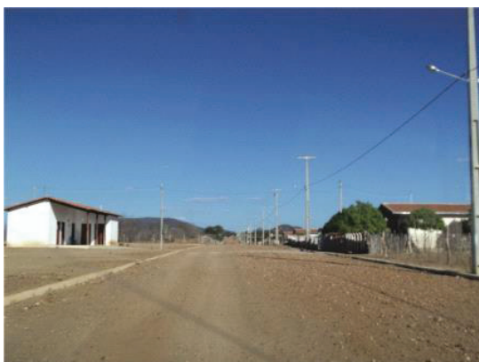
Fot. 2 - Rua principal da Vila Junco (Fotografia de Assis, out. 2013). Photo. 2 - Main street of Vila Junco (Photography of Assis, Oct. 2013).

Como pode ser observado na fot. 2, pela imagem da rua principal, com visão para o posto de saúde e uma série de casas, a vila é semelhante a um bairro residencial popular de programas sociais para moradia nos espaços urbanos do restante do Brasil. Os moradores disseram que houve melhoras nas condições de infraestrutura em relação aos lugares que antes eles moravam, mas, levantam uma série de problemas. Como rachaduras nas casas, que não existe assistência médica adequada, que a escola da comunidade não oferece ensino para todas as séries do ensino básico, etc. Sendo assim, eles reclamam de terem sempre que se deslocarem para as cidades vizinhas ou para o centro urbano de Cabrobó, enfrentando as estradas de fluxo intenso das obras da transposição, ou estradas paralelas de baixa qualidade.