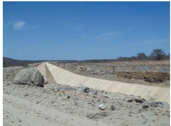
Fot. 4 - Canal da Transposição e campo de obras em Cabrobó (PE) (Fotografia de Assis, out. 2013).

com os instrumentos: [...] aqui, a forma que a gente vai trabalhar, pelo o que a gente pode entender [...], será de forma mais mecanizada, uma forma mais industrializada [...] (Entrevistado X). O morador da Vila concluiu: [...] Lá não tem mais como voltar. Lá só tem buraco, não tem mais como trabalhar. (Entrevistado X). Ele diz fica na expectativa de que as promessas feitas pelo Ministério da Integração se cumpram, pois o lugar que eles moravam foi completamente alterado pelas obras da transposição (fot. 4).