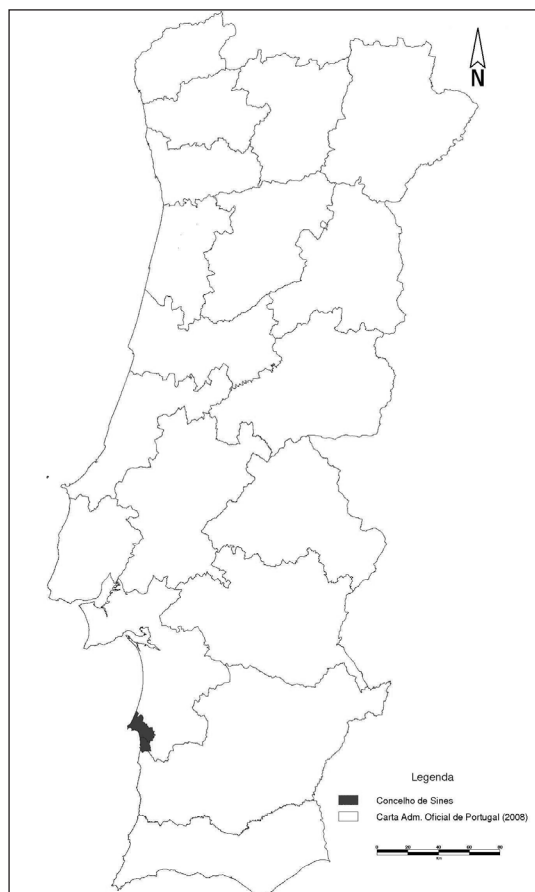
Figura 2 O Município de Sines representado no mapa de distritos

Numa outra perspetiva, há que evidenciar a sua localização entre o Oceano Atlântico e Espanha, entre a Área Metropolitana de Lisboa e o Algarve, uma posição privilegiada, nomeadamente no que toca às redes de infraestruturas e equipamentos. Há ainda que ponderar a ligação funcional portuária entre o Tejo, o Sado e Sines, complexo que poderá revelar-se de grande importância futura para a região. A sua localização geográfica e o seu posicionamento relativo têm-se constituído como factores de atração para inúmeros setores de atividade, conferindo a este Município um protagonismo crescente no contexto nacional e internacional.