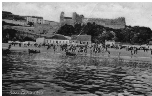
Figura 3 Banhos Quentes, Praia de Sines, 1940

Em suma, sobre este produto interessa salientar que esta unidade territorial tem a génese da sua atividade turística intimamente relacionada com os produtos de Turismo de Saúde e de Turismo de Bem-estar e que, embora no presente, seja inexistente, podem ser recuperados uma vez que a “matéria-prima” continua a ser uma constante, ainda que desaproveitada.