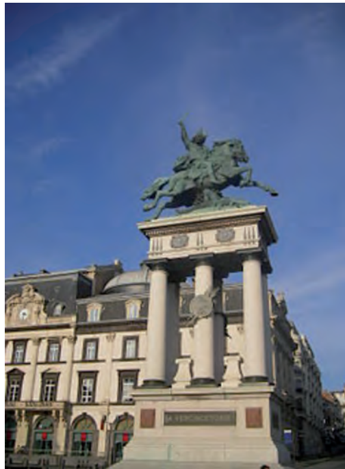
Statue de Vercingétorix par F.A. Bartholdi 1903 érigée sur la Place Jaude à Clermont Ferrand (France)