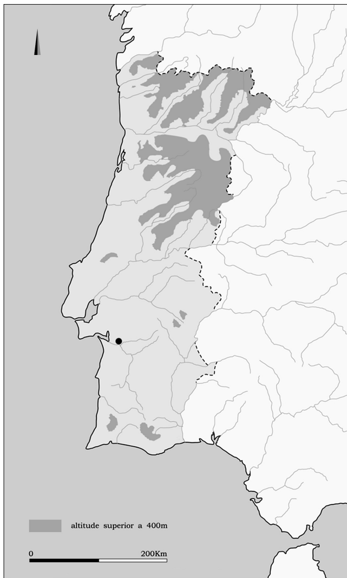
FIG. 1 – Localização da necrópole do Olival do Senhor dos Mártires no território actualmente português.