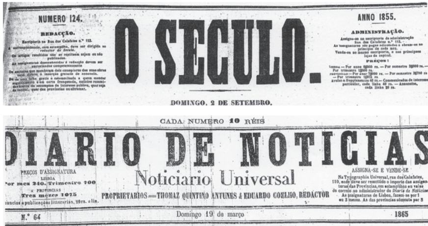
Figura I – Jornais consultados

e 1977; finalmente o Diário de Notícias , também de Lisboa, o mais antigo jornal diário ainda em circulação, fundado em 29 de dezembro de 1864 4 .