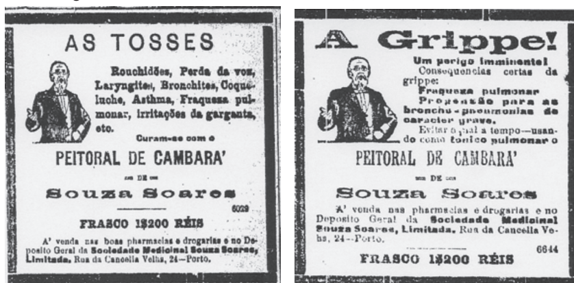
Figura IV – Anúncios, O Comércio do Porto , 31/08/1918 e 28/09/1918

Na sequência destas epidemias, Ricardo Jorge participou em conferências internacionais, como a da Comissão Sanitária dos Países Aliados, que se realizou em Paris em abril de 1918 37 e também no ano seguinte, em março, apresentou à mesma comissão um relatório sobre a gripe; em outubro de