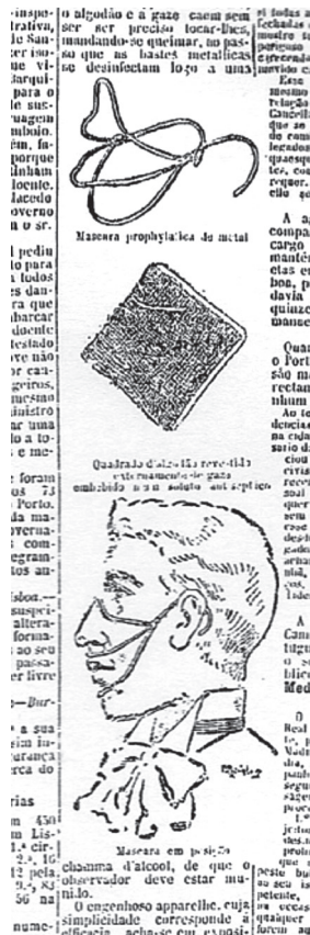
Figura III – Máscara facial profilática, Diário de Notícias , 24/08/1899