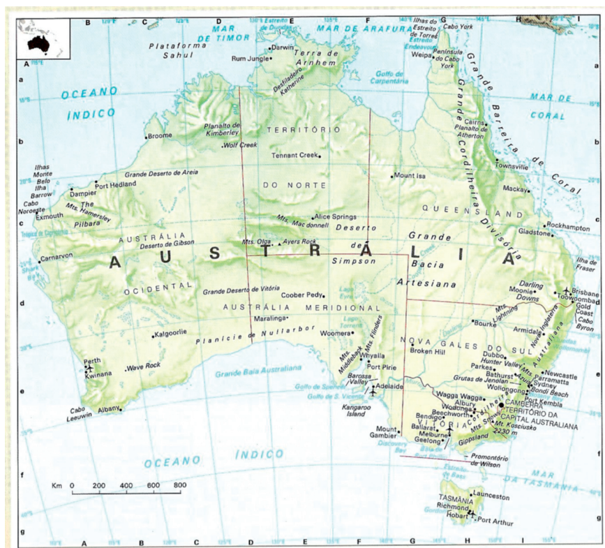
3: Mapa da Austrália.

exibidas em tons de verde, vermelho, azul e dourado, com os topónimos meticulosamente inscritos nas cores alternadas de azul-escuro e vermelho-escuro. Os oceanos são embelezados com desenhos de rosas-dos-ventos elegantes, monstros marinhos e navios a todo o pano. Ilustrações sumptuosas e multicoloridas das cortes de potentados e outras cenas fabulosas dão vida ao interior dos continentes» 33 . Ao lermos estas palavras, ficamos sem quaisquer dúvidas acerca da influência portuguesa destes mapas e somos até levados a questionar se não terá mesmo havido mão de cartógrafo português na sua feitura ou na sua coordenação.