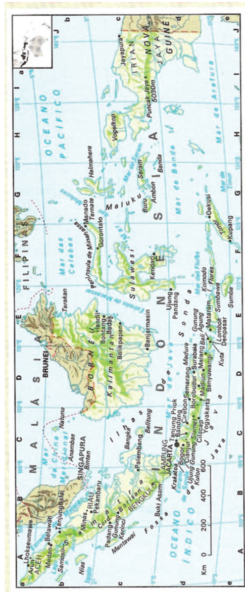
I : Mapa da Indonésia.

Oriental , de Tomé Pires, o qual será publicado conjuntamente com esta obra, em 1978, sob o título de Livro de Francisco Rodrigues 5 .