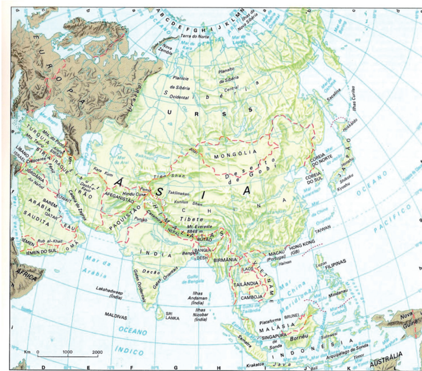
2: Mapa da Ásia, Indonésia e Norte de Austrália.

na região da actual Terra de Dampier. Aí, esclarece o cronista João de Barros, Diogo Pacheco, «porque o vento lhe era contrairo, e viu que a gente da terra a grã pressa se metia em lancharas pera vir também contra êle, meteu-se no bargantim, querendo tirar à toa o navio ao mar largo polo não tomarem; e foi o tempo tanto, que o mar comeu o bargantim, e o navio veu à costa, do qual escaparam alguns malaios, homens do mar, casados em Malaca, que se meteram pelo sertão da ilha atravessando-a tôda, e vieram ter da outra banda do Norte, onde acharam embarcação que os levou a Malaca, os quais contaram esta perdição de Diogo Pacheco, que foi o primeiro dos nossos que perdeu a vida por descobrir esta Ilha do Ouro» 25 .