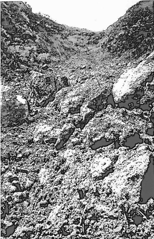
Fot. 2 - Corredor originado pelo movimento de detritos acima da estrada.

Quando lá cheguei na primeira semana de Maio, dizia-se que a origem deste desabamento estava nos ventos fortes que se haviam sentido naquele dia. Os jornais açoreanos falavam dos ventos, mas só a propósito dos prejuízos que tinham causado à agricultura