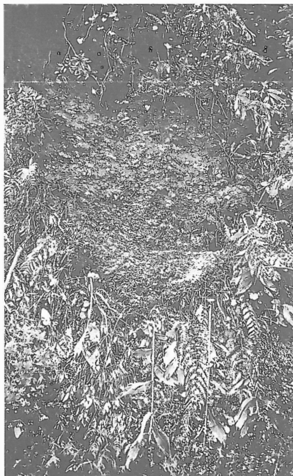
Fot. 5 - Película de vegetação destacada, em forma de língua, em parede vertical (proximidades da área do corte de estrada).

Outros casos poderão acontecer, semelhantes a tantos que conhecemos nas nossas estradas, mas que,