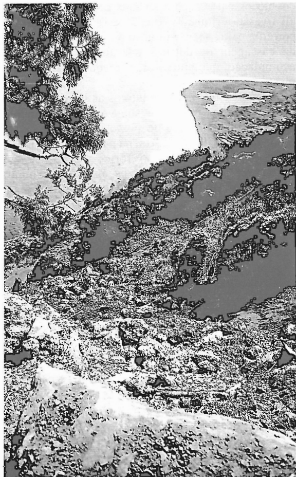
Fot. 4 - Continuação do corredor para baixo da estrada.

Nada se pode provar quanto à possibilidade de um vento forte a cotas próximas dos 800 metros ter exercido pressão sobre árvores que por sua vez tenham criado a desestabilização dos solos apenas humedecidos ou mesmo saturados de água de modo a desencadear o desabamento. Aliás, no local em causa, as árvores são poucas e continuavam intactas. Nem parece que algumas tenham desaparecido envolvidas em qualquer movimento de vertente. A subverticalidade do declive, a presença da água nos solos e a acção das raízes de uma vegetação abundante,