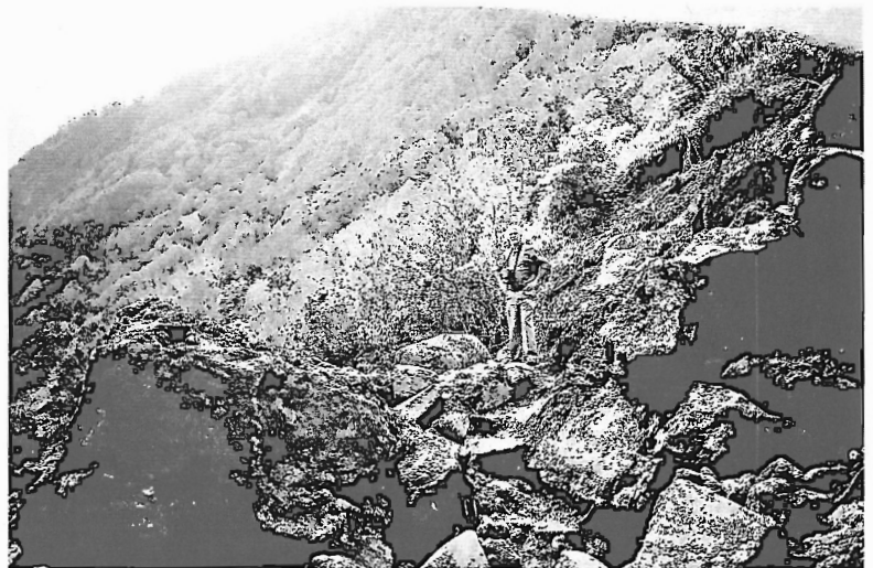
Fot. 3 - Disposição dos blocos principais abandonados sobre a estrada.

A análise dos dados relativos às velocidades do vento em São Jorge, por sua vez, foi totalmente infrutífera; não houve no posto meteorológico de Manadas (área do aeroporto, na parte da ilha voltada a sudoeste) registo de ventos fortes que explicassem os tão referenciados prejuízos agrícolas e muito menos o desencadear de qualquer processo de