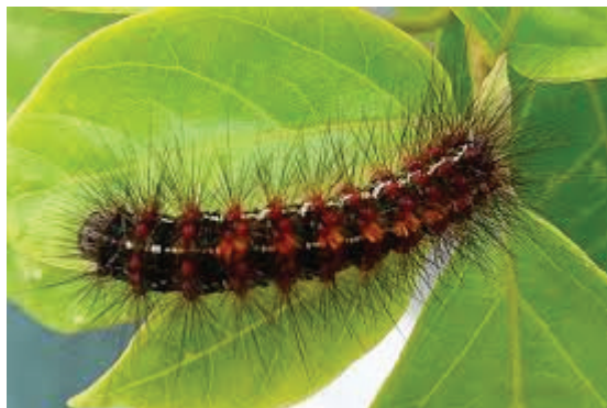
Figura 1: Tatarana ou Taturana

equaciona no tecido do lembrado vertido em discurso: “Quero é armar o ponto dum fato, para depois lhe pedir um conselho.” (GSV, p. 232). Riobaldo quer saber de Riobaldo, quer compreender como pode uma Tatarana, a custa de uma longa metamorfose, converter-se num Urutu Branco.