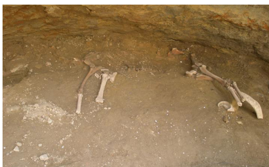
Figura 1- Esqueleto casi completo de un asno en el yacimiento arqueológico islámico "C/ Dos aceras 42-48" en Málaga.