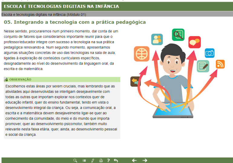
FIGURA 2: Objeto de Aprendizagem – Curso Escola e Tecnologias Digitais na Infância