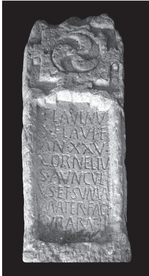
FIG. 1 – La stèle de Cabeça Boa.