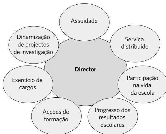
Figura 1 - Avaliação pelo Director

Ao Avaliador da direcção executiva competem as seguintes tarefas: (1) acertar com o Avaliado os objectivos individuais, tendo em conta a consecução dos objectivos e metas fixados pela escola; (2) avaliar, de forma a garantir o cumprimento do calendário da avaliação de desempenho; (3) realizar as entrevistas de apreciação do desempenho e acompanhar o Avaliado ao nível da realização dos seus objectivos. É, pois, o Avaliador da direcção executiva que assegura a avaliação dos parâmetros classificativos inscritos nas fichas de avaliação (Figura 1).