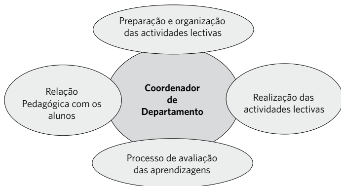
Figura 2 - Avaliação pelo Coordenador do Conselho de Docentes ou do Departamento Curricular

O Inspector com formação científica na área do departamento do Avaliado avalia em conjunto com o Director, as funções exercidas pelo Coordenador do Departamento Curricular.