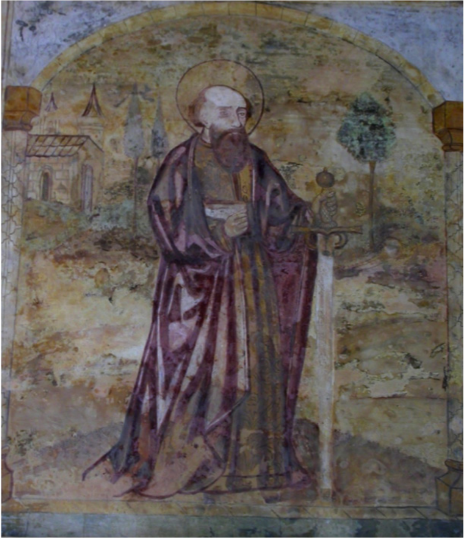
Fig. 6. S. Paulo. Pintura mural do Claustro do Mosteiro da Batalha, realizada entre c.1520 e c.1540.