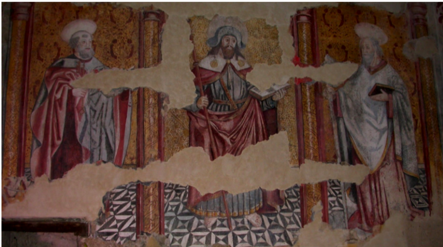
Fig. 4. Pintura mural da capela-mor da igreja de S. Tiago de Folhadela (concelho de Vila Real). A pintura representa S. Pedro e S. Paulo flanqueando o orago desta igreja, com S. Pedro à direita do orago e S. Paulo à esquerda. Pinturas realizadas por volta de 1520-30.