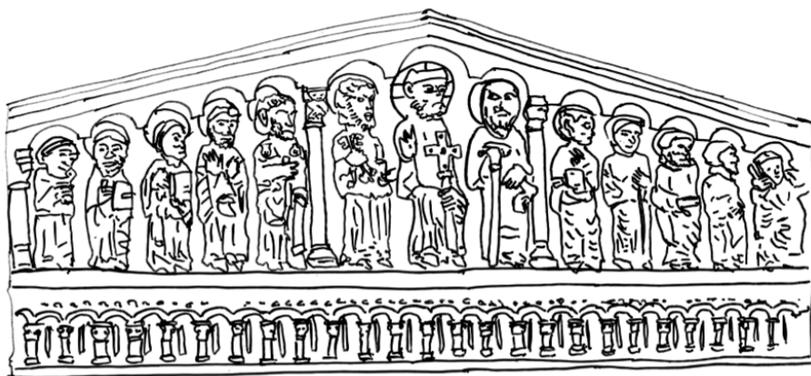
Fig. 2. Retábulo-mor da igreja do mosteiro de Santo Estêvão de Ribas de Sil, inícios do século XIII. Desenho: Luís U. Afonso.