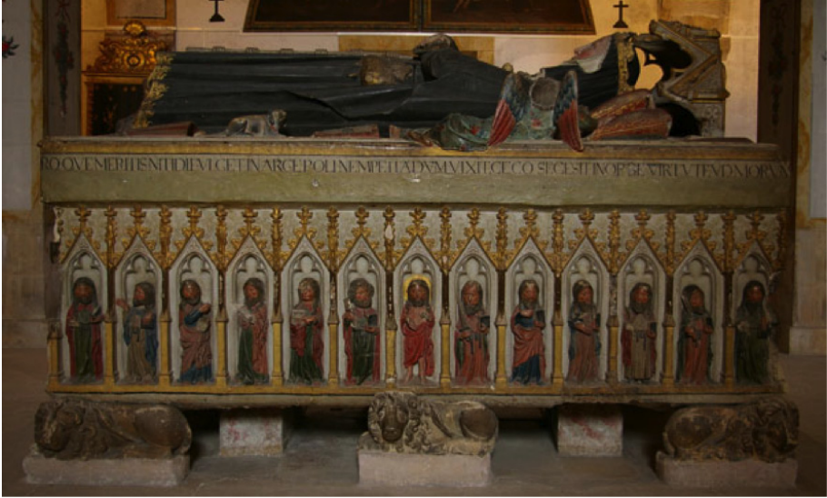
Fig. 3. Túmulo da rainha Santa Isabel. Mosteiro de Santa Clara-a-Nova, c.1330. Na imagem atente-se à representação dos Apóstolos no frontal da arca, com Cristo a ser ladeado por S. Pedro e S. Paulo, respectivamente à direita e à esquerda de Cristo.