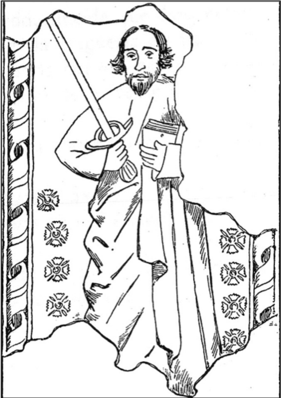
Fig. 5. S. Paulo, representado na parede norte da capela-mor da igreja paroquial de Valadares (Baião, Porto). Pintura realizada no último quartel do século XV. Desenho realizado por João Amaral em 1923 e publicado por Vergílio Correia em 1924 na obra Monumentos e Esculturas (Séculos III a XVI) .