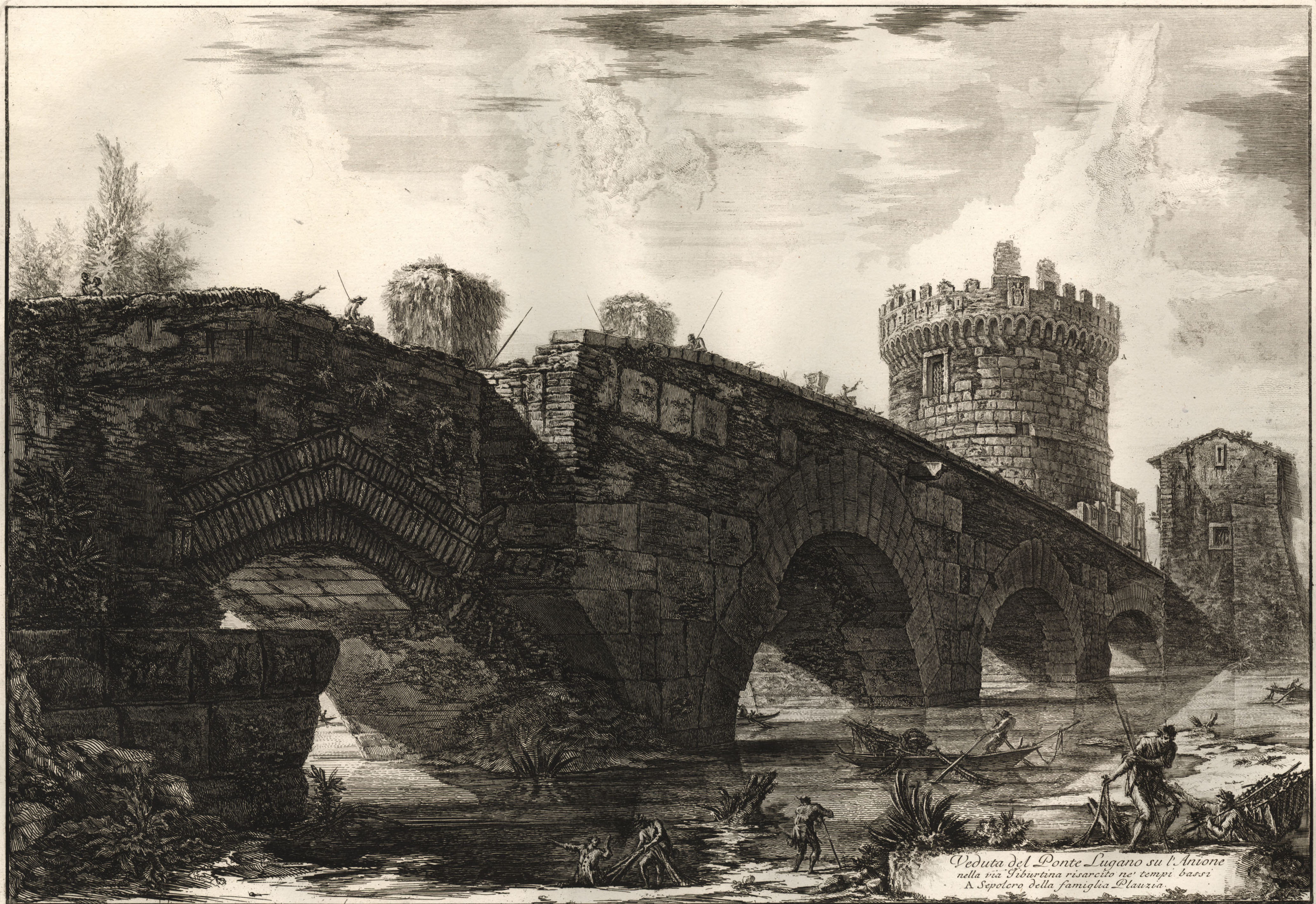
Veduta del Ponte Lugano su l'Aniene nella via Tiburtina risarcito ne' tempi bassi A Sepolcro della famiglia Plauria.