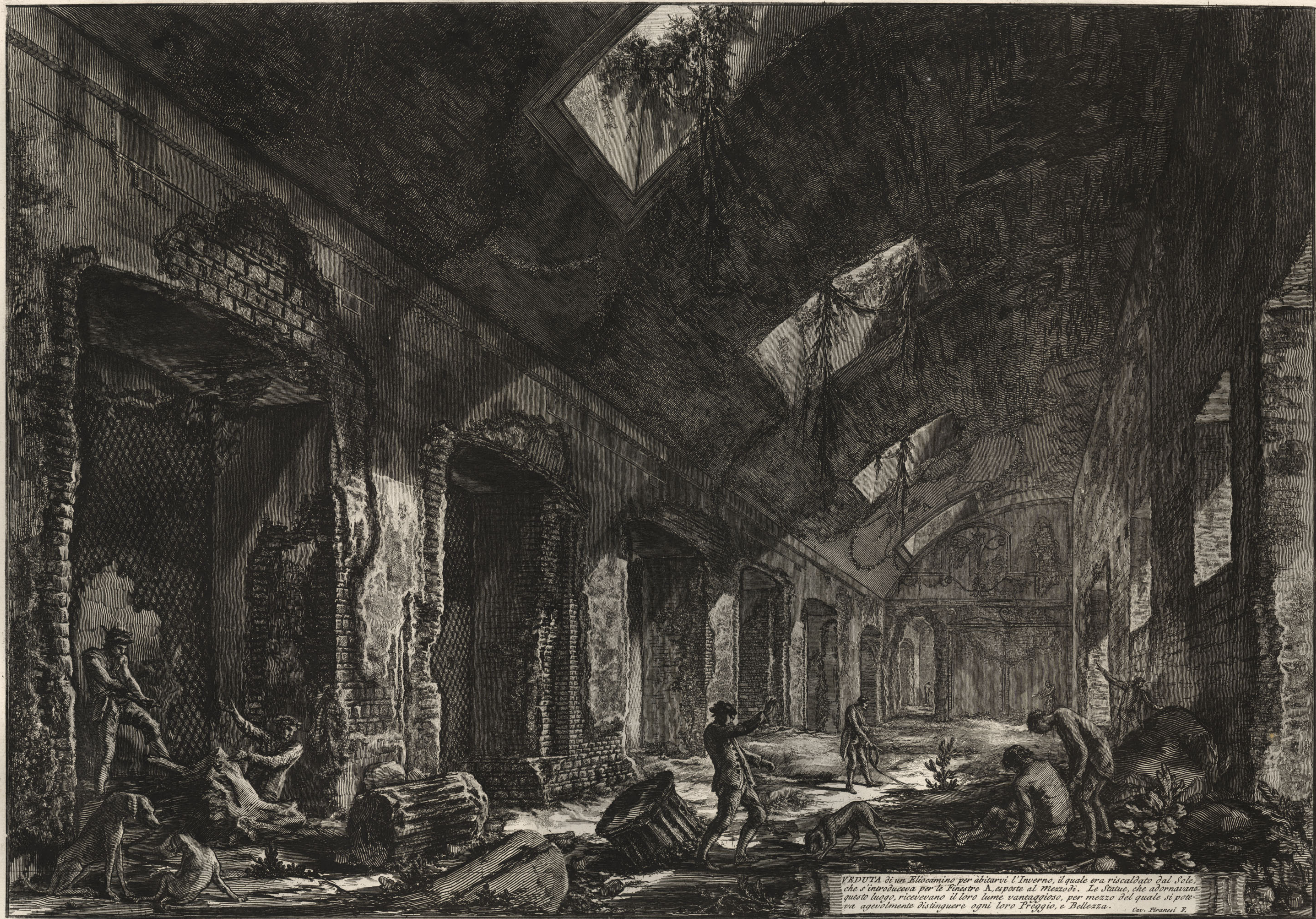
VEDUTA di un Ellucamino per abitarvi l'Inverno, il quale era riscaldato dal Sole, che s'introduceva per la Finestra A. aperte al Mezzodi. Le Statue, che adornavano questo luogo, ricevevano il loro lume vantaggioso, per mezzo del quale si poteva agevolmente distinguere ogni loro Preggio, e Bellezza. Cav. Piranesi F.