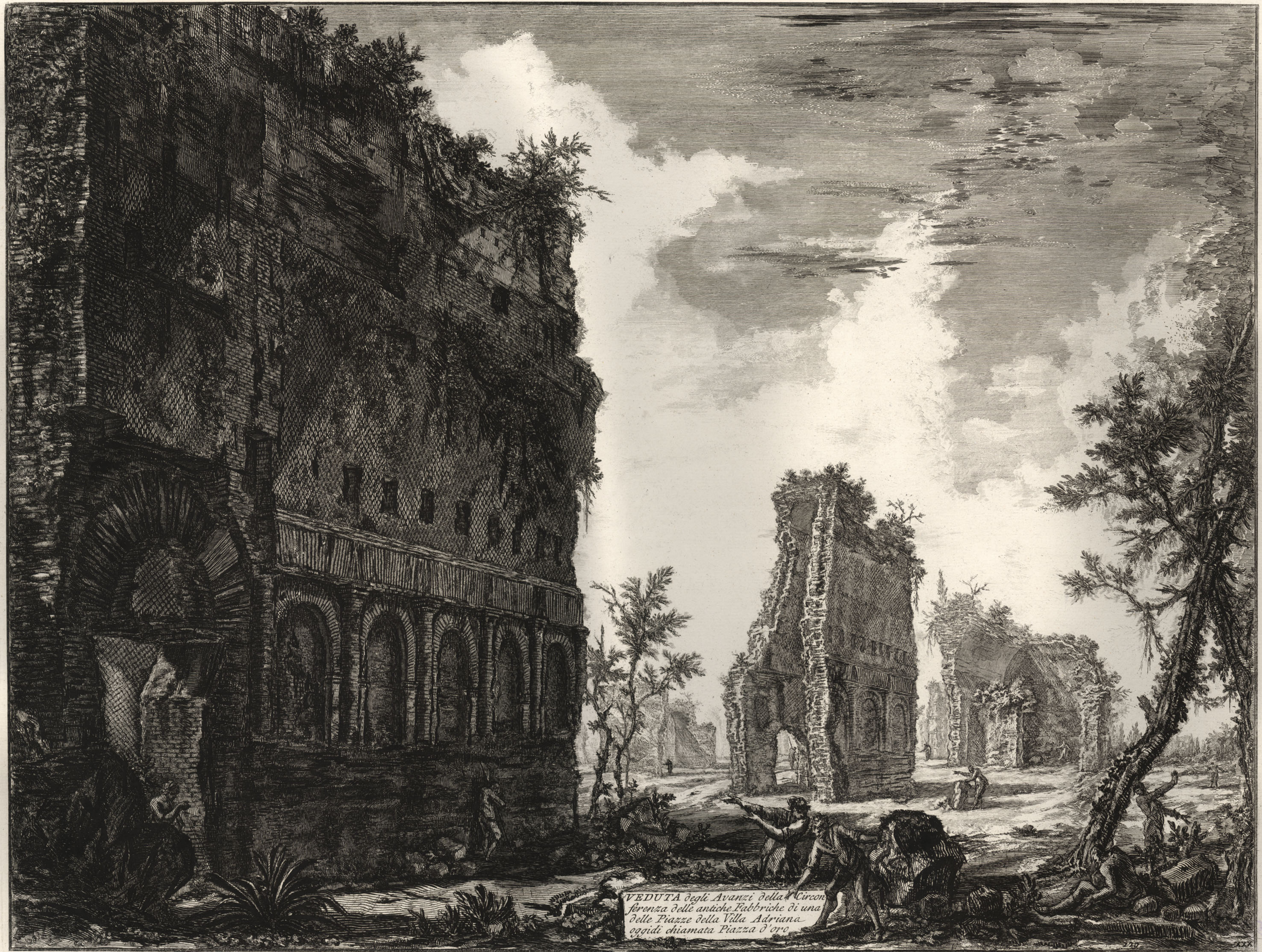
VEDUTA degli Avanzi della Circonferenza delle antiche Fabbriche di una delle Piazze della Villa Adriana, oggi chiamata Piazza d'oro.