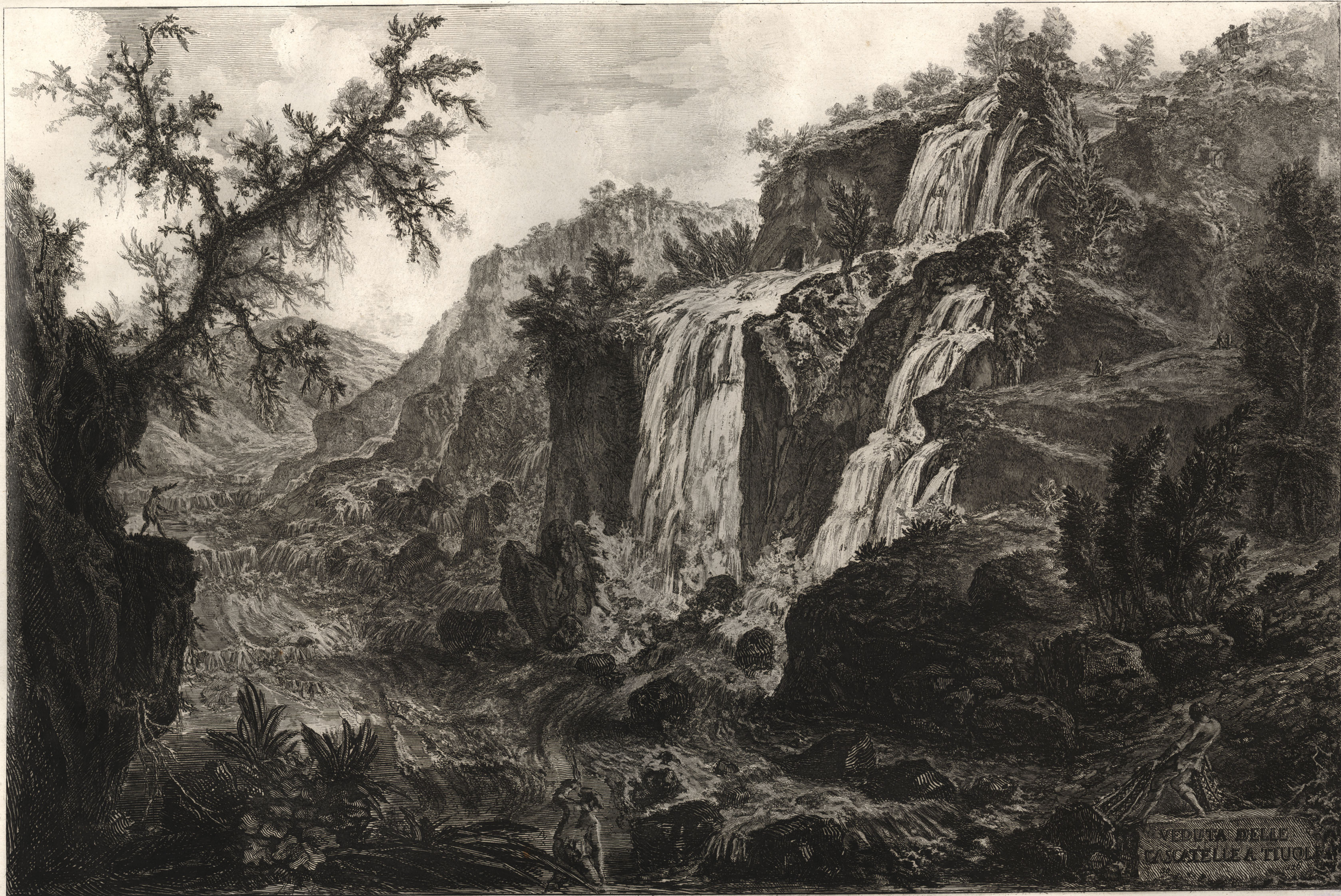
Cavalier Piranesi del. e inc.