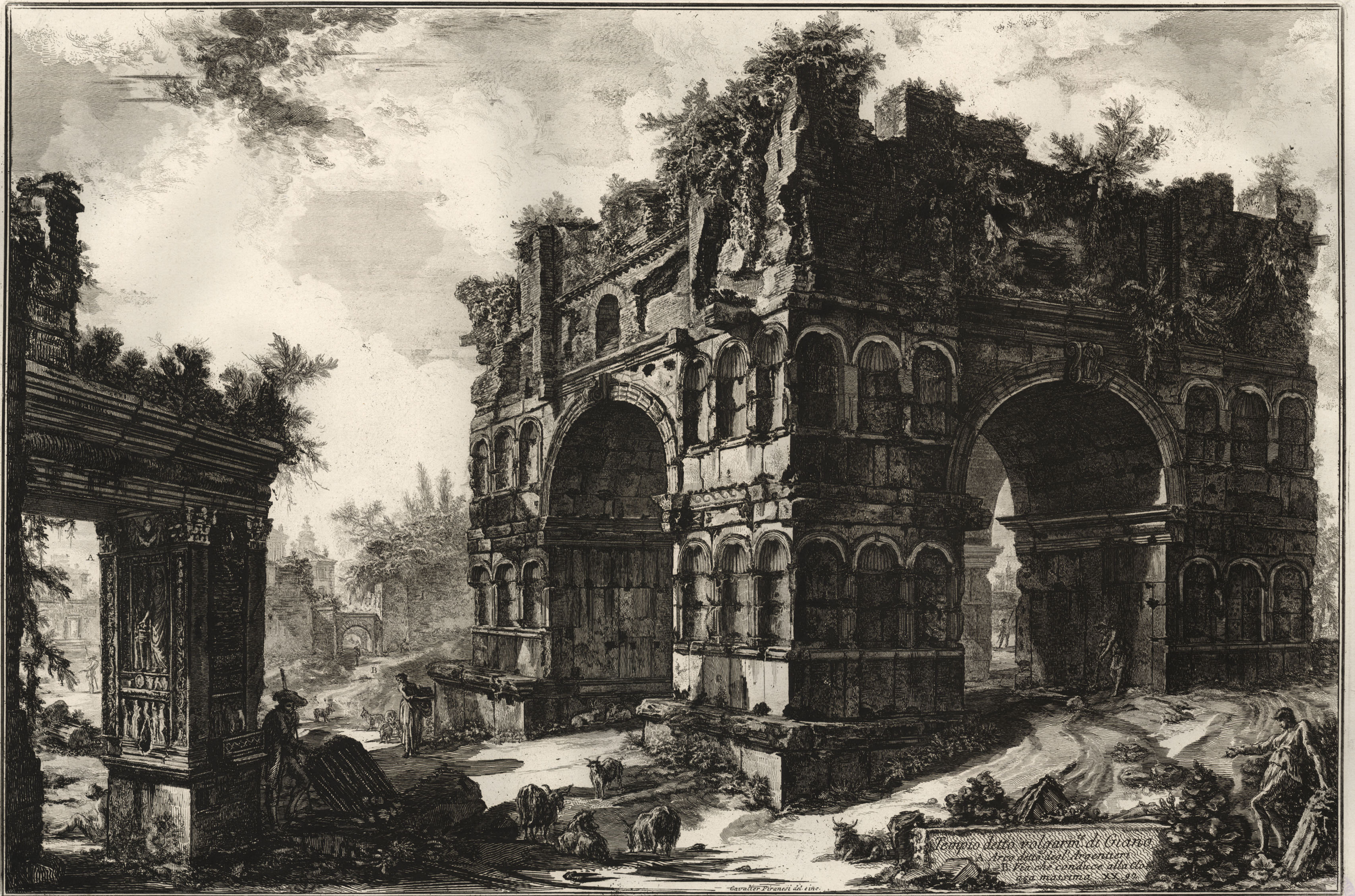
Tempio detto volturni di Capua Arco detto degli Argentieri B. Fiori condice alla clo- aca massima. 1792.