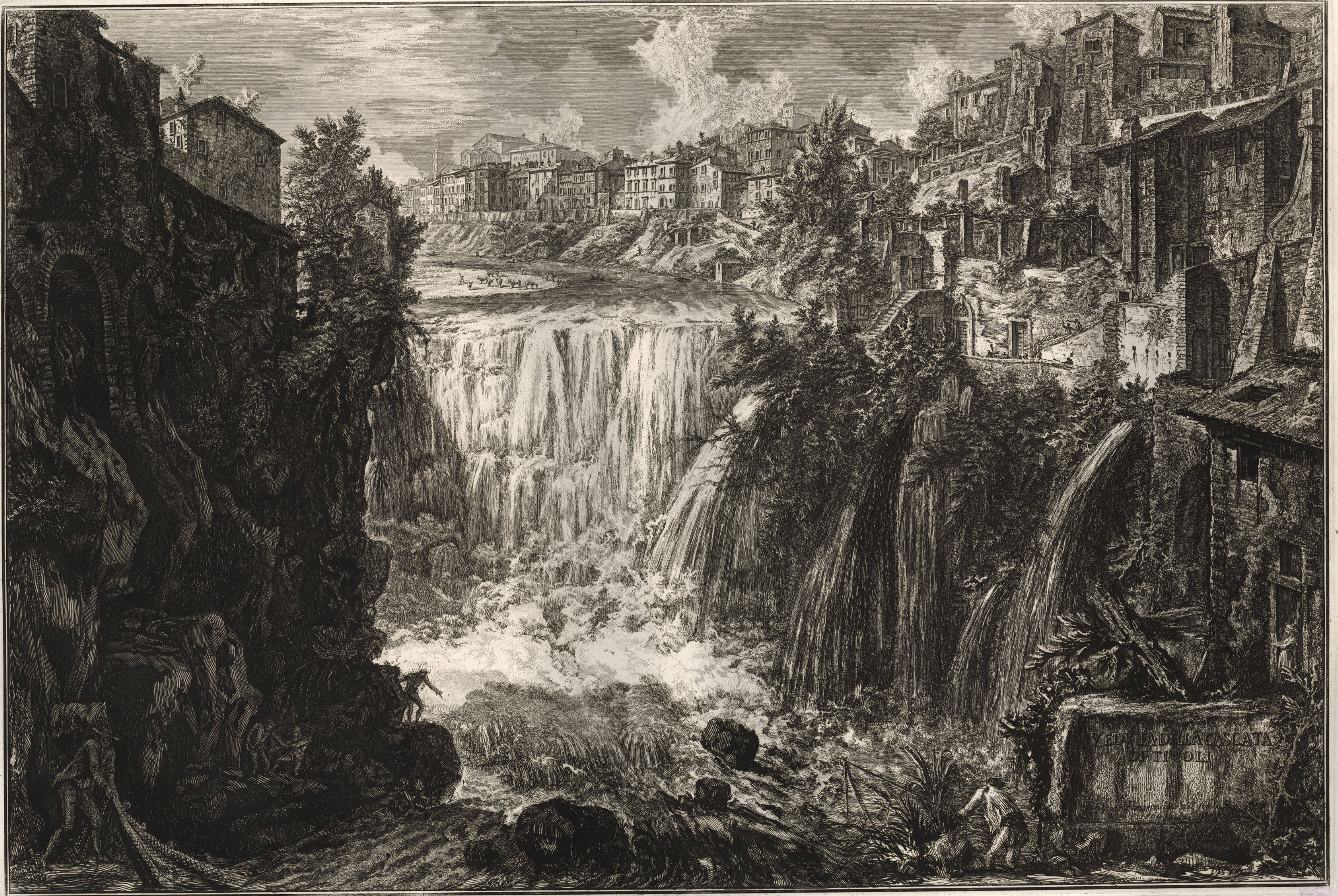
VED. AD. LA CASCATA DI TIVOLI