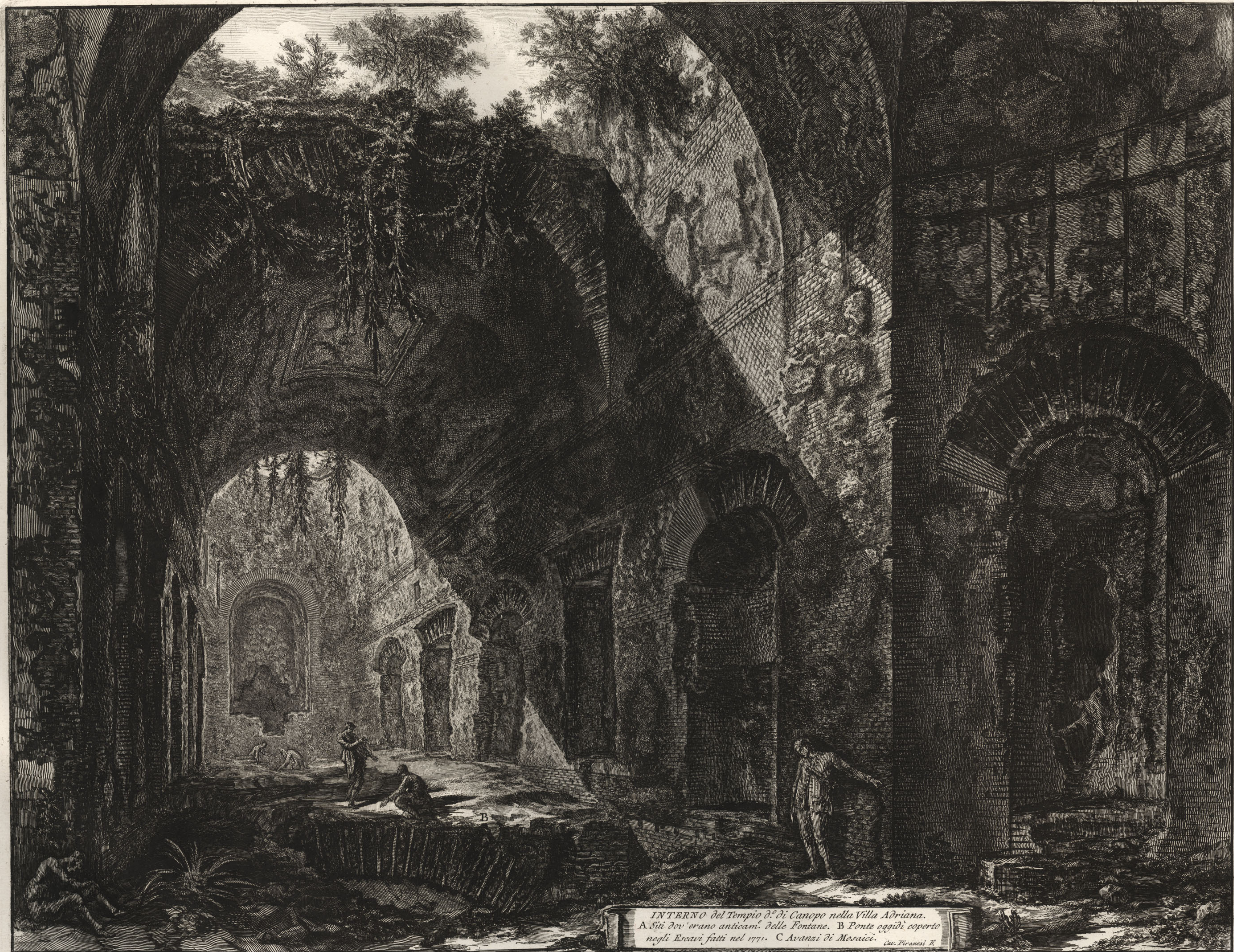
INTERNO del Tempio di Campo nella Villa Adriana. A Siti dov'erano anticami. delle Fontane. B Ponte oggi di coperto negli Escavi fatti nel 1771. C Avanzi di Mosaici. Cav. Piranesi R.