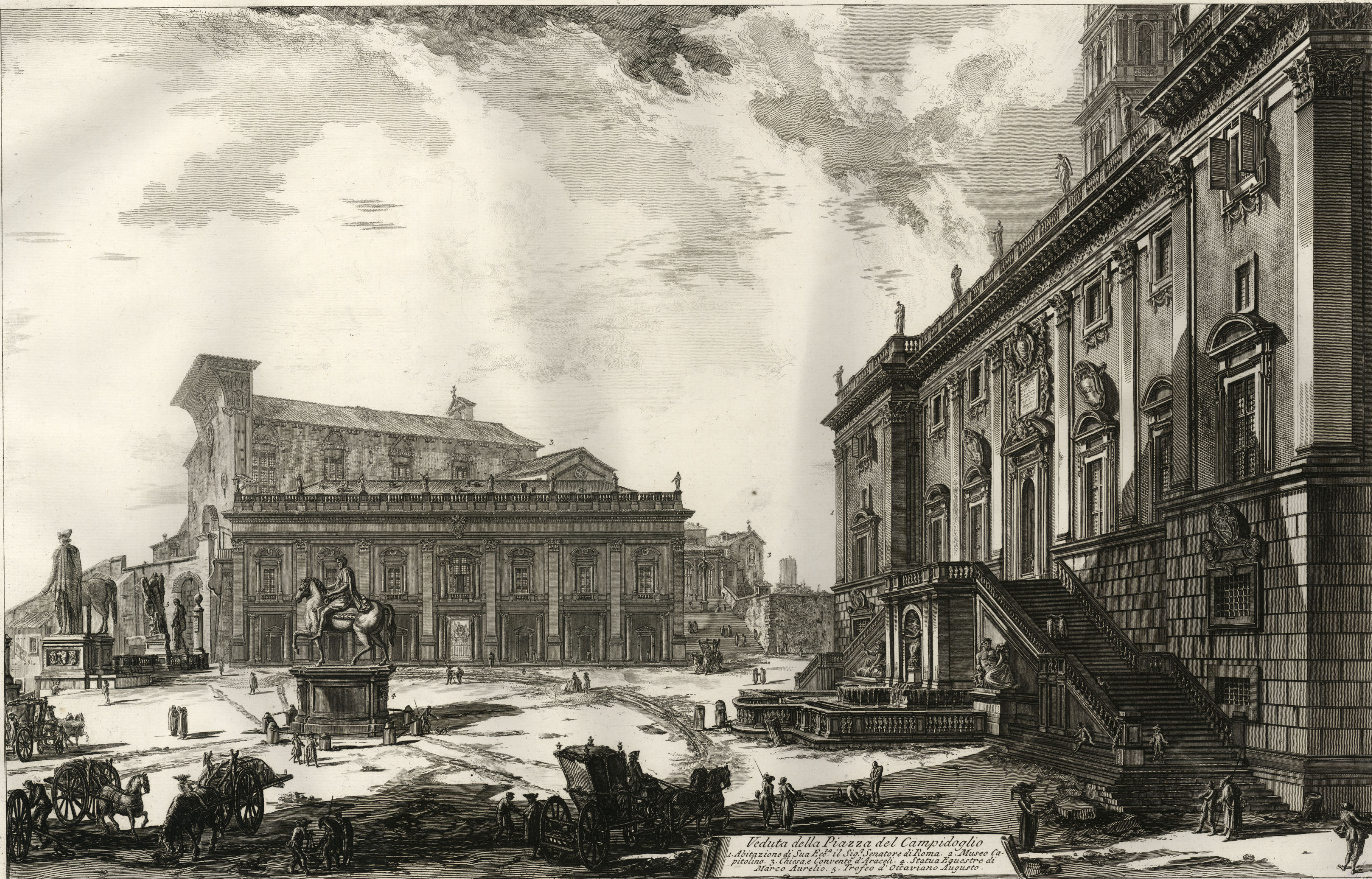
Veduta della Piazza del Campidoglio 1. Abitazione di Sua Ecc. il Sig. Senatore di Roma. 2. Museo Capitolino. 3. Chiesa e Convento d'Araceli. 4. Statua equestre di Marco Aurelio. 5. Trofeo d'Otaviano Augusto.