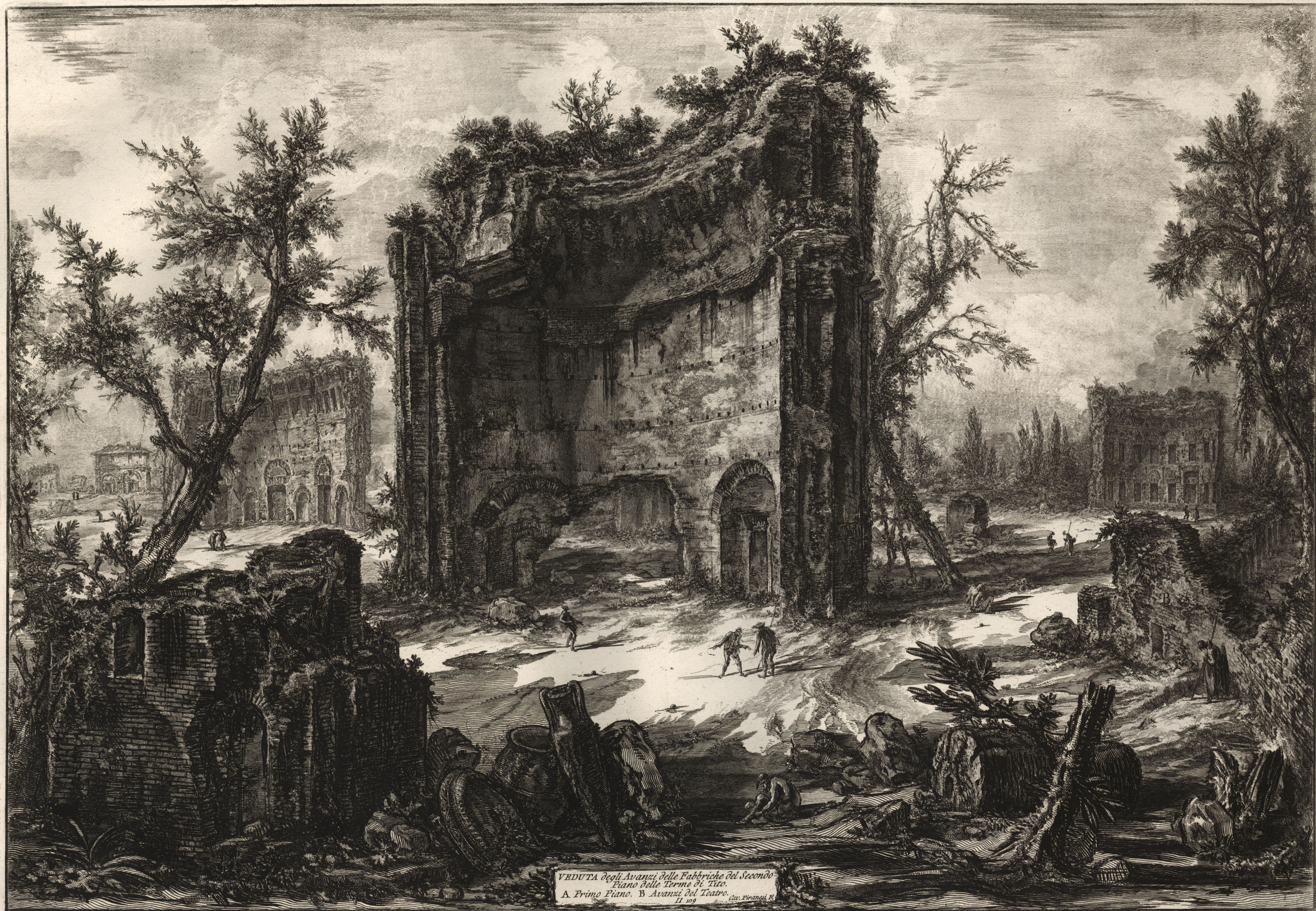
VEDUTA degli Avanzi delle Fabbriche del Secondo Piano delle Terme di Tito. A. Primo Piano. B. Avanzi del Teatro. 11 109. del. Piranesi R.