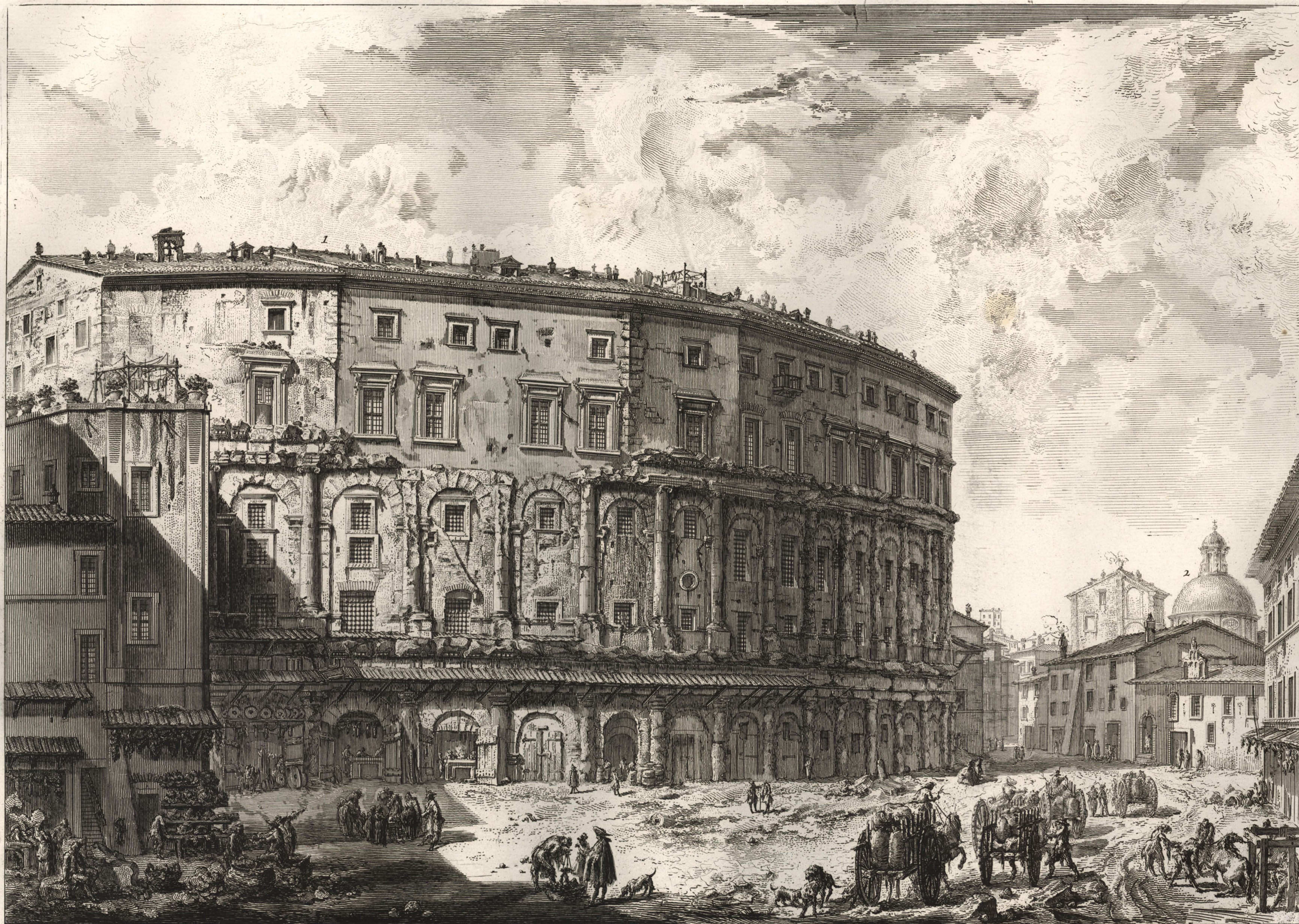
Questo fu fabricato da Augusto, e dedicato a Marcello suo nipote. 1. Palazzo Orsini restaurato da Baldassare da Siena Architetto.