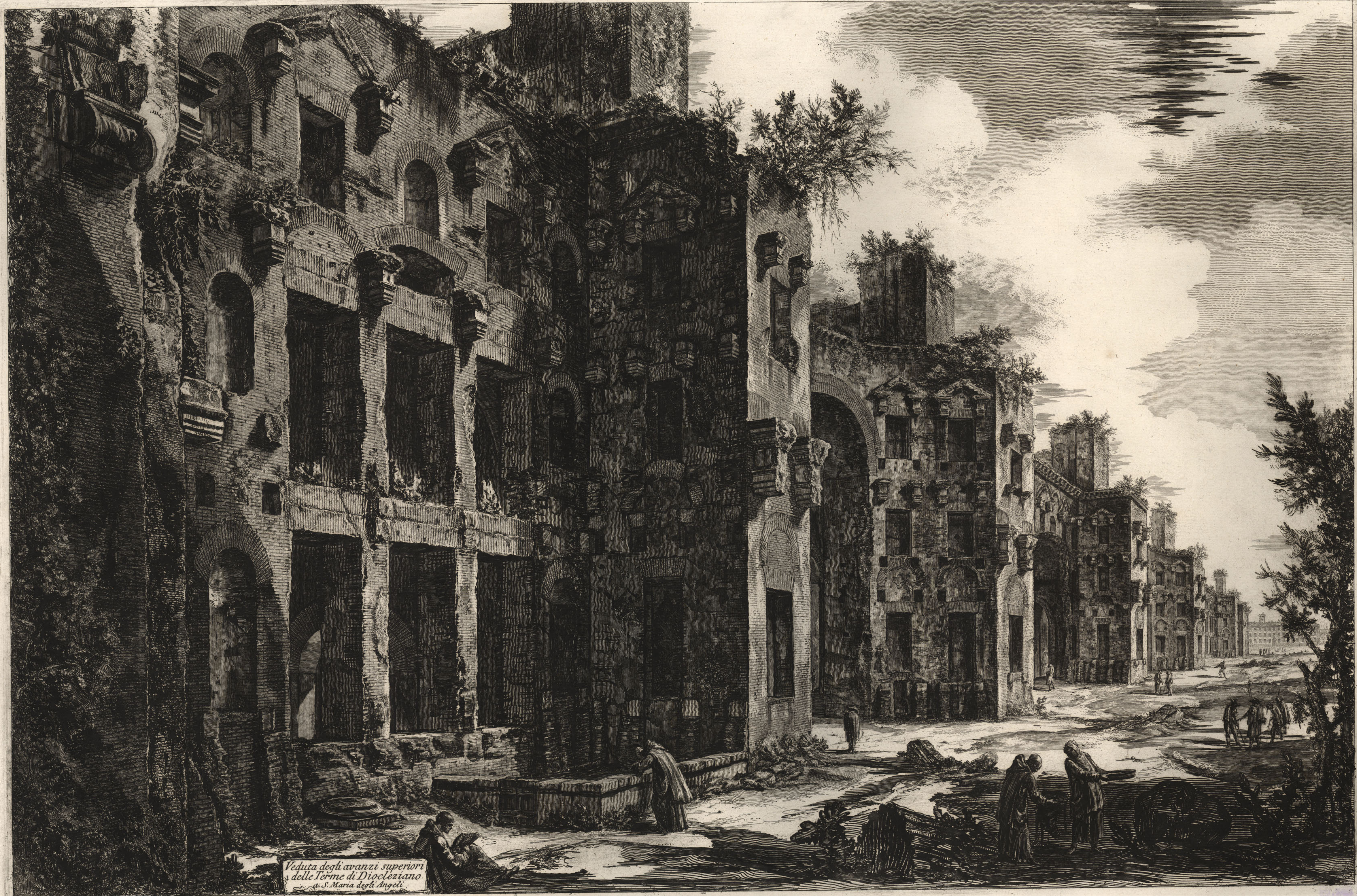
Veduta degli avanzi superiori delle Terme di Diocleziano a S. Maria degli Angeli.