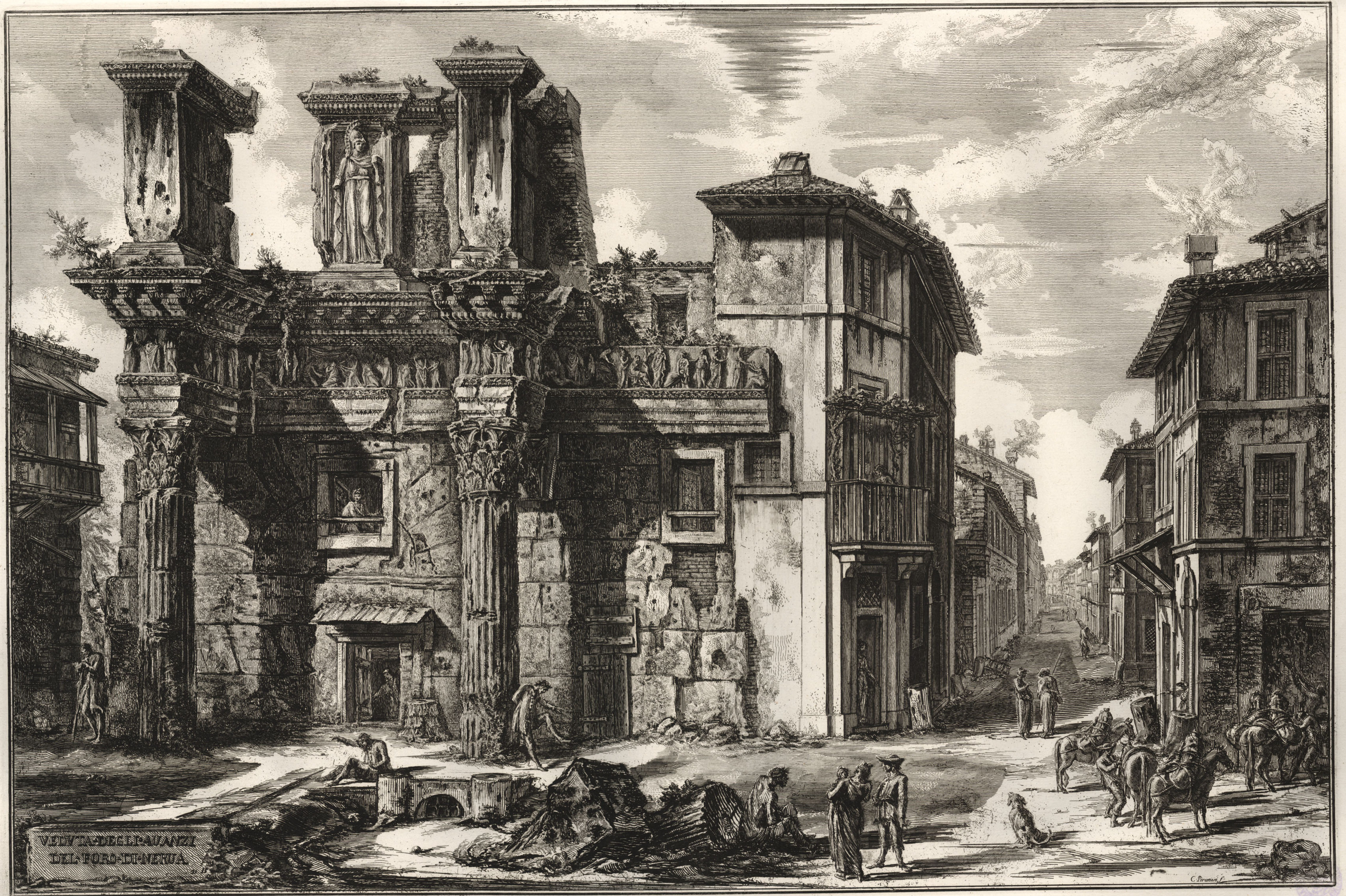
VEDUTA DE' RESTI DEL FORO DI NERVA.