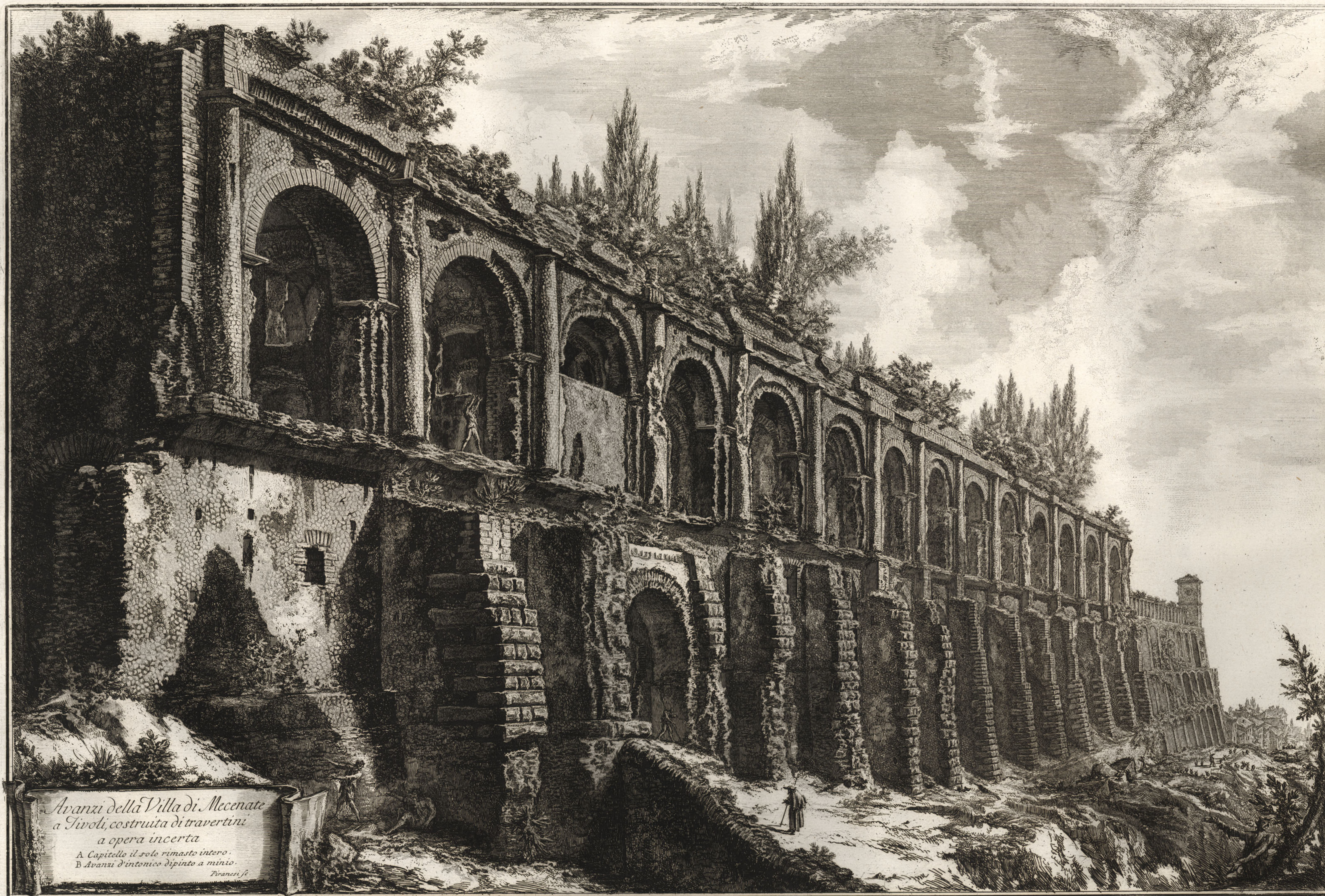
Avanzi della Villa di Mecenate a Tivoli, costruita di travertini a opera incerta A Capitello il solo rimasto intero. B Avanzi d'intonaco dipinto a minio. Piranesi sc.