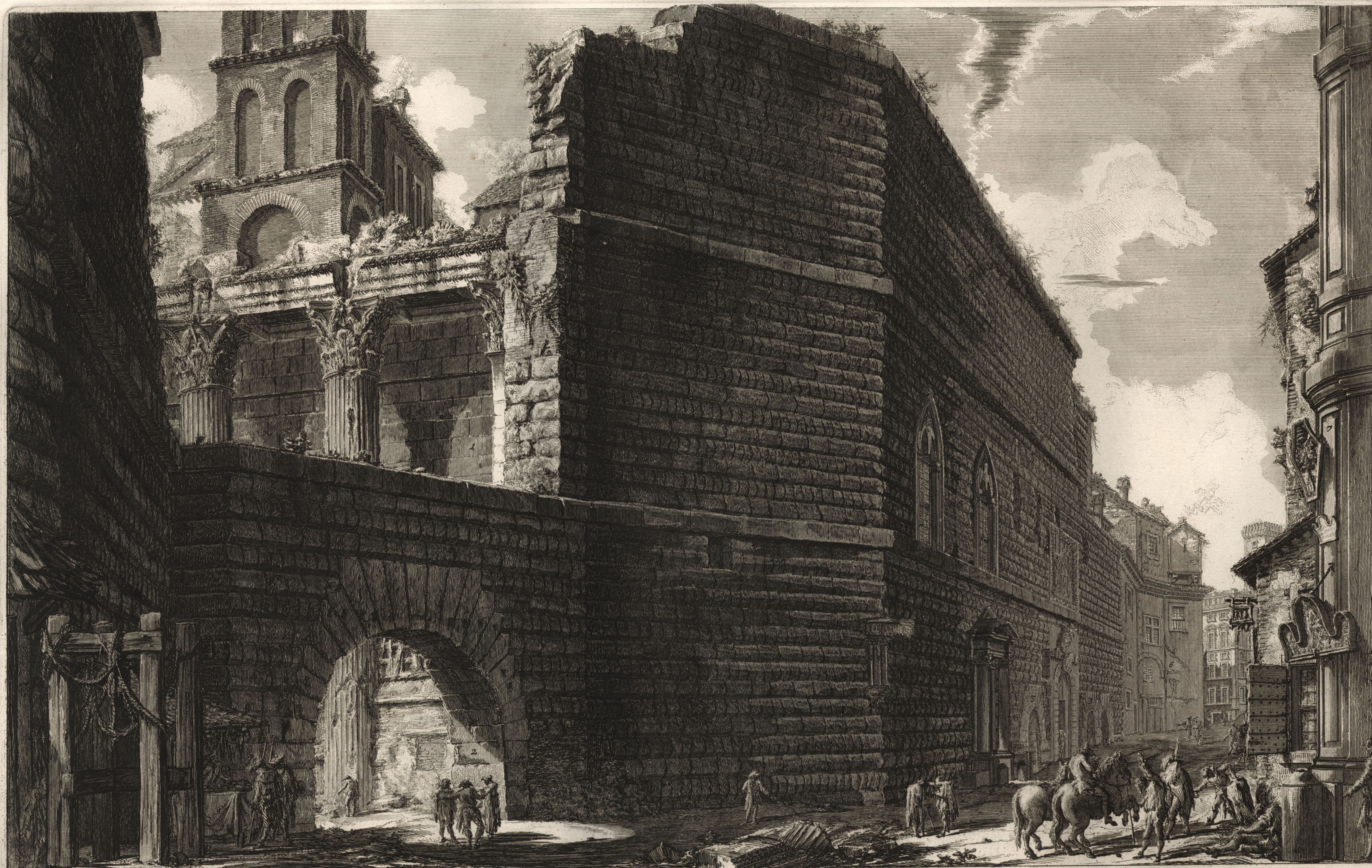
1. Avanzo della Curia del Foro, occupata in oggi dalla Chiesa, e dal Monastero delle Religiose dell'Annunziata. 2. Uno degli Archi principali, che davano l'ingresso nel Foro, detto in oggi l'Arco de' Pantani. 3. Archi inferiori che parimente davano l'ingresso nel Foro. 4. Porta della predetta Chiesa, aperta nell'antico