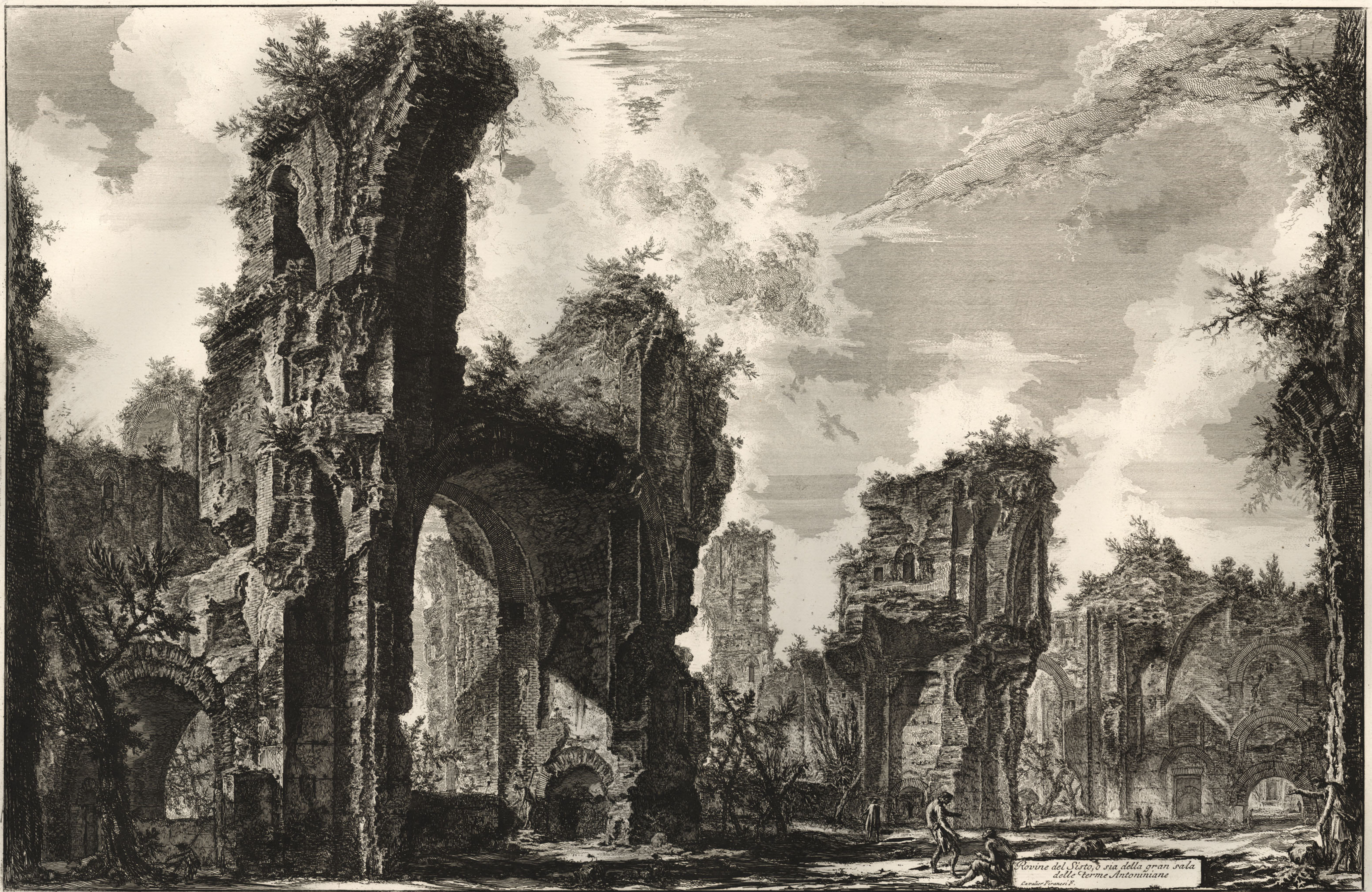
Rovine del Sisto, o sia della gran sala delle Terme Antoniniane Cavallo Franchi F.