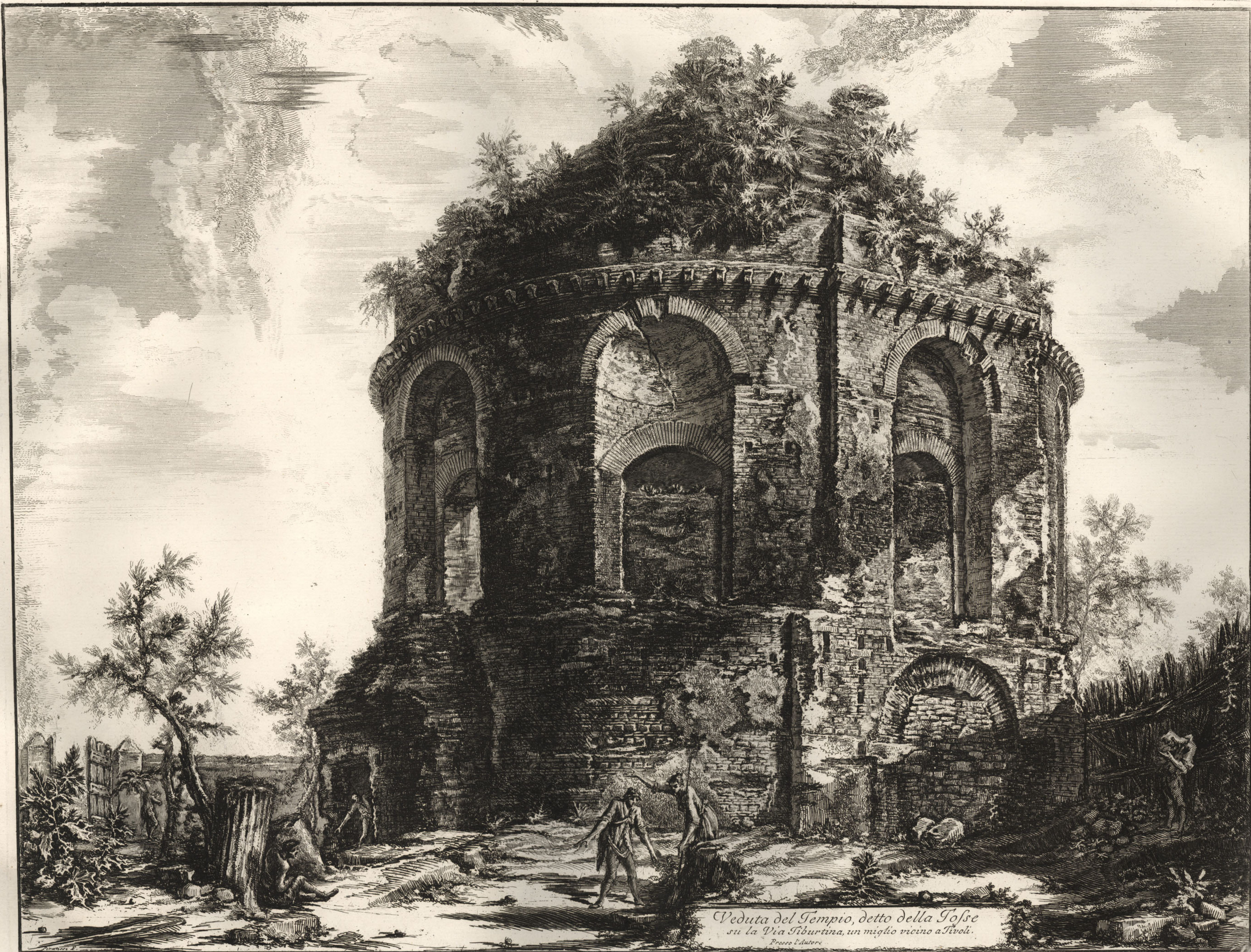
Veduta del Tempio, detto della Fosse su la Via Tiburtina, un miglio vicino a Tivoli.