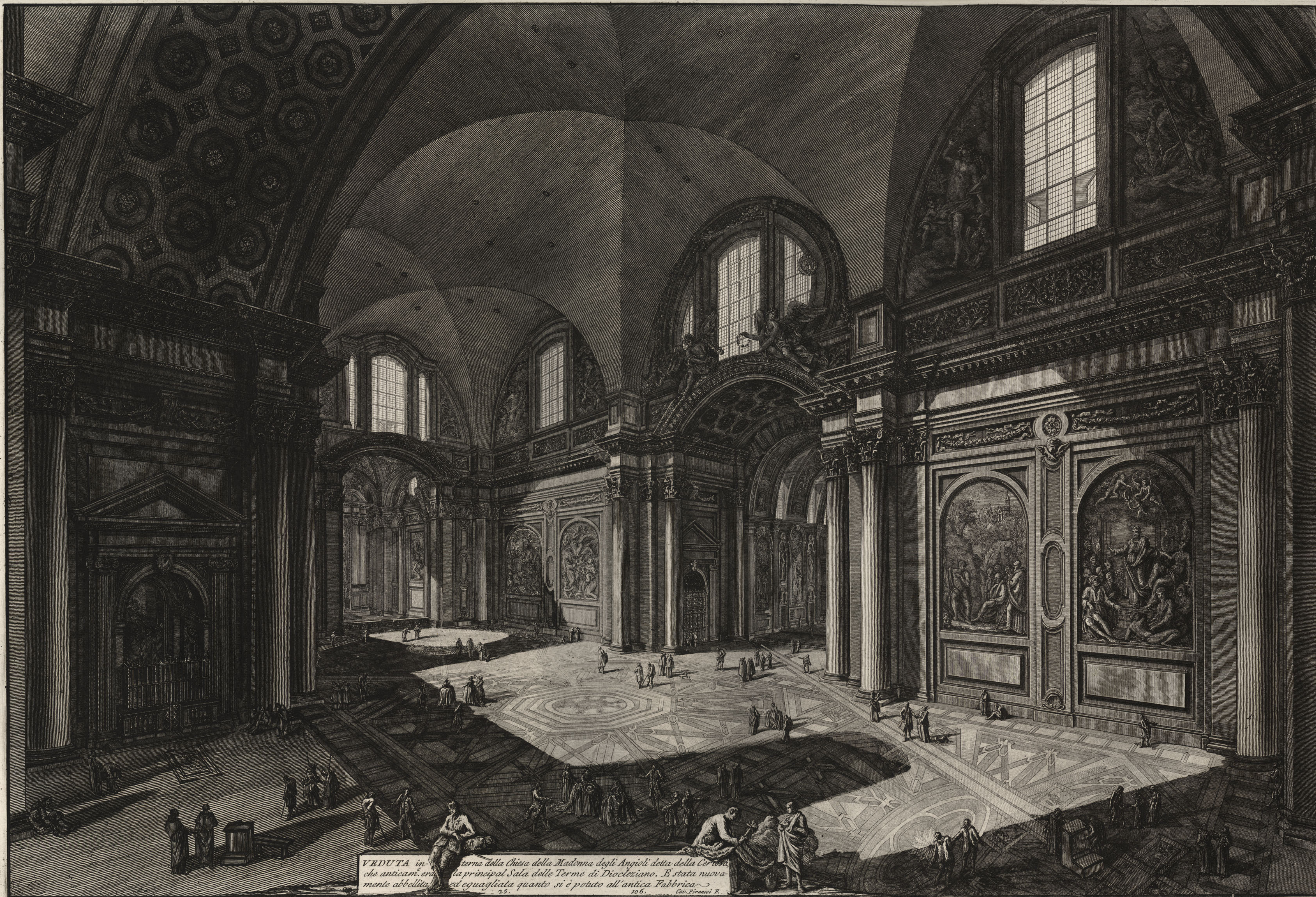
VEDUTA in- che anticam, era mento abbellita. terna della Chiesa della Madonna degli Angioli detta della Corvisa. la principal Sala delle Terme di Diocleziano. E stata nuova- ed eguagliata quanto si è potuto all'antica Fabbrica. 25. 106. Clav. Piranesi F.