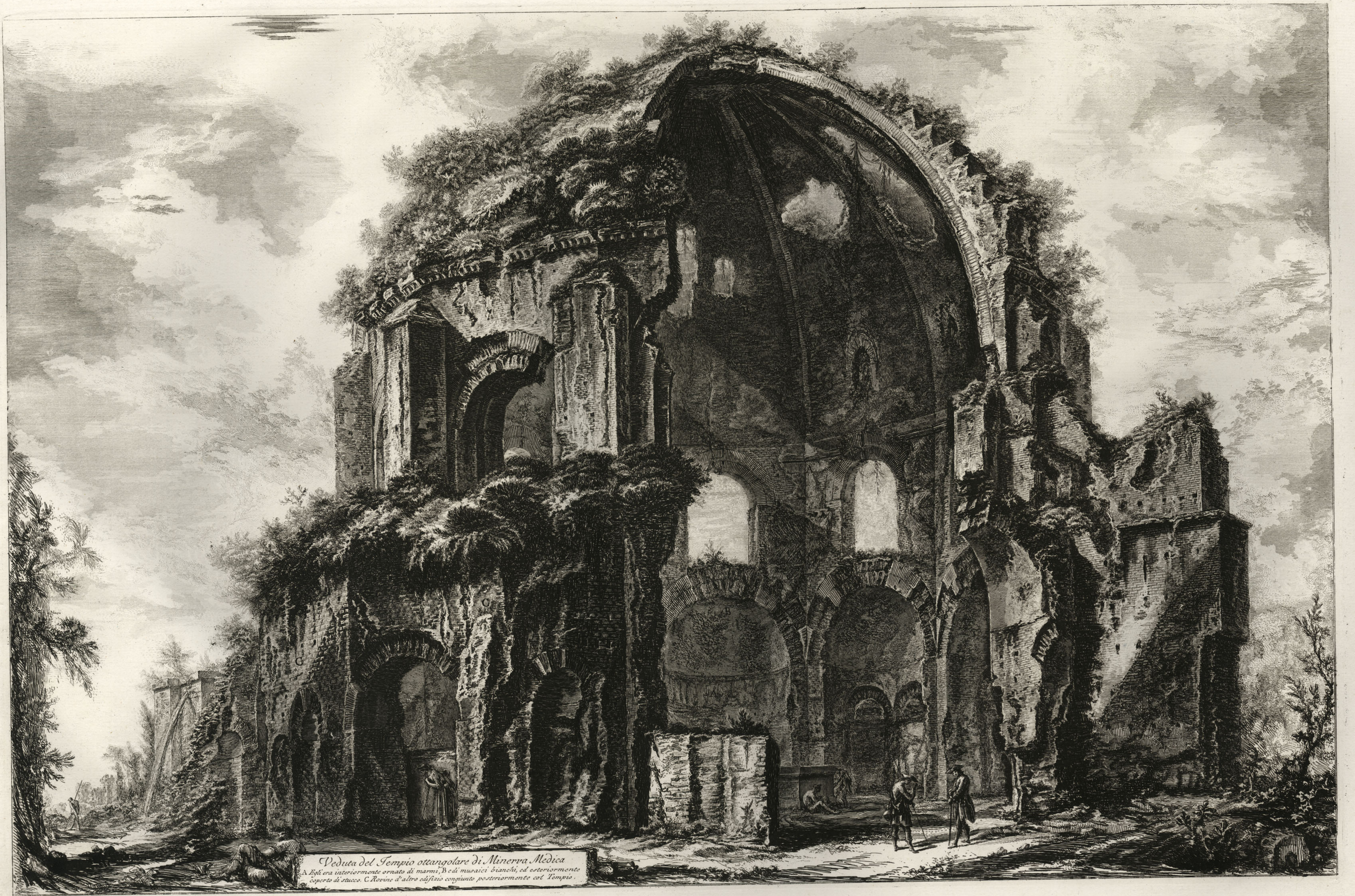
Veduta del Tempio ottangolare di Minerva Medica A. Egl'era interiormente ornato di marmi, B. e di mosaici bianchi, ed esteriormente coperto di stucco. C. Rovine d'altro edificio congiunto posteriormente col Tempio.