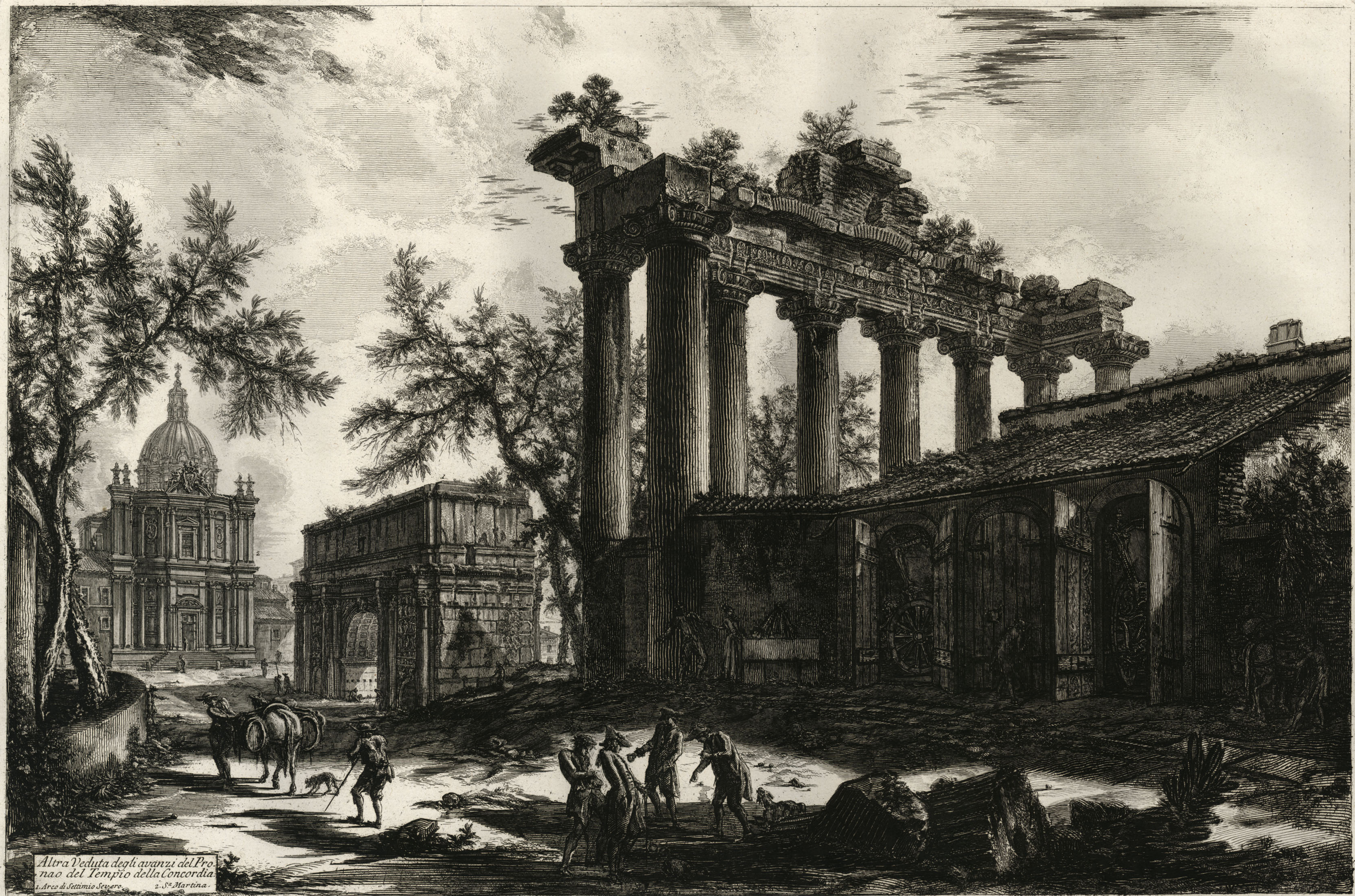
Altra Veduta degli avanzi del Pro- nao del Tempio della Concordia. L'Arco di S. Martina. S. Martina. Cavalier Piranesi f.