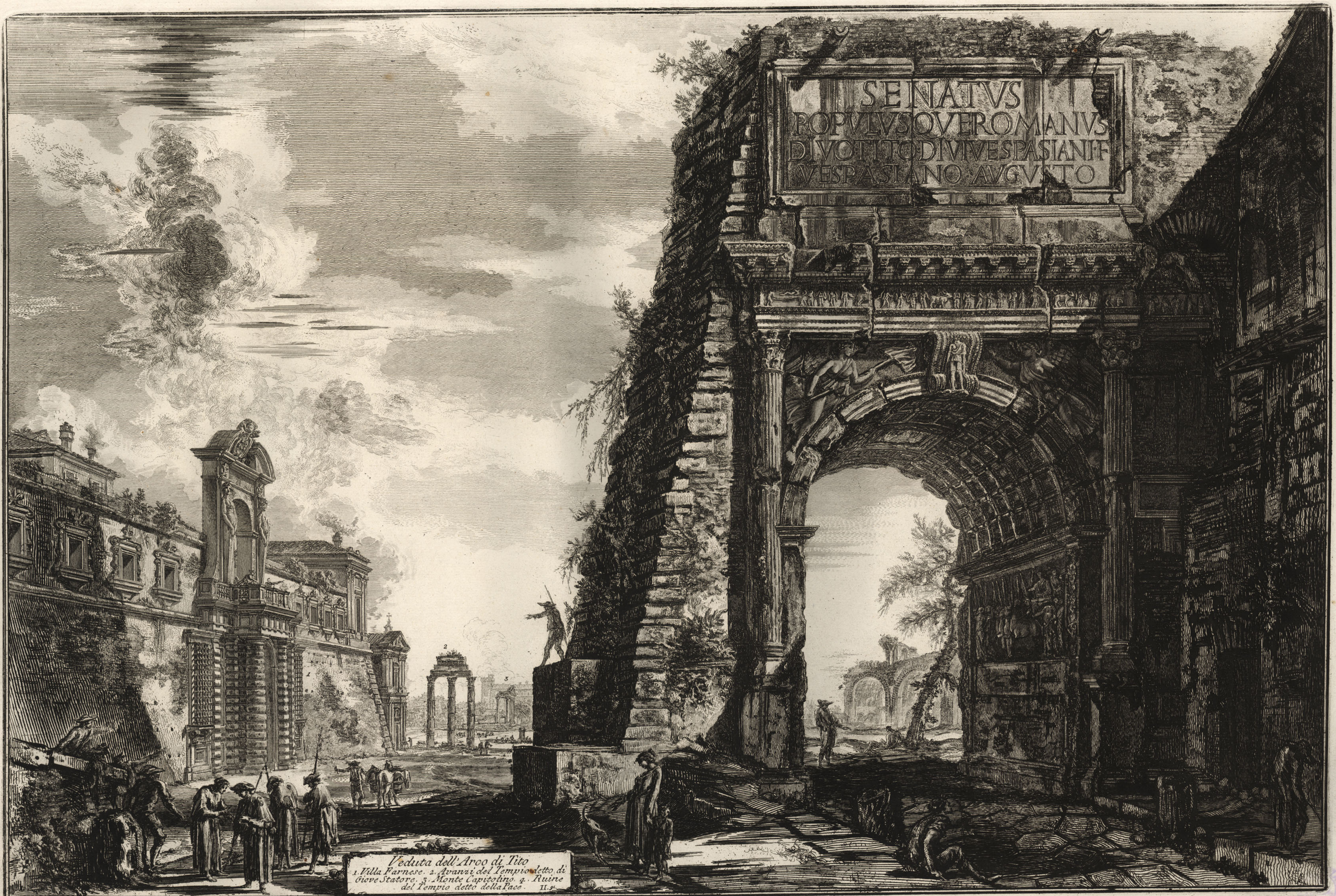
Veduta dell'Arco di Tito 1. Villa Farnese. 2. Avanzi del Tempio detto di Giove Statore. 3. Monte Capitolino. 4. Ruine del Tempio detto della Pace. II. 9.