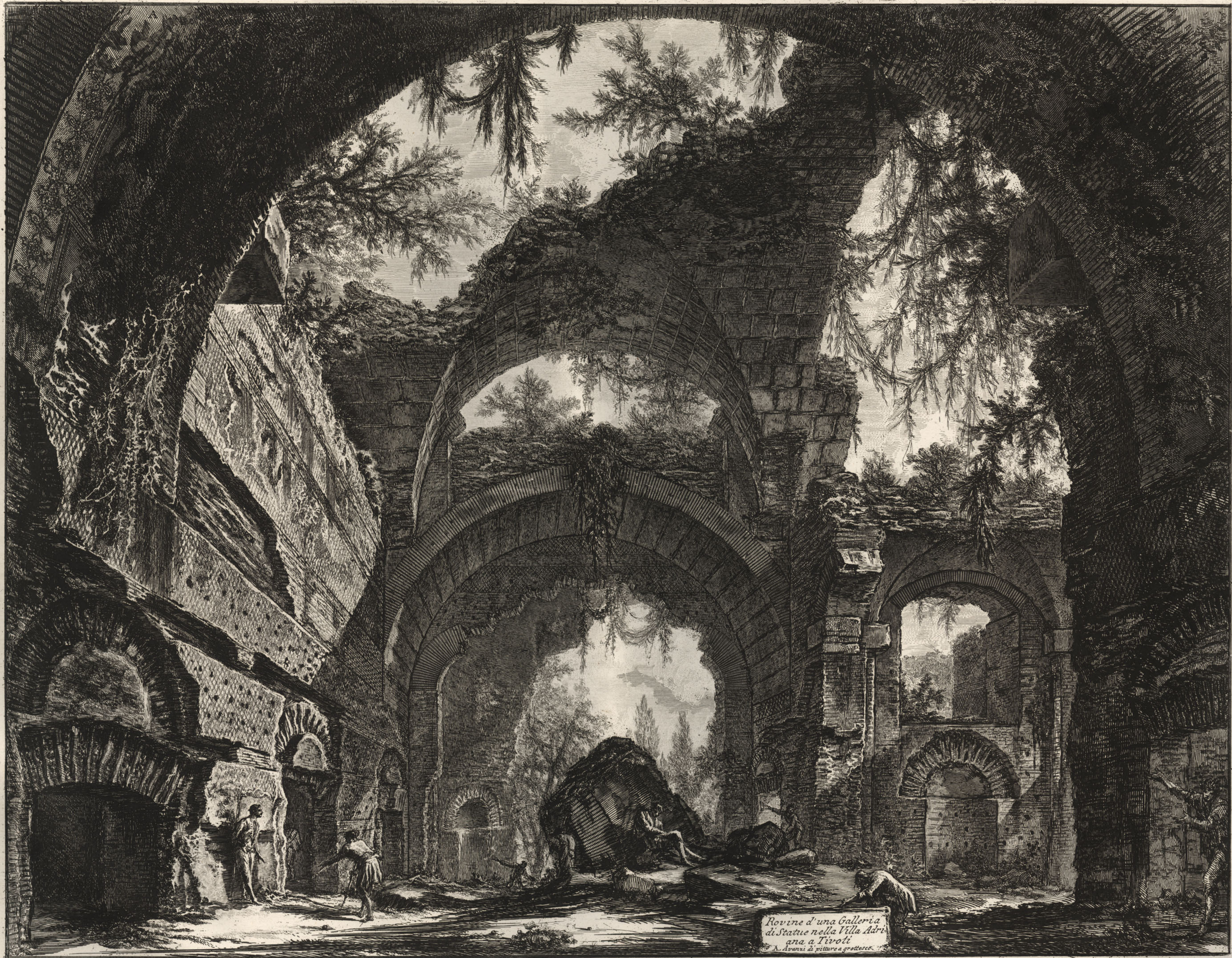
Rovine d'una Galleria di Statue nella Villa Adri- ana a Tivoli di A. Duranti pittore e grabatore.