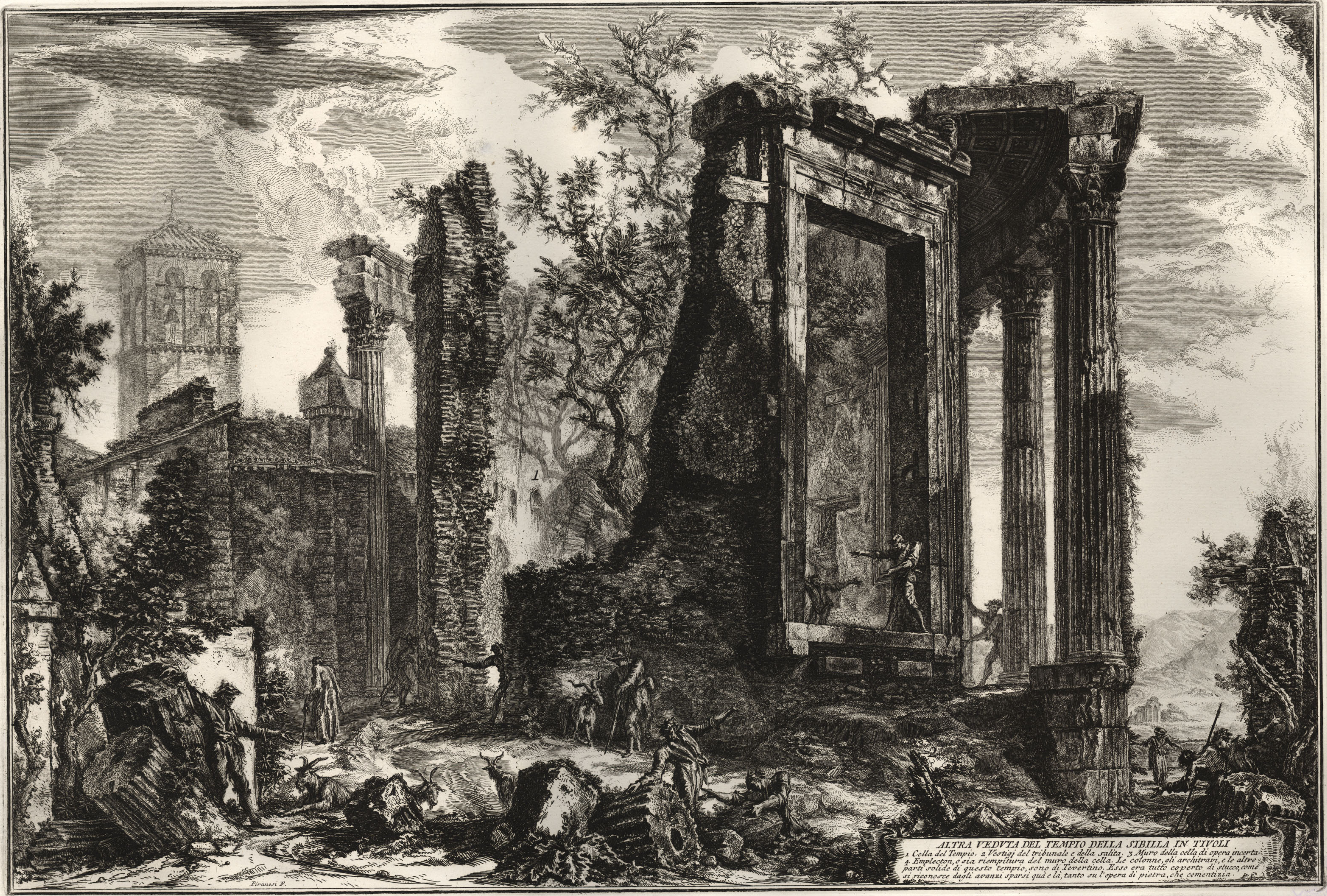
ALTRA VEDUTA DEL TEMPIO DELLA SIBILLA IN TIVOLI 1. Cella del Tempio. 2. Vestigi del tribunale e della scalita. 3. Muro della cella di opera incerta. 4. Embleton, o sia riempitura del muro della cella. Le colonne, gli architravi, e le altre parti solide di questo tempio, sono di Teverino. Esso era tutto coperto di stucco, come si riconosce dagli avanzi sparati qua e là, tanto su l'opera di pietra, che cementizia.