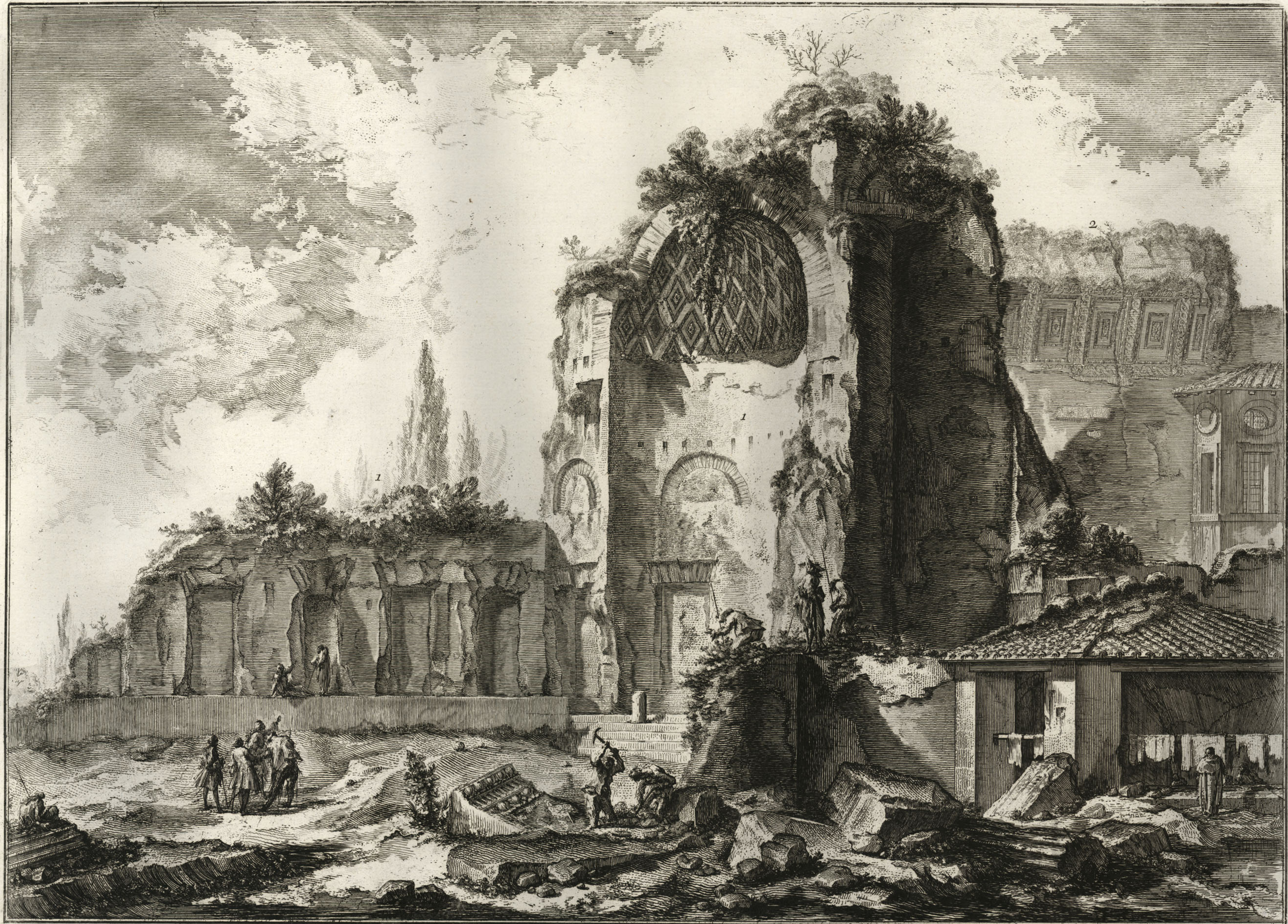
Veduta degli avanzi di due Triclinj che appartenevano alla Casa aurea di Nerone presi erroneamente per i Templi del Sole, e della Luna, o d'Iside, e Serapide. 1. Avanzo del Triclinio a uso dell' estate. 2. Avanzo dell' altro a uso dell' inverno. Questi rimangono nel Giardino de' PP. di S. Francesca Romana in Campo Vaccino.

Præter l'altare a grande Pilæ nel Palazzo Tomati vicino alla Trinità de' Monti