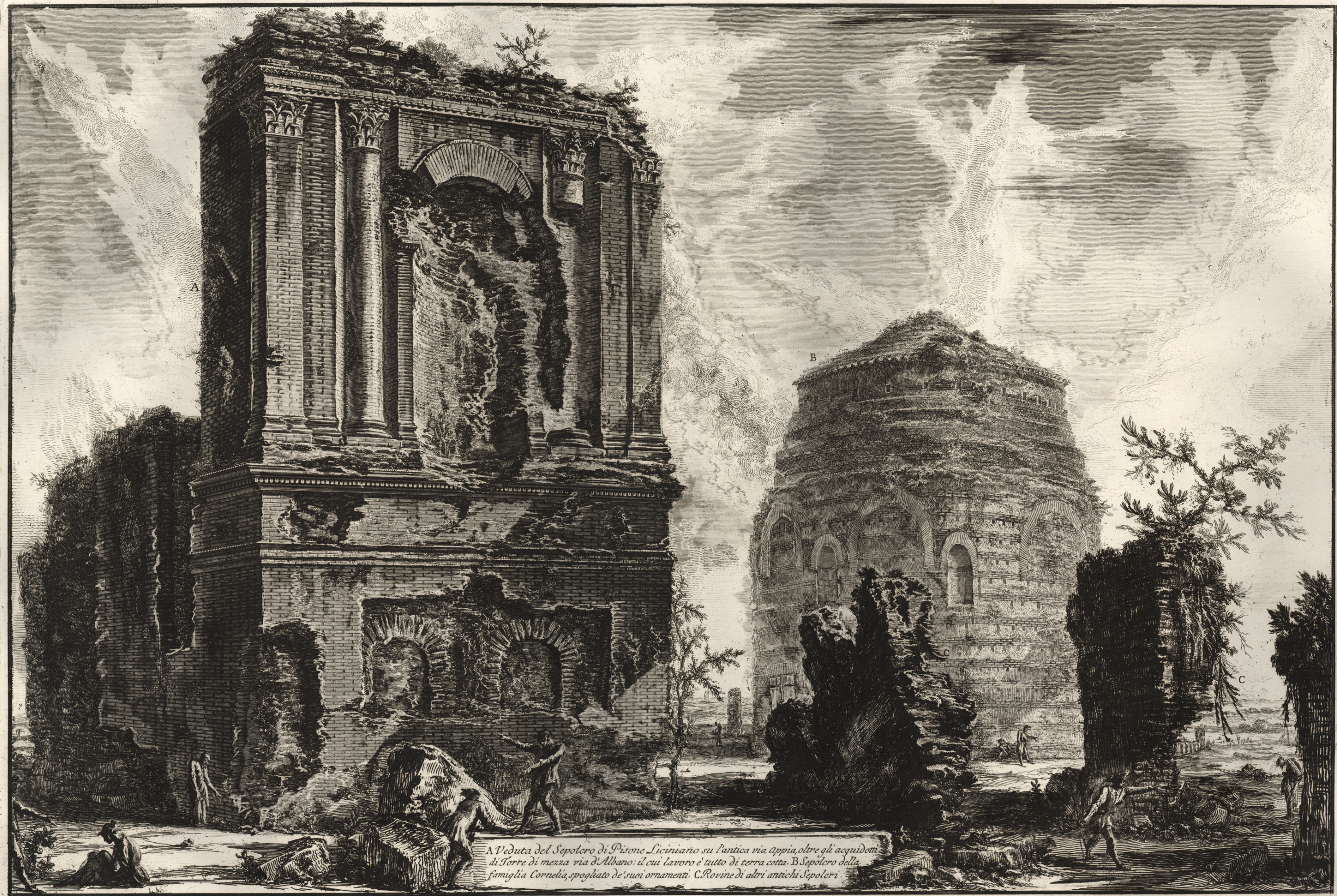
A Veduta del Sepolcro di Pisone Liciniano su l'antica via appia, oltre gli acquidotti di Torre di mezza via di Albano: il cui lavoro è tutto di terra cotta. B Sepolcro della famiglia Cornelia, spogliato de' suoi ornamenti. C Rovine di altri antichi Sepolcri.