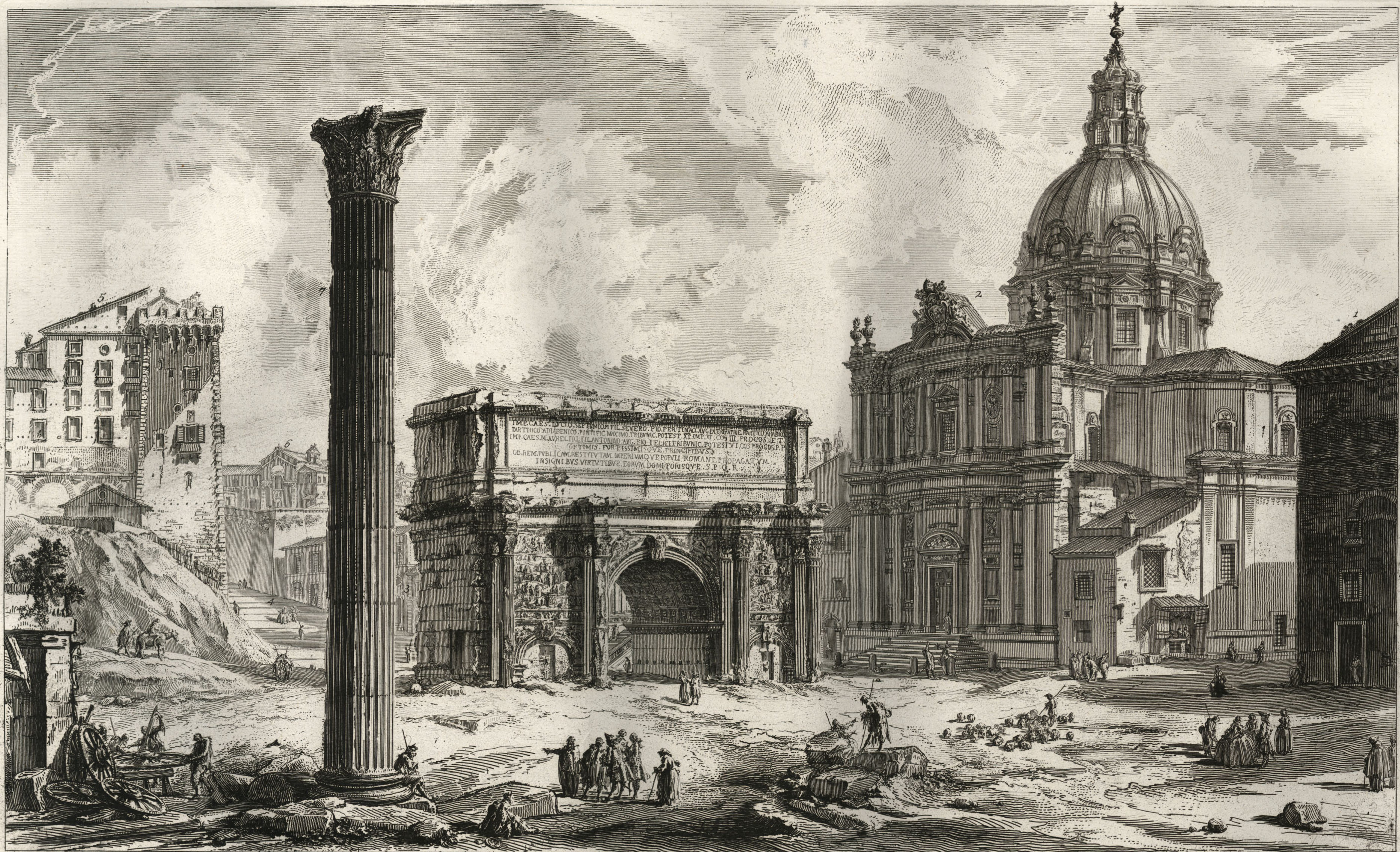
1. Erario antico, o come altri Tempio di Saturno, oggi S. Adriano. 2. S. Martina architettata da Pietro da Cortona. Chiesa dell'Accademia del Disegno, detta di S. Luca. 3. L'antico Carcere marmertino, nel quale sono stati posti i SS. Pietro, e Paolo. Sopra questo si vede eretta la Chiesa di S. Giuseppe. 4. Sella che porta al Campidoglio. 5. Abitazione del Senatore Romano.