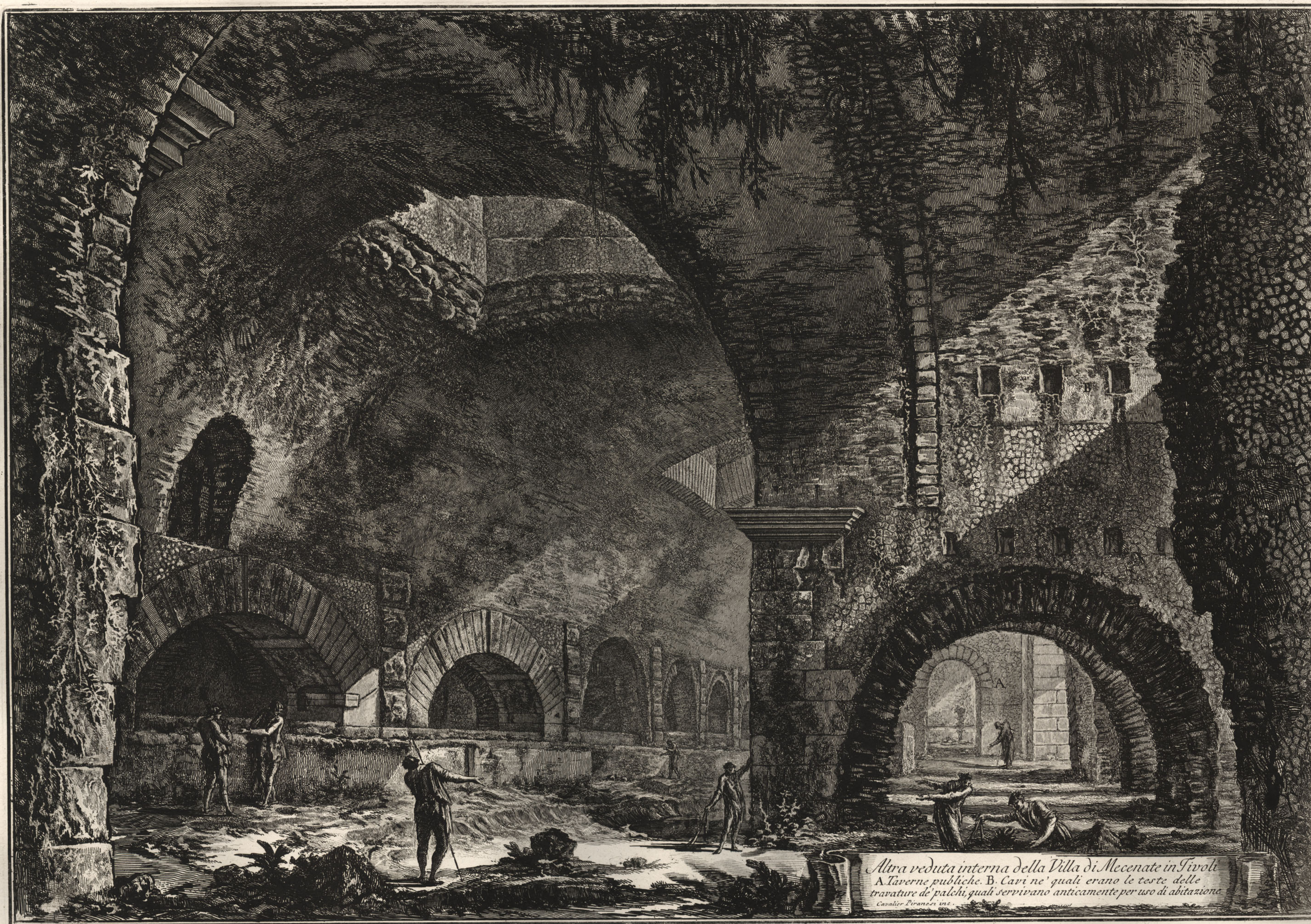
Altra veduta interna della Villa di Mecenate in Tivoli A. Taverne pubbliche. B. Cavi ne' quali erano le teste delle travature de' palchi, quali servivano anticamente per uso di abitazione.