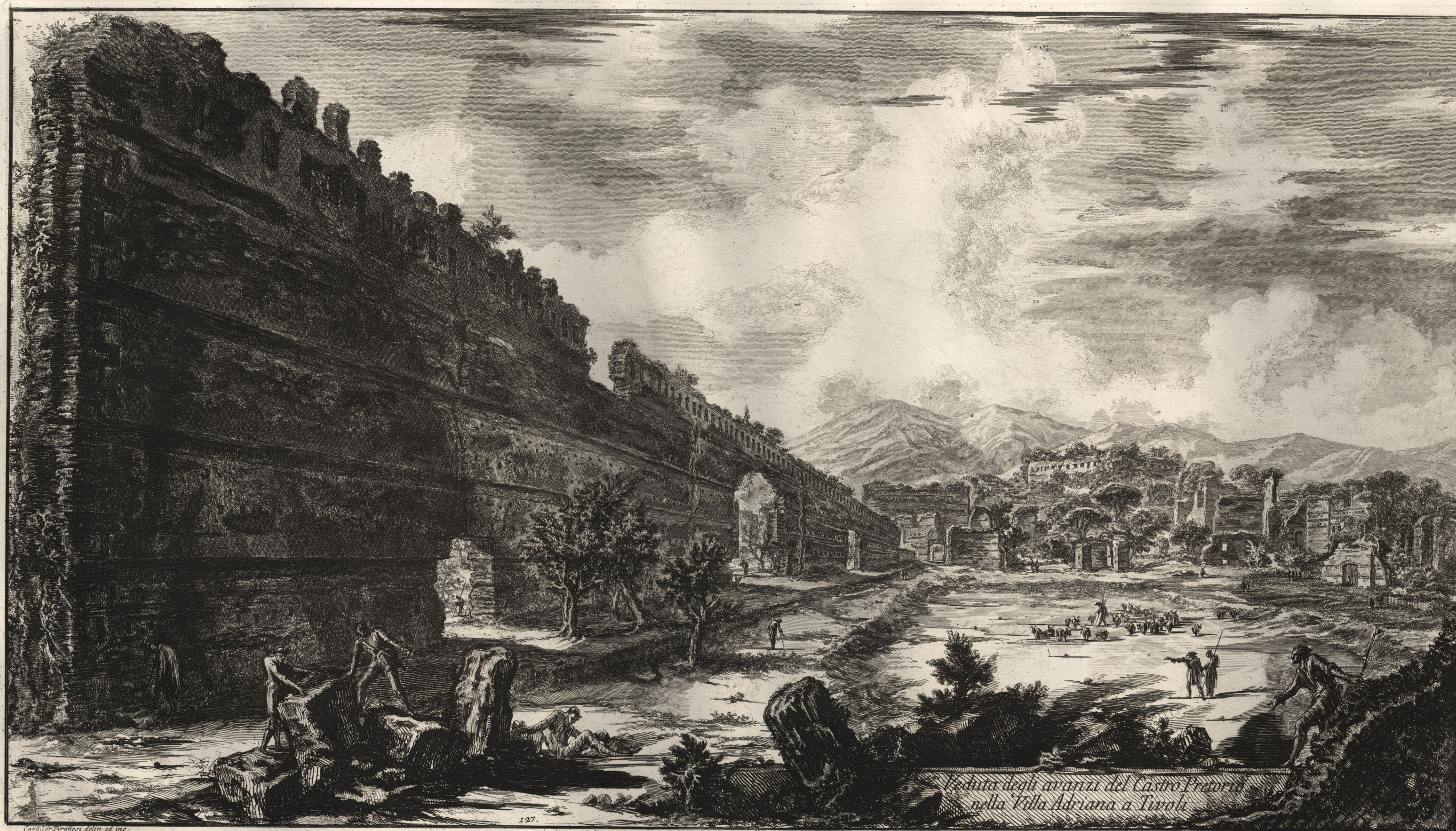
Veduta degli avanzi del Castro Praetorium nella Villa Adriana a Tivoli