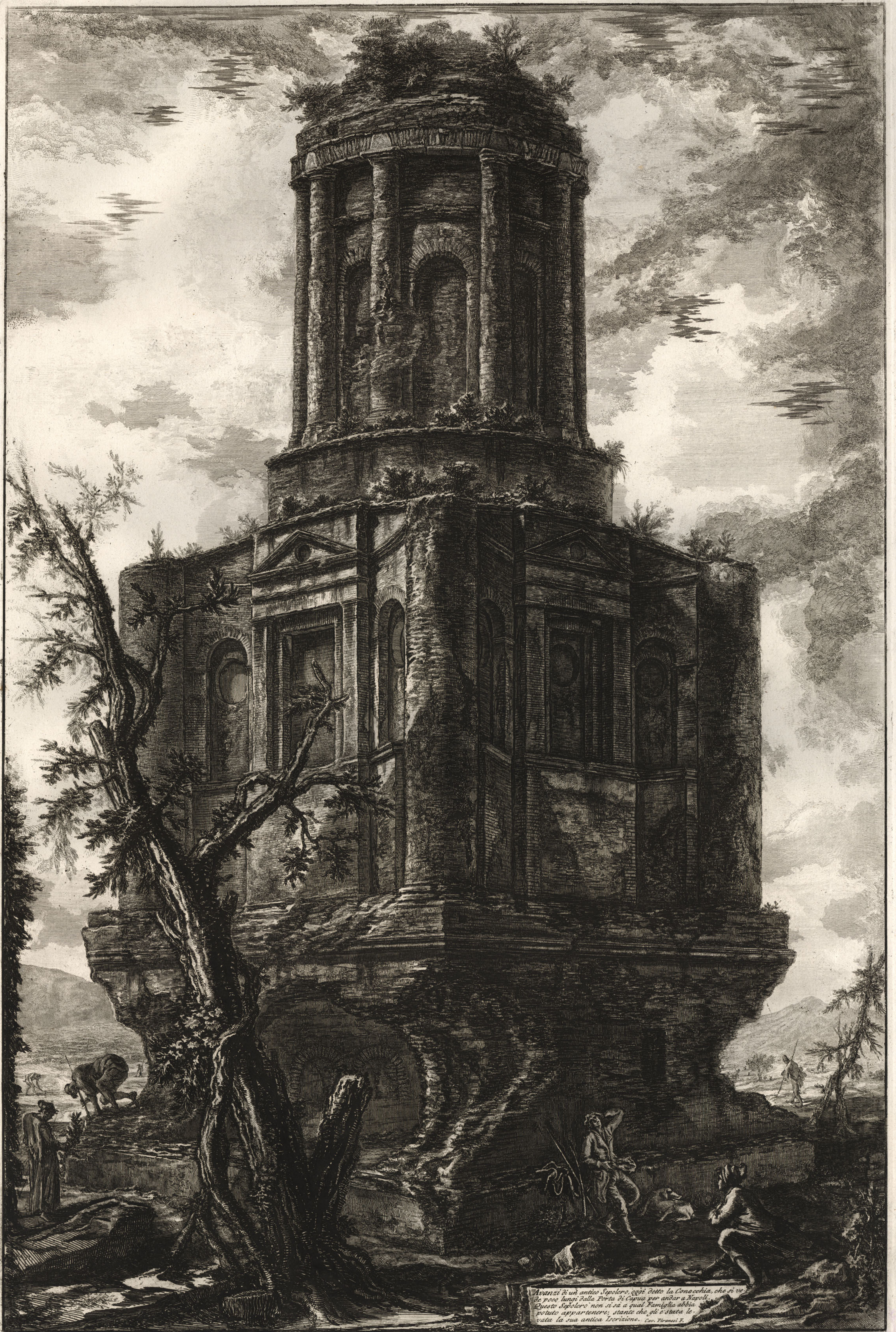
Ancient is an antique Sepulchre, call'd Petto la Conocchia , that is ve- ry near the Porta di Capua for and to Napoli . This Sepulchre is not known to what Family it belonged, but it is said to have been the same as the Antica Iscrizione . Cap. Virani 2.