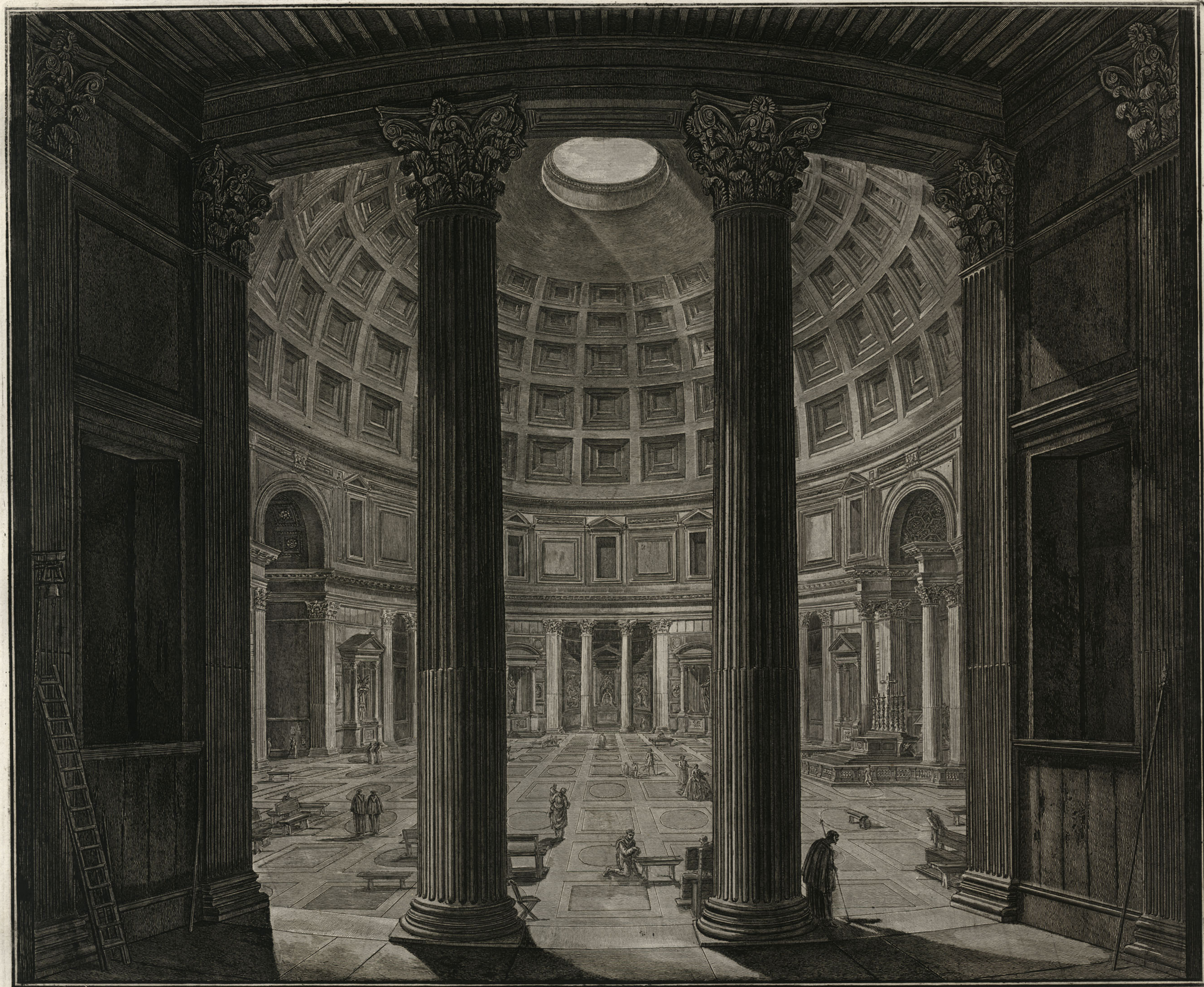
Veduta interna del Panteon. Questo tempio fabbricato da M. Agrippa è di forma rotonda, alto quanto il suo diametro. Il primo ordine è tutto antico. Le dodici colonne principali sono di giallo come le due della Tribuna quali non sono state mai rimosse dalla primiera loro situazione. L'architrave e la cornice sono di marmo, ed il fregio di porfido. Il second'ordine è moderno a riserva della cornice di marmo ch'è antica. Le incrostazioni di marmo, di porfido, di giallo, e di serpentino che l'adornano furono tolte da PP. Benedetto XIV perche minacciavano ruina, e fu adornato di stucchi come si vede al presente. L'Altar maggiore è moderno fabbricato da Clemente XI. Li otto altari minori sono antichi, come ancora il pavimento composto di giallo, di granito, e di porfido.