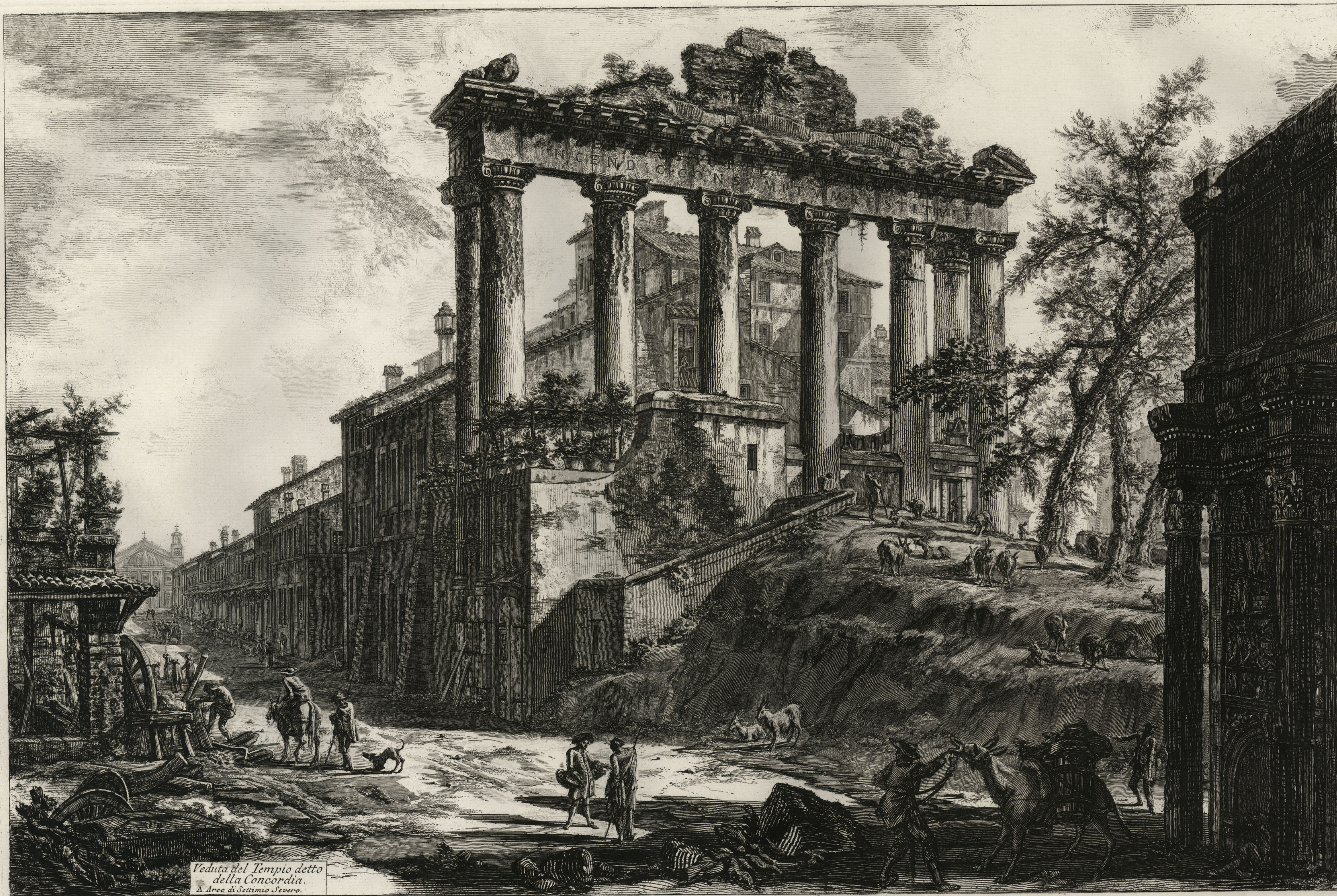
Veduta del Tempio detto della Concordia. A Arco di Seltinio Severo.