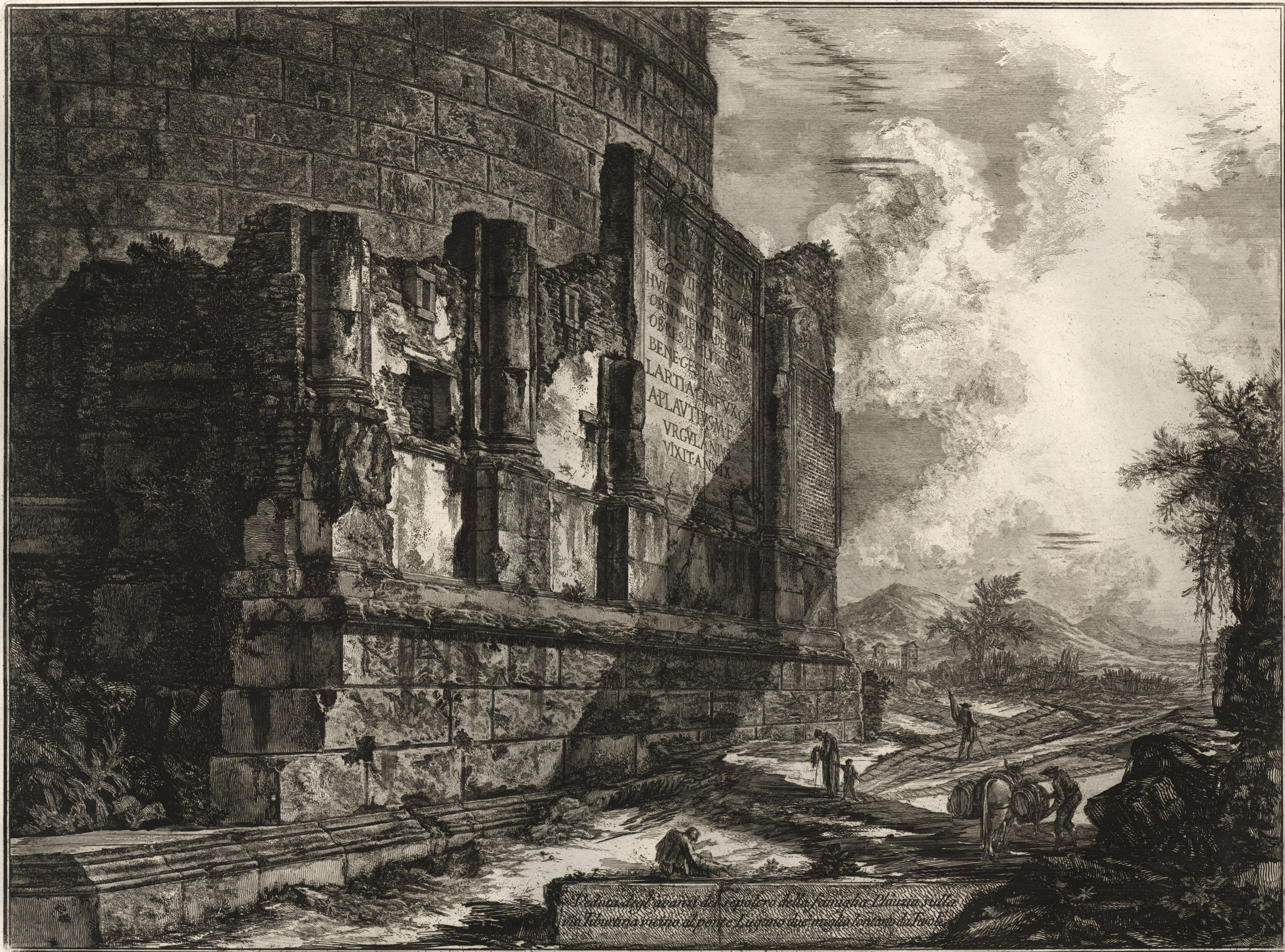
Arco di Tito, opera del sommo della famiglia Flavia, sulla via Sabuziana vicino al ponte Luperone che regge l'antico de' Fucoli.