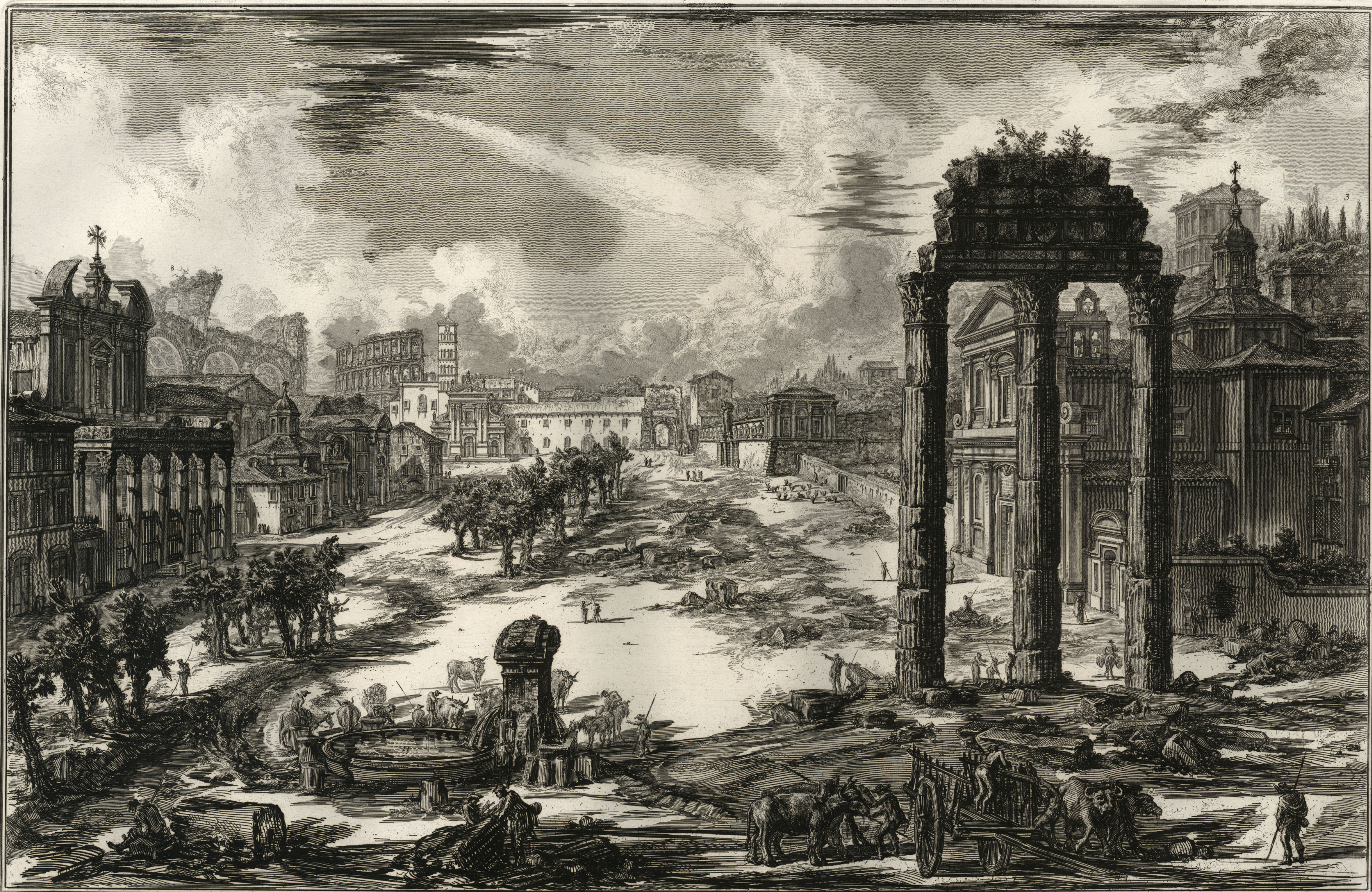
1. Colonne del Tempio detto di Giove Spatator. 2. Chiesa di Santa Maria Liberatrice piantata sul sito dove anticamente era il