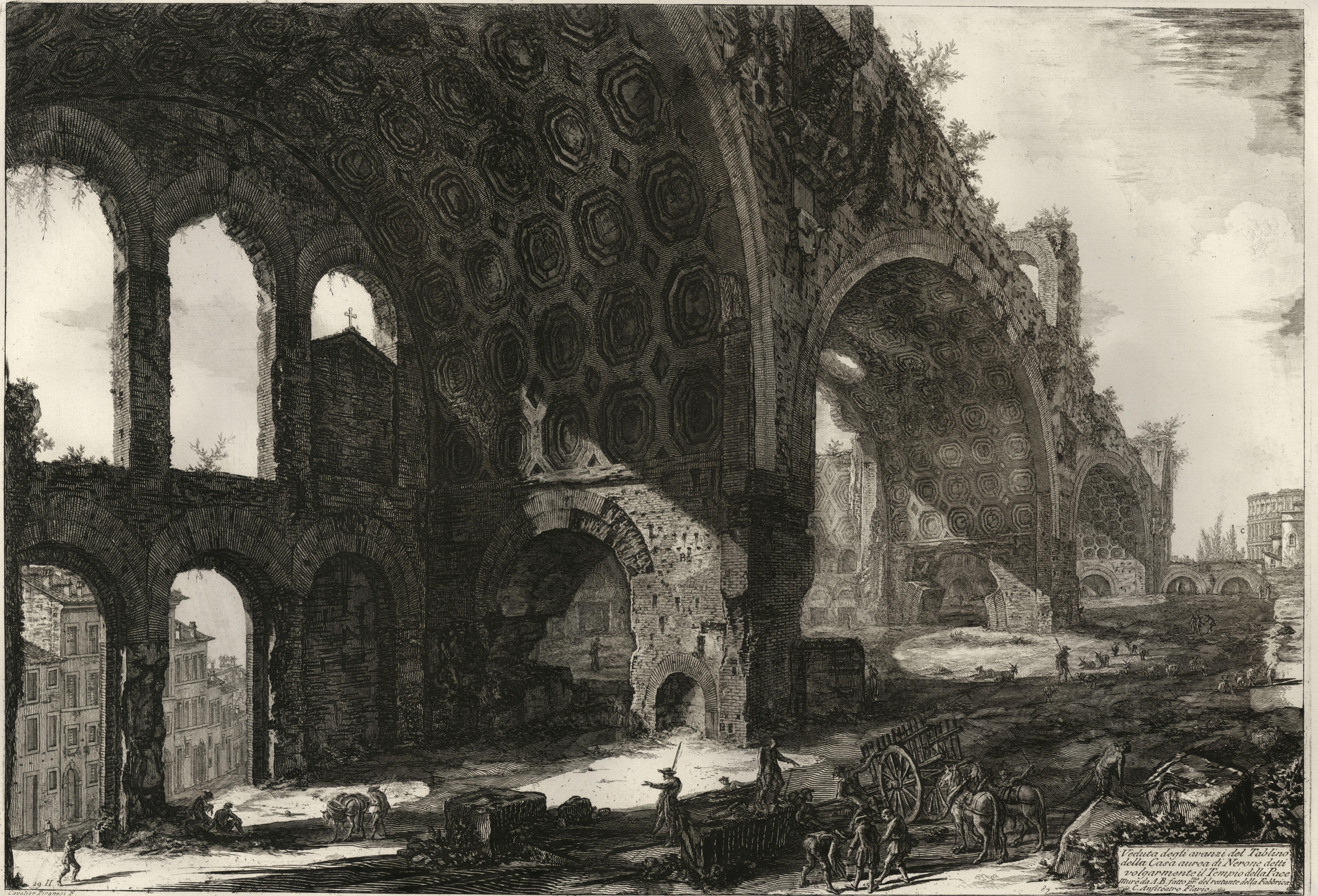
Veduta degli avanzi del Tabulario della Casa aurea di Nerone detti volgarmente il Tempio della Pace. Murò da A. B. fatto per del restante della fabbrica da C. Anziani Piaro.