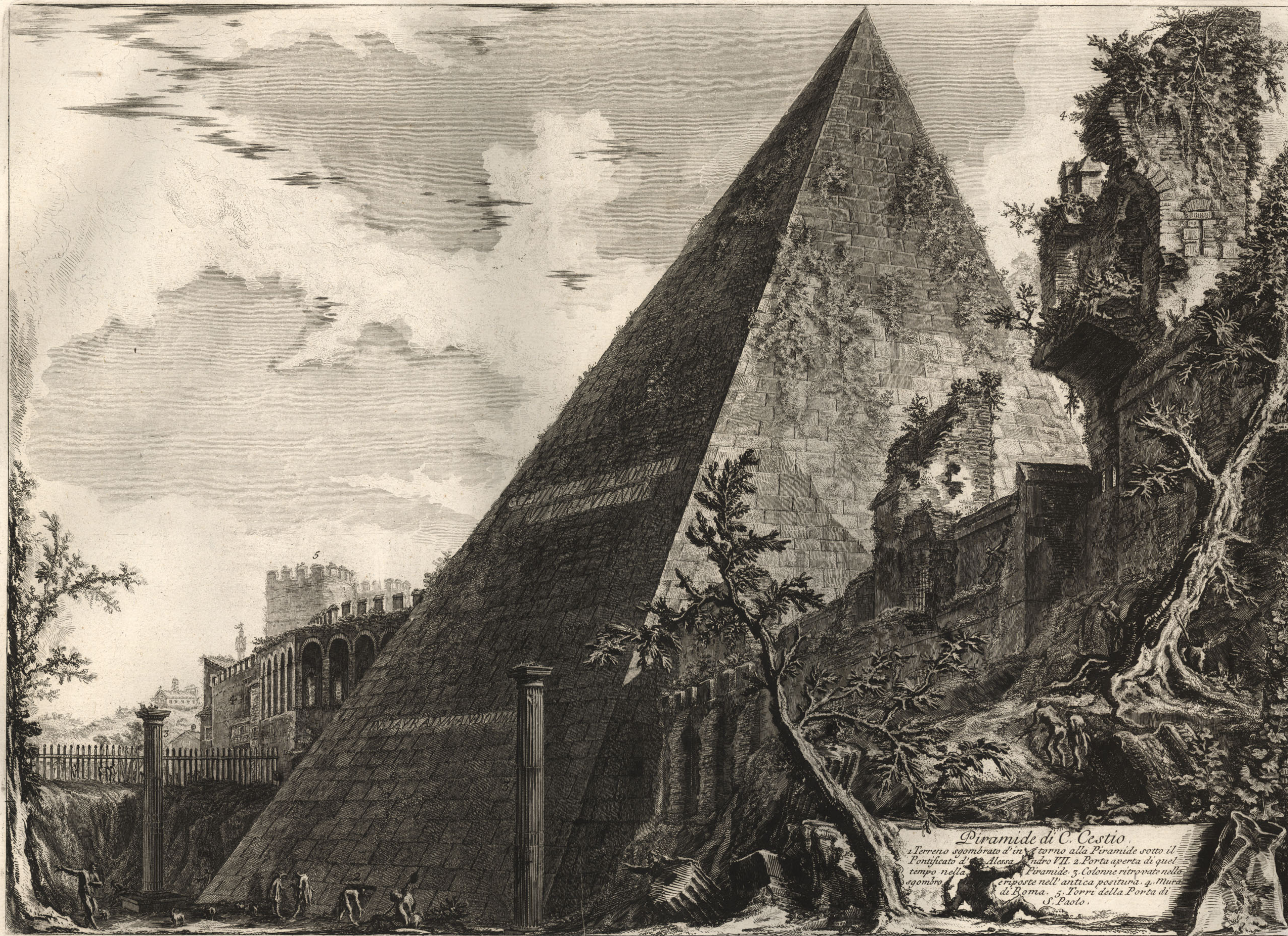
Piramide di C. Cestio 1. Terreno sgomberato d'intorno alla Piramide sotto il Pontificato d'Alano. 2. Porta aperta di quel tempo nella Piramide. 3. Colonne ritrovate nella cripta nell'antica positura. 4. Mura di Roma. 5. Torri della Porta di S. Paolo.