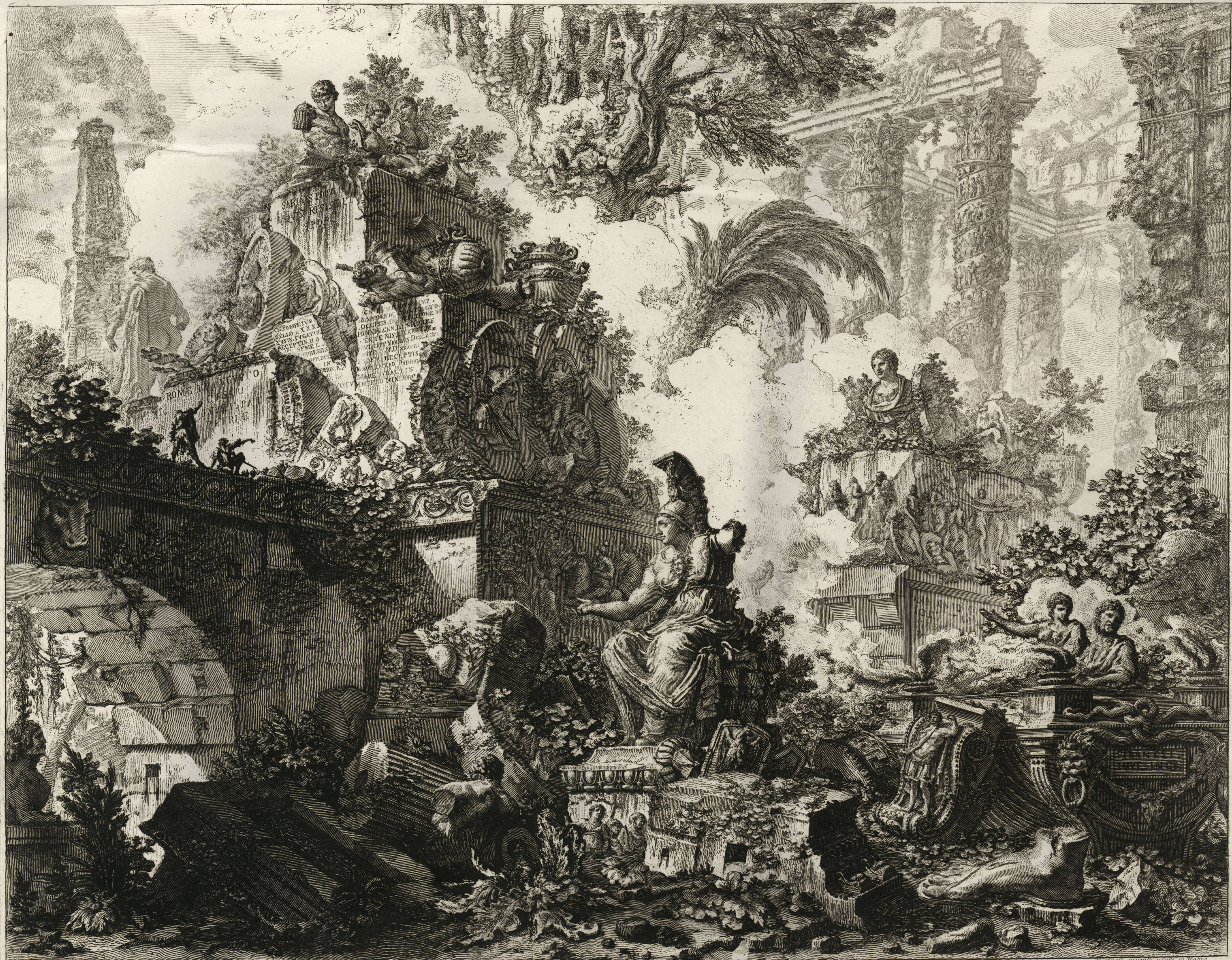
Presso l'autore all'Adra Polceci nel palazzo Senesi vicino alla Spinta de' monti.