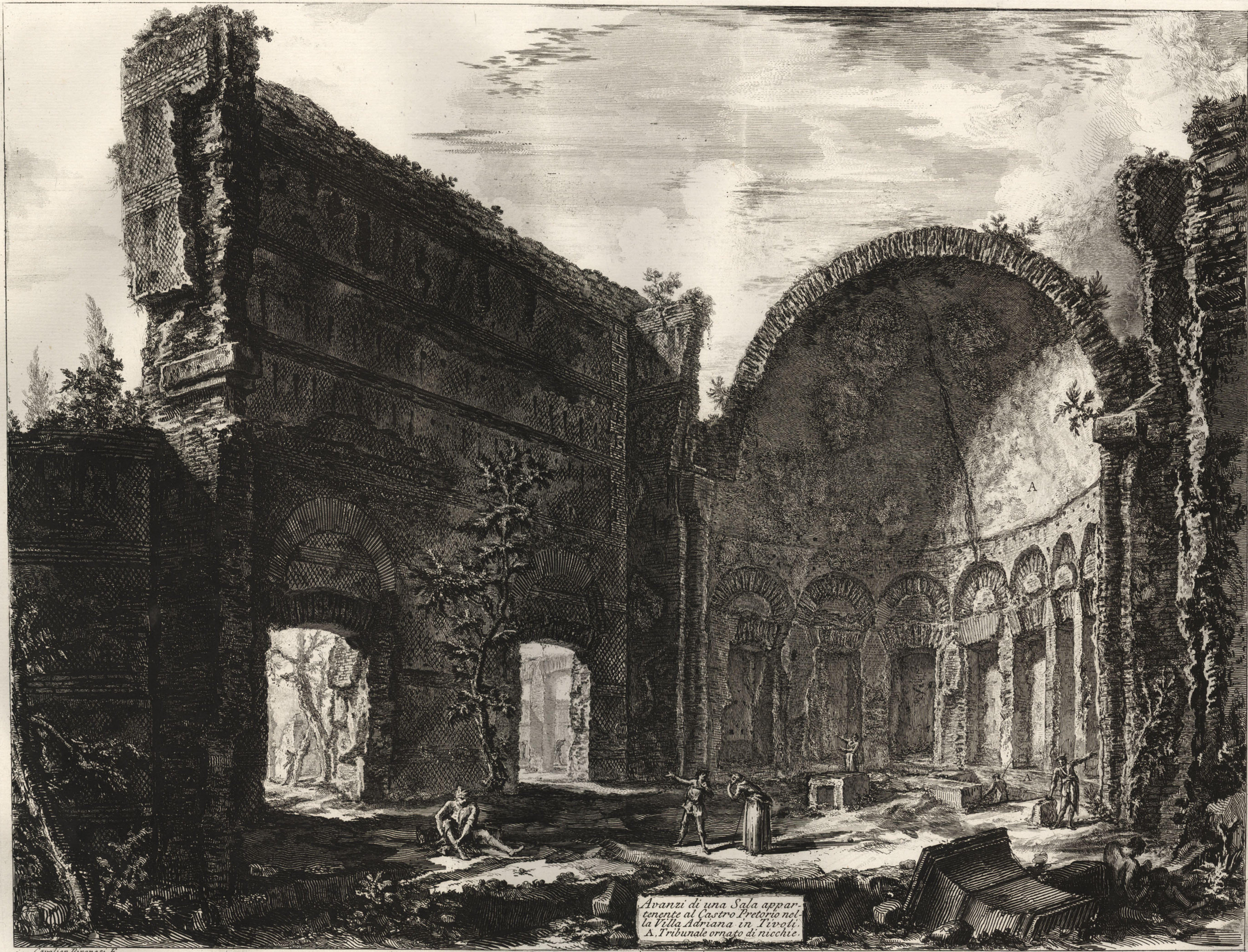
Avanzi di una Sala appartenente al Castro Pretorio nella Villa Adriana in Tivoli. A. Tribunale ornato di nicchie.