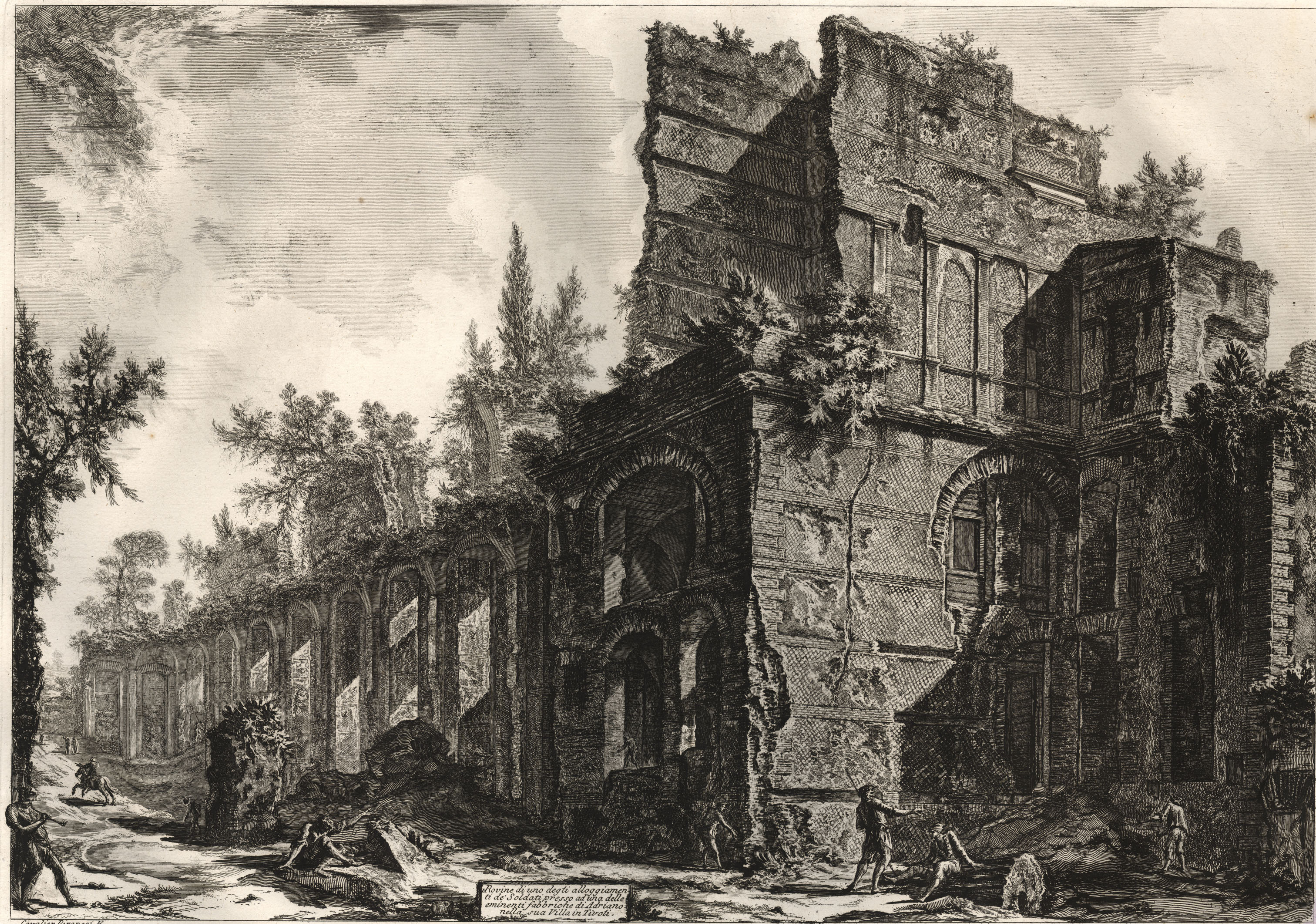
Rovine di uno degli alloggiamenti de' Soldati presso ad'una delle eminenti fabbriche di Adriano nella sua Villa in Tivoli.