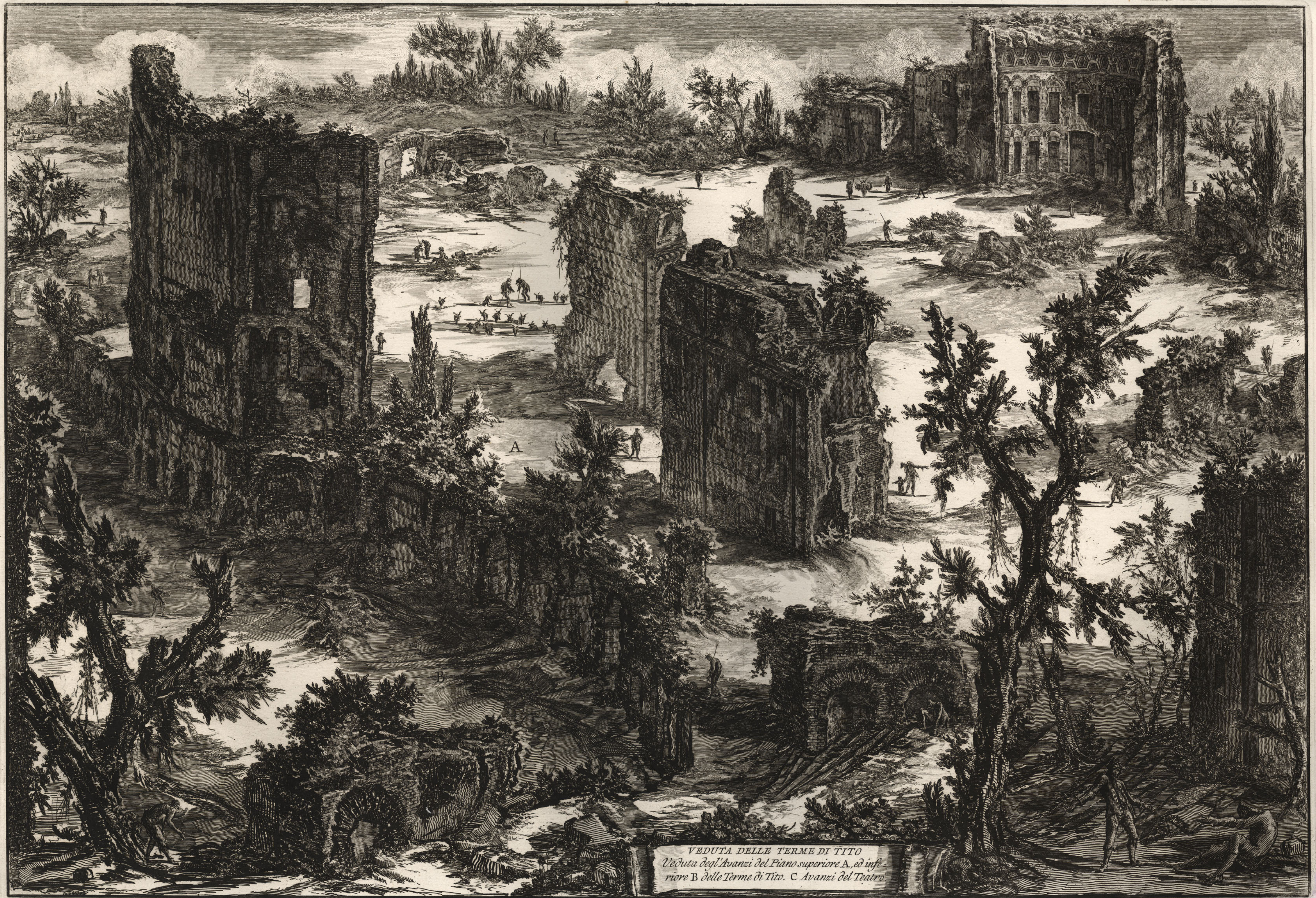
VEDUTA DELLE TERME DI TITO Veduta degl'Avanzi del Piano superiore A, ed infe- riore B delle Terme di Tito. C Avanzi del Teatro