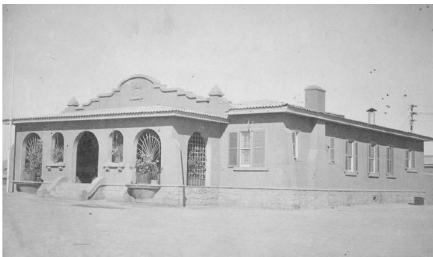
Fig. 2. Estilo "New Mexico" característico por sus frontones que rematan con figuras geométricas curvas.

Esta organización inicial de la ciudad, aún hoy se mantiene y está completamente vigente en todos sus usos, existiendo un