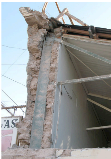
Fig. 5. Parte de la Pulpería, donde la caída del fímpano permitió descubrir la presencia de la estructura de hierro embebida en los guesos muros de adobe.

es de todos los edificios, el que más intervenciones presenta, lo que ha debilitado mucho su estructura y por tanto luego del sismo del 2007, se encuentra muy dañado (ver Fig. 5).