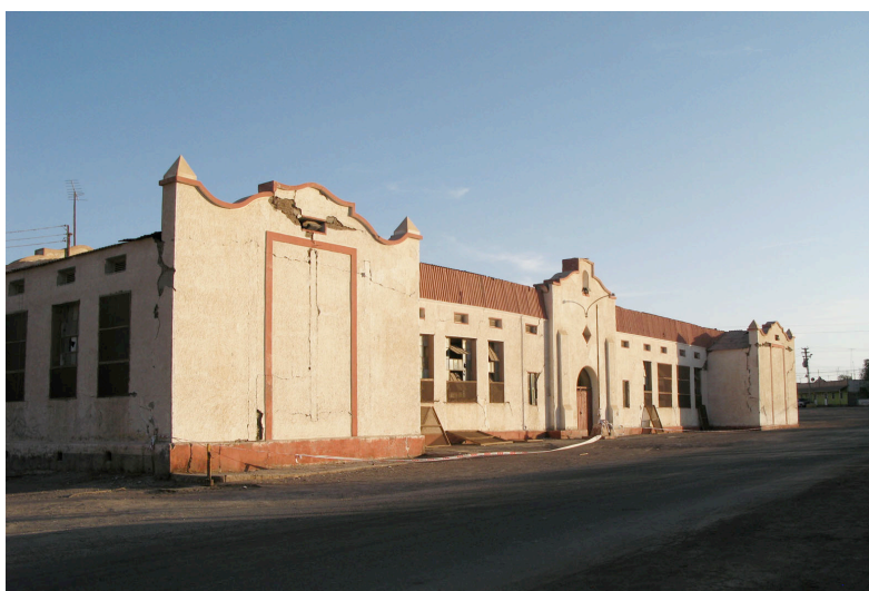
Fig. 4. La ex Escuela Consolidada, el edificio más emblemático de María Elena. (Créditos: Surtierra Arquitectura, 2008)

Por último, en el costado poniente de la plaza, se ubican el Mercado y la Pulpería de la ciudad, ambos edificios de grandes luces, construidos en sistema adobe-estructura metálica; la Pulpería lamentablemente