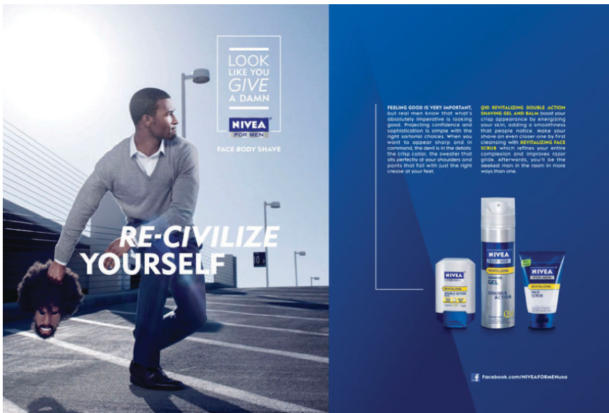
Figura 4. Anúncio da Nívea (“re-civiliza-te”), 2011.

Não será pois difícil de entender a controvérsia em torno da seguinte publicidade, que obrigou a multinacional alemã Nívea a um pedido público de desculpas (Visão, 2011).