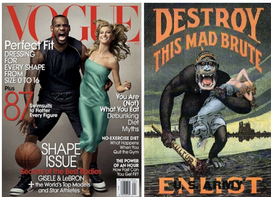
Figuras 5 e 6. Capa da Vogue América, April 2008 e Cartaz, norte-americano, de 1917, a recrutar militares para a primeira guerra mundial. In: Shea, D. (2008).

Grande parte dos hábitos passam despercebidos e incólumes pela nossa mente, por isso, temos de fazer um esforço acrescido para os notarmos como nossos e não necessariamente de todos. Mas se é difícil detetarmos e legitimarmos pontos de vistas alternativos, quando confrontados com produtos mediáticos isolados, mais árdua se torna a tarefa em torno de discursos inteiros.