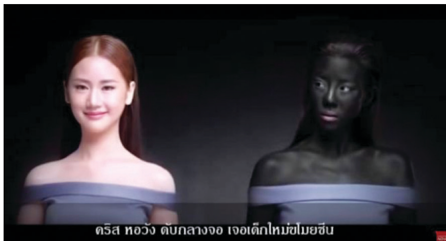
Figura 2. “Você só precisa ser branca para vencer”, anúncio tailandês de creme clareador, 2016. In: Jardim, 2016.

Em 2014, o Conselho de Regulação Publicitária da Índia introduziu regras mais apertadas para as publicidades aos cosméticos clareadores, após queixas contra anúncios racistas que tendiam a exacerbar o estigma social já existente, num país onde a maior parte da população tem pele escura (Emmanuel, 2014). Mais recentemente, o slogan “Você só precisa ser branca para vencer”, de um comercial de creme branqueador na Tailândia, gerou igualmente polémica e reacendeu o debate sobre racismo no país.