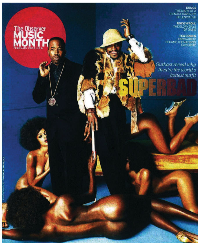
Figura 1. Capa da revista The Observer Music Monthly, February 2004, no. 6. In: Bennet et al., 2006: 102.

O importante é possuímos uma atitude crítica que espolete o que Gaines (2010) chama de “reação aha!” e que quebre com o hábito de aceitar, sem questionar, as representações midiáticas como realidade. O autor explica que um “travador de pensamento” é acionado quando o intérprete se depara com um signo que entra em conflito com a sua experiência ou noção de identidade. Assim, apesar de nem todas as representações raciais causarem essa “reação aha!”, muitos desses signos conflitantes estão relacionados com as considerações seguintes.