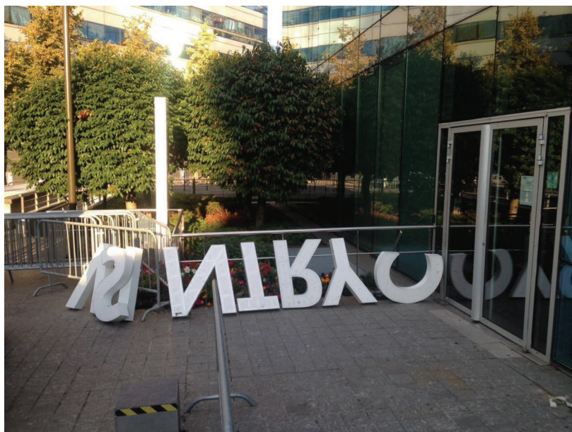
Fig. 3 – a tentativa frustrada de mudar um canal de informação para “fábrica de notícias”

Fonte: TÉLÉOBS: La rédaction d’iTélé le 22 octobre 2016. Les lettres qui formaient le mot “News factory” ont été enlevées après que plusieurs soient tombées. (STR / AFP)