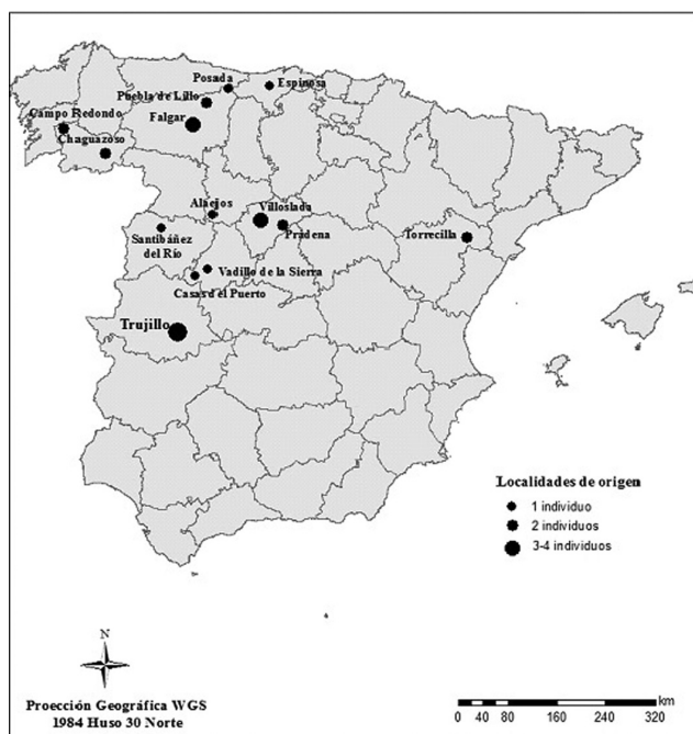
Mapa 2 – Procedencia peninsular de las migraciones a la ciudad de Trujillo