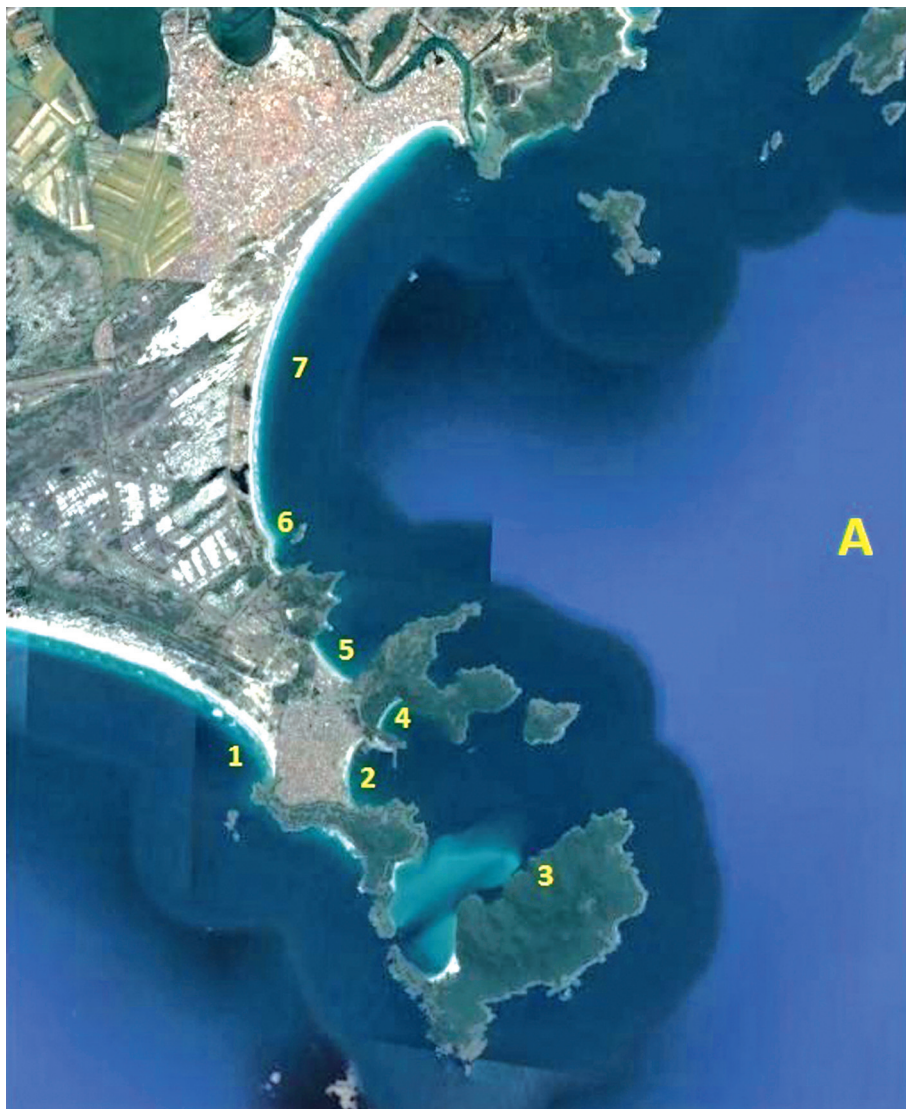
Figura 3 – Localização de pescarias no litoral entre a restinga de Massambaba e a Ponta de Búzios em 1729

A: Trecho litorâneo entre a Restinga de Massambaba e barra de Cabo Frio (Itajurú)