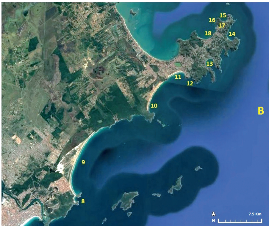
B: Trecho litorâneo entre a barra de Cabo Frio (Itajuru) e a Ponta de Búzios 8 – Praia Brava ou Vermelha; 9 – Praia do Peró; 10 – Praia da Emerência; 11 – Praia de Jerubá; 12 – Praia da Ferradurinha; 13 – Praia da Ferradura Grande; 14 – Praia Brava; 15 – Praia de João Fernandes; 16 – Praia da Sardinha; 17 – Praia do Maribondo; 18 – Praia da pescaria dos Índios.

Em Saquarema também se exercia a atividade piscatória. Embora as descrições aludidas não mencionem as pescarias a sul da Praia Grande na restinga de Massambaba, em 1729 vários moradores da localidade tinham como ofício serem pescadores 58 . Como quer que seja, os exemplos demonstram a pesca como uma atividade intensamente exercida. Nos princípios do século XIX, Auguste de Saint-Hilaire percorrendo a região em análise descreve-a, verificando-se que os núcleos populacionais continuavam dedicados à atividade. Em Saquarema