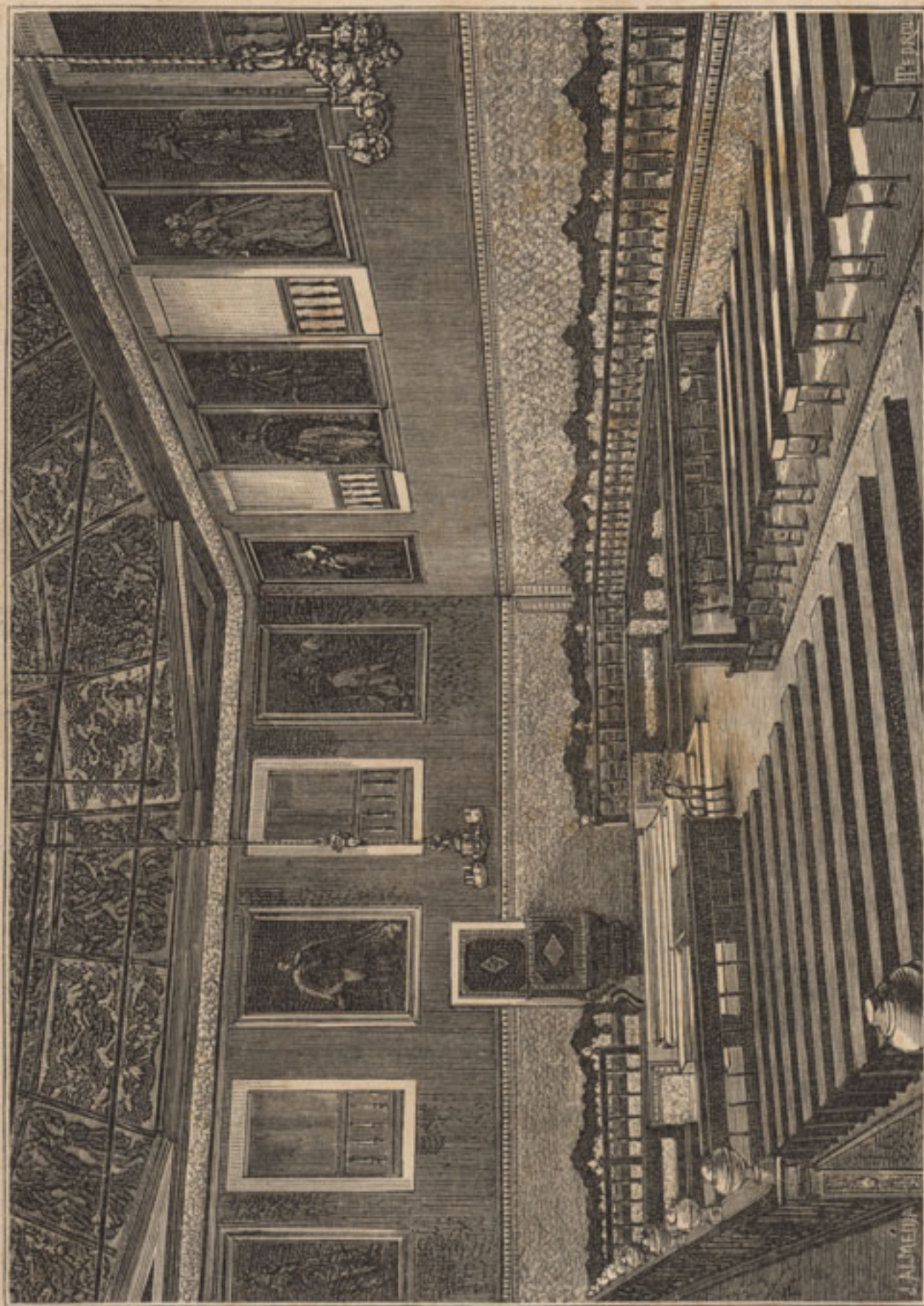
Sala dos actos grandes