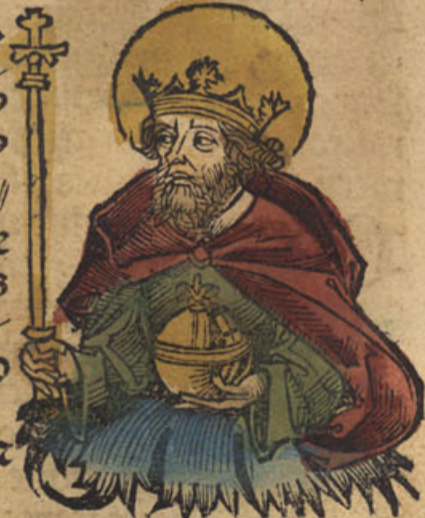
S. Robertus rex

R ober⁹ rex fr̄acie ea tēpestare. nō min⁹ piam. quā regalē vitā ducebat. Nā et doctrina et sc̄titate oēs reges xp̄ianos antebat. vt disputationib⁹ nulli secūdus haberet. quē merito laudamus. Cui⁹ preterea tanta fuit religio. vt q̄tiēs sibi p̄ occupatio-