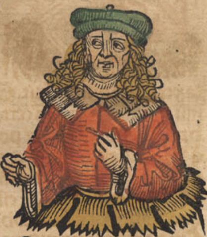
Seno ⁊ Arnulphus

I saac Benimirā medicus celeberrim⁹ salomōis medici filius. Et ip̄e tepestate istac. in medicina plura scripsit. de dictis vniuersalibus ⁊ p̄ticularibus de fe- bribus de vrina. ⁊ stomacho. In p̄bia q̄z de elementis ⁊ diffinitōnibus tractatus composuit.