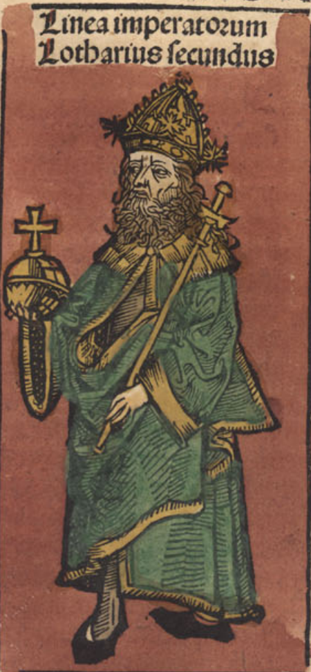
Linea imperatorum Lotharius secundus