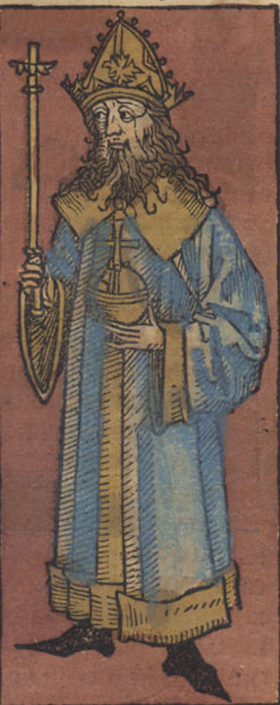
Linea imperatorum Fridericus primus

H eresis waldensium seu pauperum de lugduno per hoc tempus initium sumpsit. cuius auctor quidam nomine Waldo lugdunensis ciuis fuit. Is cum diues admodum haberet opibus relictis et pauperibus erogatis diabolo lica quadam suasionem ductus euangelicam paupertatem omnimode obseruare studuit. unde cum ideota esset. quosdam vulgares libros cum quibusdam sanctorum dictis sibi conscribi fecit. quos non sane intelligens suo inflatus spiritu predicando sanctorum apuloꝝ officium sibi usurpare curauit. Congregatis itaque innumerabilibus quasi discipulis multos et quidam pessimos errores disseminare cepit. platos et clerum penitus aspernando. Adonitus autem respondit. obedire oportet deo magis quam hominibus. et cum in suo sensu obduratus persisteret. tandem veluti here ticus pessimus anathematis vinculo innodatus patria pellitur. que res facta est in laqueum maximam simpli cioribus. adhuc multis in locis hec fatuitas viget.