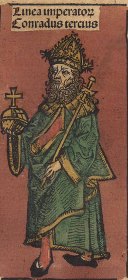
Linea imperatoꝝ Conradus tercius

M ulti extimāt ab isto Guelfone duce baioariē Guelfos appellatos. cuius pestiferi nomē maxie in Italia inualuit. cū auferat vnitatē et pacē vt nūq; inde poterat extirpari. nā hic Guelfo viuente corado se impatori imposuit. hi populi italicōꝝ qui imperiale dominiū in ytaliam detractāt vsq; in diem hodiernum guelfi nūcupant. sed qui in italia aliā partem fouent gebellini. Ceteri aliam causam assignant vnde dicātur fautores ecclesie guelfi et fautores imperij gebellini. de quo latius infra fiet mentio.