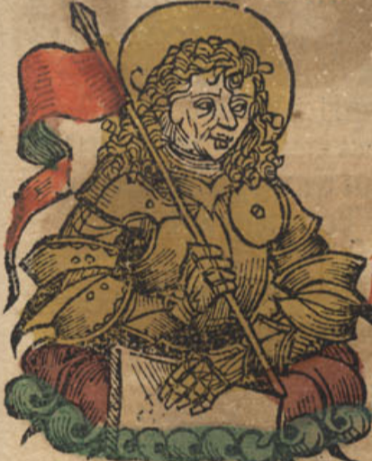
Philipp 9 rex francoz

A lbertus miles gloriosus post gloriosa certamīa martirio coronatus est. A nshelmus epūs beluacensis p̄ hec tpa cuz in omi sanctitate moribusq; p̄claris vixisset diē obiit. ad cuius sepulchrum diuinitus lampades accense sunt. ex cepta vna cui oleum vsurarius quidam administrabat. P hilippus francoz rex lodouici supioris regis fili 9 . post patrē regnavit annis. 44. Is postea cū audis- set iherosolimā a saladino captā demēte pōtifice admo- nēte. cū mult̄ xp̄ianoz p̄cipib 9 siriā adnauigauit. cūq; ptolomaidē vna cū richardo angloz rege se recepisset. et inde iherosolimam repetituri essent jambo de iherosoli- moz regno cōtendere ceperūt. demū philippus hic in- dignatione cōmotus simulata infirmitate in europaz (di- missio richardo) regressus est. vbi in regnū suū introgress 9 reliquū vite sue tempus in pace ac sanctimonia cōsumpsit ferunt historie hunc philippū religiosoz orationibus mi- raculose fuisse natū. q̄a cū lodouicus pater iā sexagenari 9 liberis careret vniuersis populis p̄cepit vt dñm instanter deprecarentur. quo facto hunc genuit filium.