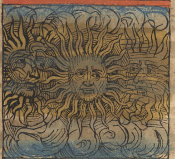
Jo. carnotensis ep̄s

Johannes carnotensis ep̄s et beati thome canthuariensis familiarissim; homo doctrina et eloquentia clarissimus his temporibus in p̄cio existens librum de vestigijs philozophozum et nugis curialium composuit. ac etiam vitaz p̄p̄ius beati thome accuratissime edidit. Atq; alia quedam scripto mandauit.