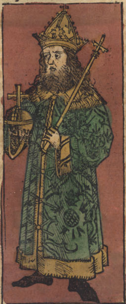
Linea impatorū Fridericus secundus