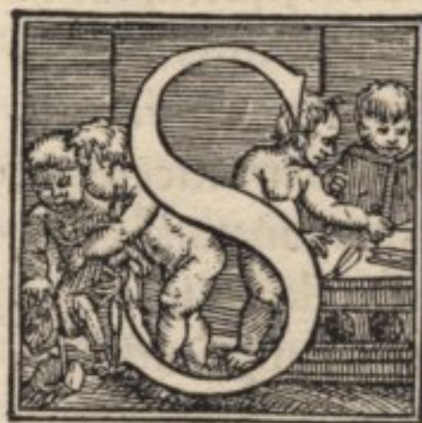
Sexti musculi administratio.