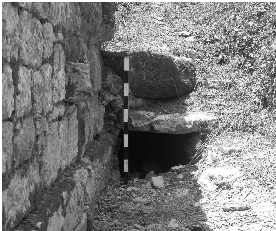
Figura 4. Viaduto de Conimbriga, aspeto da canalização.

Por perceber fica ainda a questão de saber como teria sido gerido pelo arquitecto da obra o escoamento das ingentes quantidades de água que seriam captadas pelo monumento, somadas àquelas que, drenadas a montante do monumento (toda a área nordeste da cidade incluindo a casa dos repuxos, as termas do aqueduto e o moinho, três instalações hidráulicas de monta), teriam necessariamente de ser escoadas através dele. Junto ao viaduto conservam-se vestígios de um encanamento (Fig. 4) que é talvez o mesmo a ser identificado a jusante, numa estrutura denominada como aqueduto 14 , ainda hoje conservada na Rua da Fonte, e que pode talvez fazer parte desse sistema de drenagem.