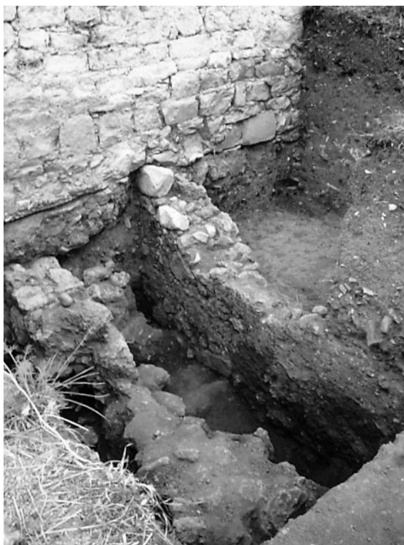
Figura 5. Sondagem de 2006: aspeto do vomitorium e da sobreposição da muralha Baixo-Imperial.

Do ponto de vista físico, é sobre um revolvimento dos níveis alto-imperiais, provavelmente associável à demolição dos inícios do século IV, que se desenvolveram as camadas tardias. O momento de anulação do anfiteatro é perfeitamente observável pelo enchimento súbito do vomitorium 15 , pela selagem geral desse contexto de actividade, e também, indirectamente, pela circunstância de o mesmo corredor ter servido de base à nova muralha (Fig. 5). Os níveis de circulação imediatamente posteriores, balizáveis entre os inícios do século V e o fim do seguinte consistem em camadas tendencialmente horizontais, com reduzida potência, tanto em termos estratigráficos como de materiais associados.