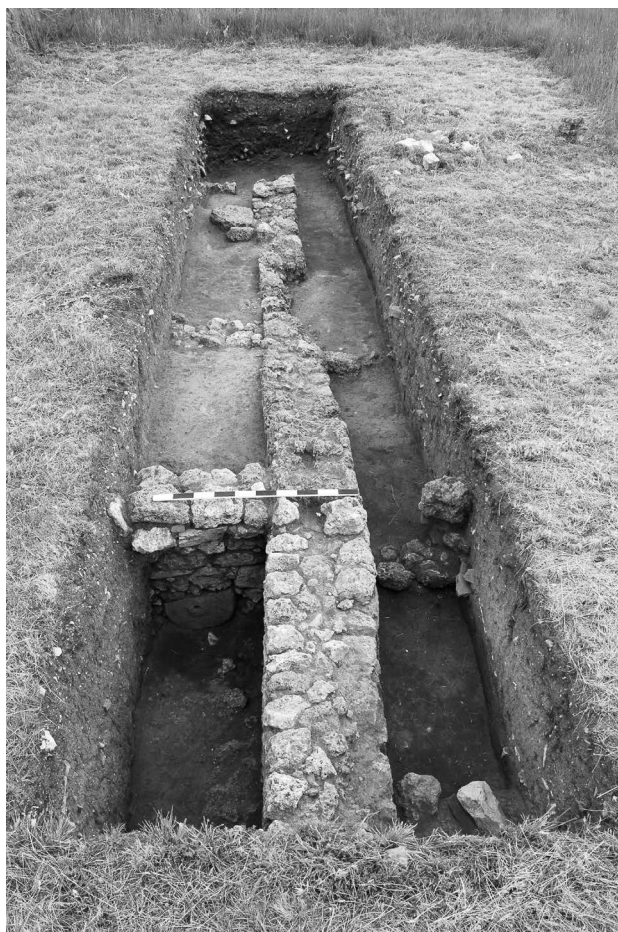
Figura 6. Sondagem de 2013: aspeto geral, visto de Norte.

(Abril-Maio). A sondagem está situada a cerca de uma dezena de metros para Sul das sondagens dirigidas por Adriaan De Man (2006 e 2012) e Virgílio Hipólito Correia (1992-3) e os resultados obtidos, ainda que muito parcelares - uma vez que não permitem uma leitura global da área intervencionada - parecem indicar que já se encontrará completamente fora do antigo edifício de espetáculos. A intervenção parece revelar um edifício que em tese definiríamos como doméstico, - ou tê-lo-á sido numa fase primitiva -, estruturado em volta de um muro principal que se orienta no sentido N/S (u.e. 4), no qual entroncam várias outras estruturas (do lado nascente as u.es. 25/26, 30 e 32; do lado poente as u.es. 29 e 31), conformando diversos compartimentos (Fig. 6).