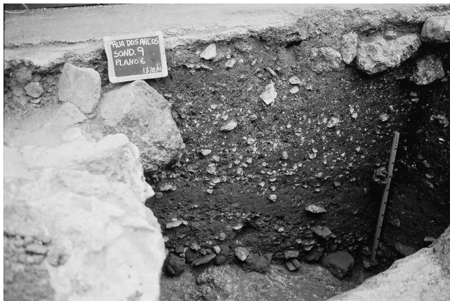
Figura 3. Rua dos Arcos, sondagem 9: estratigrafia de enchimento da cavea .

Junto a esta sondagem, e já dentro da propriedade, eram claríssimos os vestígios à superfície do que seria um destes muros radiais realizado em alvenaria com uma argamassa de cal semelhante à observada noutros pontos de Conimbriga. Nesta sondagem, nas unidades 48 e 54, que adscritas a planos diferentes de escavação pertenciam à mesma camada, recolheram-se alguns fragmentos de terra sigillata : 2 fragmentos de fundo de pratos de TSSG que, devido ao facto de não mostrarem vestígios do ônfalo característico das produções sud-gálicas, adaptam-se especialmente bem a serem identificados como pratos Drag. 18 9 . O perfil triangular do pé indica a sua inclusão na variante A, datável entre 15 e 30 d.C. 10 . Identificaram-se também 4 fragmentos de TSI pertencentes a uma cratera da forma Drag. 11, augusto-tiberiana 11 ; as tipologias mais actuais observam pouco a forma do pé, mas a forma no geral parece não ultrapassar o reinado de Tibério 12 .