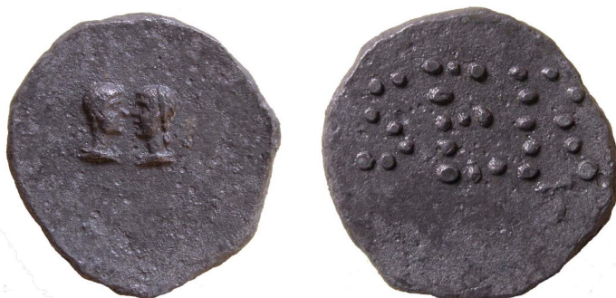
Figura 8. Basílica do fórum de Conimbriga: tessera de chumbo, a) anverso, b) reverso.