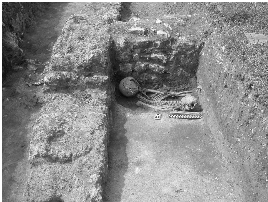
Figura 7. Sondagem de 2013: enterramento.

Um dos aspetos mais relevantes desta intervenção foi a descoberta do enterramento de um indivíduo do sexo feminino localizado ao longo do muro correspondente à u.e. 14. O cadáver foi deposto numa fossa simples aberta no saibro correspondente ao pavimento ou nível de circulação do compartimento (u.e. 13), colocado em decúbito dorsal, com orientação Oeste-Este (Fig. 7) 26 . Trata-se de um compartimento aparentemente de pequenas dimensões (cerca de 2 metros de largura).