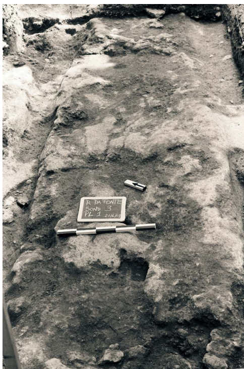
Figura 2. Rua da Fonte, sondagem 3: aspeto dos rodados.

mentação. Foi precisamente nesta Sondagem 3, e na sua ampliação, que se depositou alguma expectativa em determinar o limite do anfiteatro, ainda que fosse como estrutura negativa no tufo. Não se verificou esta evidência, mas apenas a regularização do tufo e a marcação dos rasgos para os rodados (Fig. 2).