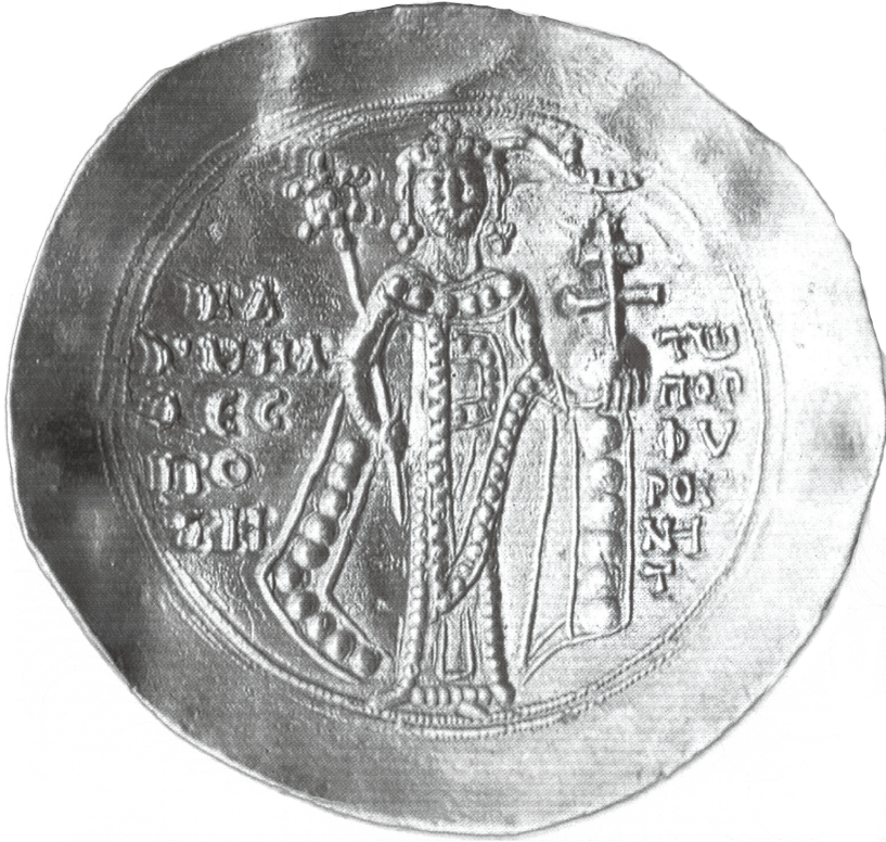
Moeda de ouro do imperador Manuel I (1143-1180)