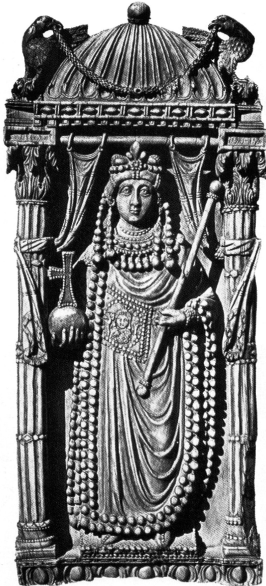
Imperatriz anónima (provavelmente Ariadne). Marfim, tábuas de díptico imperial de fins do séc. V - inícios do séc. VI. Florença, Museo Nazionale del Bargello.

Giorgio Ravagnani, Imperatori di Bisanzio , Bolonha, 2008, plate 1