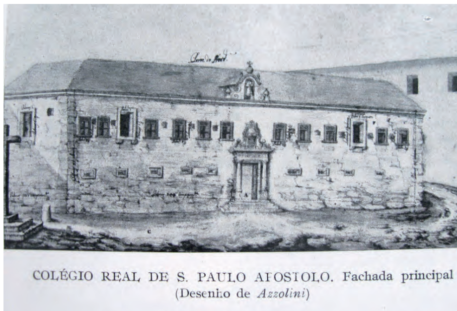
Figura 2 – Projecto do Colégio Real de S. Paulo Apóstolo, do arquitecto Giacomo Azzolini, por 1774, a pedido do Bispo de Coimbra. (Museu Machado de Castro).

Os primeiros anos do IC serviram, principalmente, para alicerçar a instituição de acordo com os objectivos que haviam sido definidos aquando da sua fundação, afirmando-se de forma autónoma à AD. Aspirava tornar-se um “ centro aglutinador e ‘mãe do conhecimento’ da cultura dialéctica das ideias a nível de Coimbra ” (Xavier, 1992, p. 27). Para estes intentos contribuíram a garantia de financiamento da publicação do jornal científico e literário e a posse definitiva das instalações no Colégio de S. Paulo, o Apóstolo 2 (Fig. 2), através da portaria governamental de 5 de Setembro de 1853, e a aprovação dos seus estatutos pelo decreto de 26 de dezembro de 1859, assinado por Fontes Pereira de Melo.