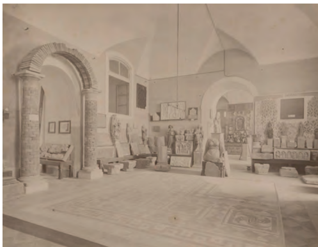
Figura 3 – Primeira sala do Museu de Antiguidades do Instituto de Coimbra.

Em 5 de março de 1873, por deliberação numa sessão da III Classe, foi criada uma secção de Arqueologia. Os trabalhos desta secção previam a realização de explorações arqueológicas a fim de se recolherem objectos relevantes, que, juntamente com outros cedidos por instituições ou particulares deveriam constituir uma colecção que servisse de recheio a um museu, situado numa sala do rés-do-chão do Colégio de S. Paulo o Eremita (Castro, 1874, p.89), não muito longe do Colégio de S. Paulo, O Apóstolo. Este museu foi adquirindo importância com o avolumar de objectos, o que levou à prossecução de novas explorações, que incidiram especialmente nas povoações de Condeixa, Montemor-o-Velho, Tentúgal, Ançã, S. Marcos e na própria cidade de Coimbra ( idem , p.92). O Museu de Antiguidades (Fig. 3), confiado à secção de Arqueologia do IC, só foi oficialmente inaugurado em 26 de Abril de 1896. O acervo deste museu foi o ponto de partida do Museu Nacional Machado de Castro, criado por decreto-lei de 26 de maio de 1911, que, portanto, hoje é mais do que centenário.