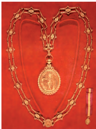
Figura 1 – Colar com a insígnia do Instituto de Coimbra.

A primeira reformulação dos estatutos originais, de 3 de Janeiro de 1852, surgiu nos já referidos estatutos de 1860. Em Assembleia geral de 4 e 7 de Junho de 1882 foram aprovadas alterações dos estatutos, onde se destacou a descrição da medalha de prata a ser usada pelos sócios efectivos (Fig. 1). Esta teria a inscrição – Instituto de Coimbra 1852, de um lado e a insígnia da sociedade no outro, com a legenda Auro Pretiosior 1 , devendo ser usada suspensa de um duplo colar de prata.