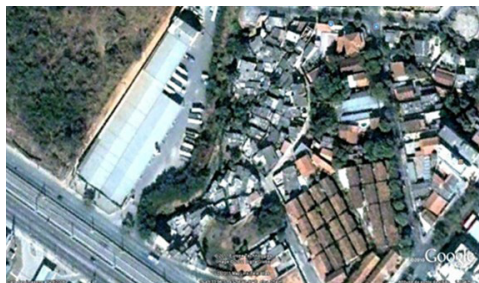
Figura 4a (1999)

O trabalho três (3), referente à Percepção ambiental da população da vila Bacuraus teve como objetivo verificar a percepção sobre riscos ambientais dos moradores e a relação que eles têm com o lugar onde moram (Figura 4). A vila foi revitalizada em 2005, o córrego retificado e novas residências construídas para a população ribeirinha. A população preferiu ficar no local e ocupar as novas edificações.