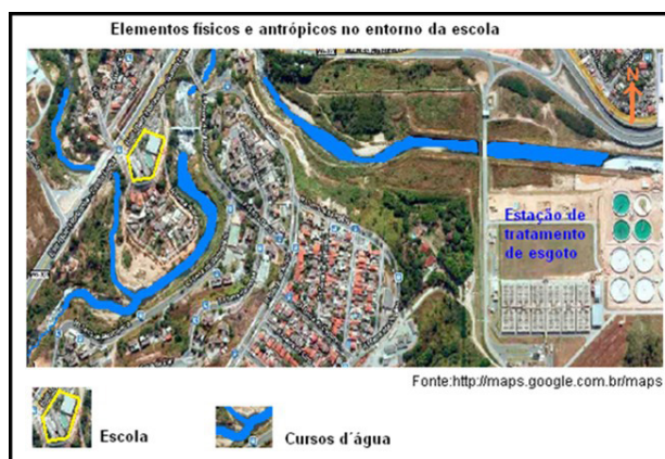
Figura 3: Ambiente no entorno da escola

O trabalho dois (2) contemplou o assunto “Saberes de geografia física no cotidiano da escola e potencial de risco no contexto escolar” e foi realizado com professor de geografia e alunos do 9º ano, da Escola Municipal Secretário Humberto Almeida, em 2011 (Figura 3). O estudo do meio da área do entorno dessa escola possibilita discussões in loco a respeito de dinâmica fluvial, crescimento urbano, uso e ocupação do terreno, perigos, vulnerabilidade dos sujeitos e edificações e dos riscos ambientais.