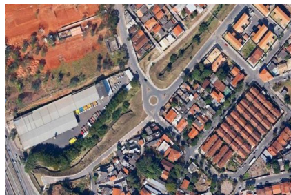
Figura 4b (2011)

Figuras 4a e b: Vila bacuraus antes e depois da revitalização.