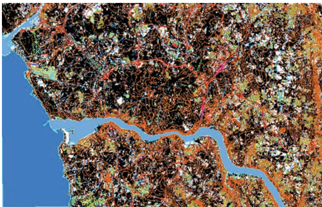
Figura 1 - Informação adquirida respeitante a uma folha da carta militar à escala 1:25000 do IGeoE

Cartográfica destinada à representação do terreno em duas dimensões. Aqui a informação é simbolizada e editada com o objetivo de possibilitar uma melhor visualização e interpretação à escala que se destina. Posteriormente, essa mesma Base de Dados Cartográfica é sujeita a diversos processos de controlo de qualidade, findos os quais, os dados geográficos voltarão a ser editados até estar garantida mais uma vez a qualidade suficiente para o passo seguinte, a impressão. No entanto, se a finalidade da informação for outra que não a cartografia, é importante garantir uma consistência topológica, o que se consegue através de um conjunto de processamentos que corrigem erros topológicos garantindo assim que a Base de Dados Geográfica a tenha. Tendo a noção de que até aqui a informação era adquirida em formato DGN, com o qual eram bastante complexos esse tipo de processamentos, é precisamente neste ponto que se pretende e espera vir a tirar grande partido do conceito de base de dados na cadeia de produção.